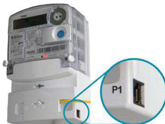
Afbeelding 2: voorbeeld consumentenpoort (P1-aansluiting) voor directe uitleesmogelijkheden

Consumenten die de ontwikkeling van het eigen elektriciteitsverbruik nog frequenter of zelfs in real time willen volgen, kunnen gebruik maken van de consumentenpoort (P1-poort) op de slimme meter (zie afbeelding 2). Via een op deze poort aangesloten energieverbruiksmanager ontvangt de consument real time informatie over de meterstand, voor elektriciteit is dit elke 10 seconden up-to-date en voor gas elk uur. 20 Daarom wordt feedback via deze consumentenpoort ook wel directe feedback genoemd.