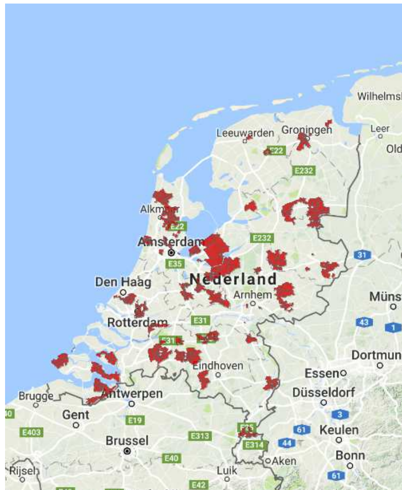
Abbeelding 1: Overzicht aanbodingsgebieden slimme meter tot eind 2016

In de postcodegebieden waar in 2016 de slimme meter is uitgerold waren in totaal 23.290 huishoudens woonachtig die deel uitmaken van het onderzoekpanel voor de Consumentenmonitor. Hiervan hebben 2.466 huishoudens hun ervaringen desgevraagd teruggekoppeld nadat bij hen een slimme meter aangeboden was. Een netto-respons derhalve van ruim 10%.