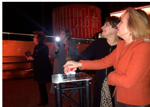
Minister Ploumen en minister Bussemaker tijdens de VN-campagne 16 days against violence against women