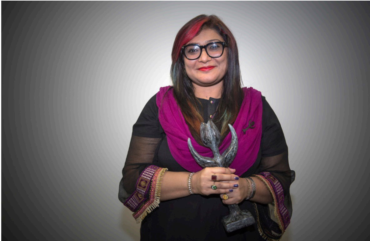
Winnares Mensenrechtentulp 2016, Nighat Dad

op het sportveld etc. De Mensenrechtendag wordt in Nederland en op de posten traditiegetrouw zeer actief en op creatieve wijze gevierd. De Nederlandse ambassades organiseerden op of rondom deze dag evenementen met speciale aandacht voor de Nederlandse mensenrechtenprioriteiten, zoals paneldiscussies met mensenrechtenactivisten, denktanks en het corps diplomatique , vertoningen van door Movies that Matter beschikbaar gestelde films, en campagnes op sociale media. Veel van deze activiteiten zijn terug te lezen via het mensenrechtenblog .