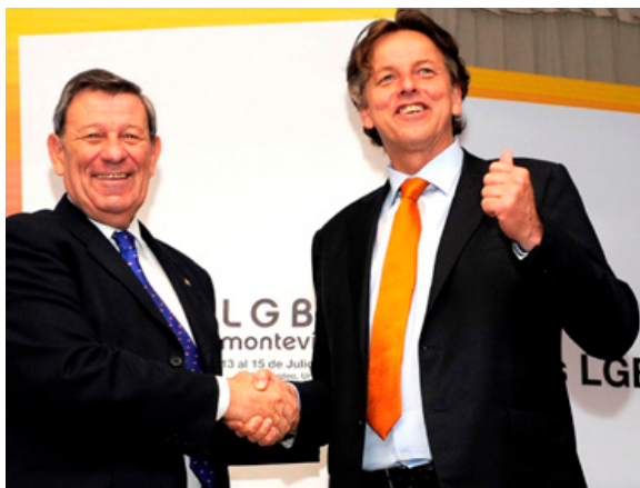
Minister Koenders en Uruguayaanse Minister van Buitenlandse Zaken, Rodolfo Nin Novoa, bij de Global LGBTI Human Rights Conference in Montevideo, Uruguay

In juli 2016 heeft Nederland samen met Uruguay in Montevideo de succesvolle Global LGBTI Human Rights Conference georganiseerd, met als doel de rechten van LHBTI's wereldwijd te bevorderen. Door de betrokkenheid van Uruguay bij de organisatie van de conferentie is het gelukt ook veel niet-westerse landen te laten deelnemen. Ook het maatschappelijk middenveld was nauw betrokken bij de organisatie en goed vertegenwoordigd tijdens de