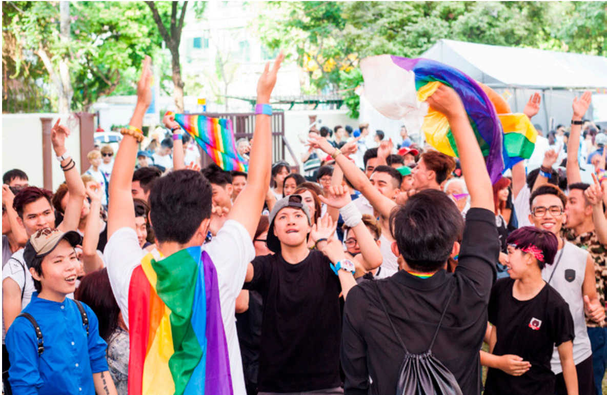
VietPride in Hanoi, Vietnam

tevens voor onderwijsdoelen gebruikt. Reacties zijn positief; de film is niet-confronterend en is een krachtig instrument om bij te dragen aan sociale acceptatie.