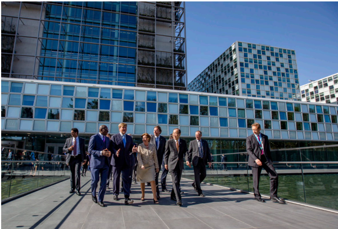
Opening van de permanente huisvesting van het Internationaal Strafhof, april 2016 (van links naar rechts, Minister van Justitie van Senegal Sidiki Kaba, Zijne Majesteit Koning Willem-Alexander, President van het Strafhof Silvia Fernández de Gurmendi, Minister Koenders, voormalig Secretaris Generaal van de Verenigde Naties Ban Ki-moon)

Vanuit het Mensenrechtenfonds zijn in 2016 meerdere projecten gefinancierd, waaronder de oprichting van een Forensic Institute for Training and Documentation door Physicians for Human Rights . Dit instituut heeft als doel expertise over te brengen over het verzamelen van forensisch bewijsmateriaal van ernstige schendingen en misdrijven. Het richt zich op het vergroten van de forensische kennis van onder meer dokters en verpleegkundigen ten behoeve van het documenteren van deze misdrijven voor waarheidsvinding en rechtszaken. Ook de bijdrage van € 1 miljoen aan OHCHR voor een snelle oprichting van de bewijzenbank voor Syrië is uit het Mensenrechtenfonds gefinancierd.