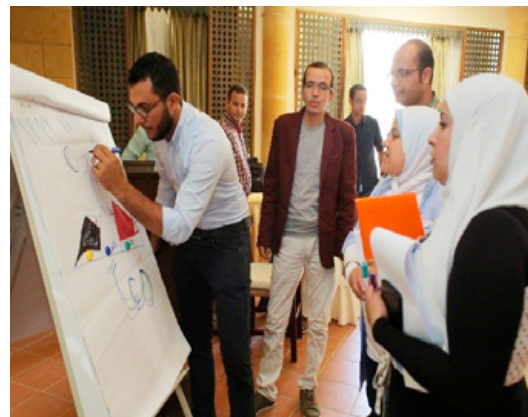
Deelnemers in gesprek tijdens workshop van de ngo Coptic Evangelical Organization for Social Services (CEOSS)

zijn drie projecten geïdentificeerd en gefinancierd die elkaar versterken. Ze richten zich op het stimuleren van de dialoog tussen religieuze en sociale groepen en het beschermen van vervolgte minderheden d.m.v. rechtsbijstand en verlenen van onderdak. Zo geeft de ngo Centre for Legal Aid, Assistance and Settlement (CLAAS) onderdak en rechtshulp aan religieuze minderheden die bedreigd worden. Het project zal aan circa 80 personen onderdak kunnen bieden en rechtshulp geven bij 100 rechtszaken.