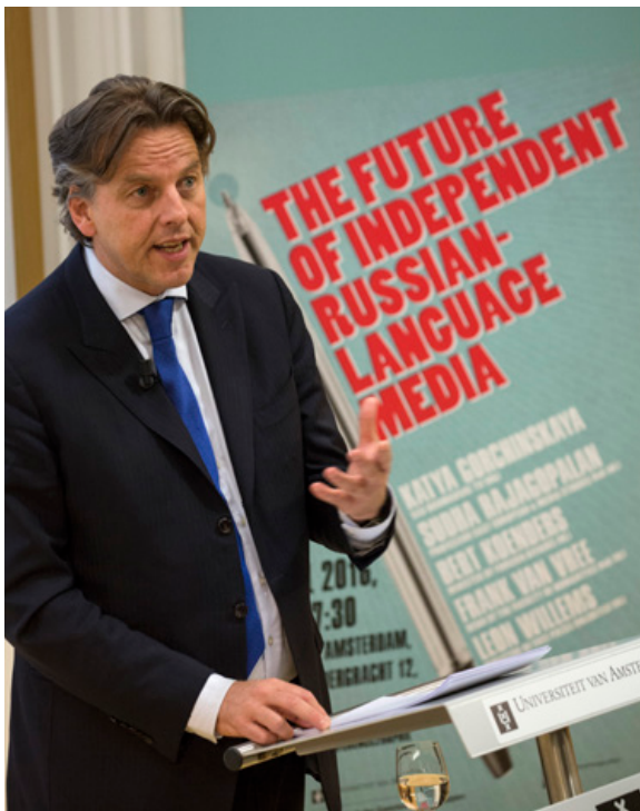
Minister Koenders spreekt tijdens de conferentie The Future of independent Russian-language media bij de Universiteit van Amsterdam.

De Nederlandse inzet bestrijkt ook het bevorderen van een gevarieerd medialandschap zodat burgers een geïnformeerde keuze kunnen maken. Persvrijheid en een gebalanceerd medialandschap zijn voorwaarden voor een goed functionerende democratie. Deze staan in veel Russischtaalige landen onder grote druk, mede vanwege de dominante positie die media gecontroleerd door de Russische staat innemen in het hele Russische taalgebied. Minister Koenders heeft deze problematiek onder de aandacht gebracht tijdens de door het ministerie georganiseerde conferentie The future of independent Russian-language media , die plaatsvond op 29 april 2016 bij de Universiteit van Amsterdam.