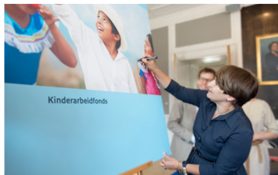
Minister Ploumen ondertekent Fonds Bestrijding Kinderarbeid

De ambassade in Turkije zette in 2016 de samenwerking voor een meerjarig project tegen kindarbeid in de Turkse hazelnootsector voort met de International Labour Organisation (ILO), Turkse nationale en decentrale overheden en CAOBISCO, de brancheorganisatie voor de hazelnoot verwerkende industrie. Tot najaar 2016 zijn ruim drieduizend kinderen bereikt met dit project. De meerderheid hiervan gaat nu wel naar school in plaats van werken in de hazelnootsector.