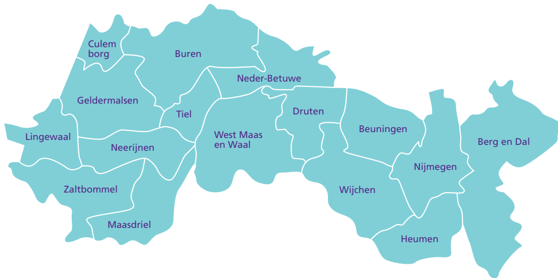
Figuur 1: geografische omvang VRGZ

De Veiligheidsregio Gelderland-Zuid (VRGZ) is een organisatie voor brandweezorg, geneeskundige hulpverlening en voorbereiding en coördinatie op het gebied van rampenbestrijding en crisisbeheersing. Dit regionale samenwerkingsverband van zestien gemeenten 1 is gebaseerd op de Wet gemeenschappelijke regelingen en de Wet veiligheidsregio's.