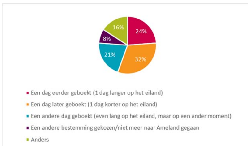
Figuur 6.3: Antwoordverdeling van bezoekers met auto op de vraag 'Wat had u gedaan als alle vaarten naar Ameland die u acceptabel vindt vol geboekt waren?'

We hebben de bezoekers die een auto mee hadden tevens gevraagd wat zij zouden doen wanneer er geen afvaart beschikbaar zou zijn binnen de voor hen acceptabele afvaarttijden. Uit de analyse blijkt dat 8% van de bezoekers niet naar Ameland zou gaan. De meeste bezoekers geven aan een dag eerder of later te gaan, een andere periode te kiezen of de auto niet mee te nemen.