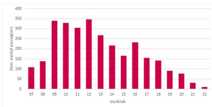
Figuur 6.1: Gemiddeld aantal reizigers Holwerd - Ameland per afvaart per uurblok

Een ruimer tijdvenster is voor reizigers aantrekkelijk: in de 5-kwartierdienst met 7 afvaarten is het mogelijk om 22.15 nog uit Holwerd te vertrekken, waar dat in de huidige situatie om 19.30 uur is. Kijken we naar de bezettingscijfers van de huidige afvaarten dan is duidelijk te zien dat het aantal reizigers van de laatste afvaarten (gemiddeld veel) lager is dan de bezetting van de andere afvaarten.