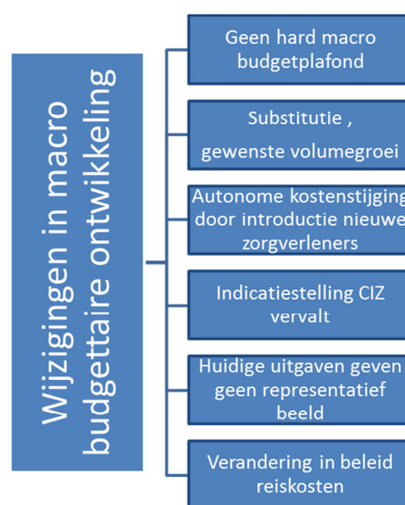
Figuur 5: Macro budgettaire ontwikkeling

De macro budgettaire ontwikkeling en beheersing zijn in figuur 5 en figuur 6 weergegeven.