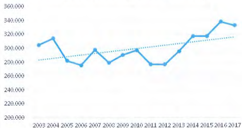
Passagiers Lauwersoog - Schiermonnikoog