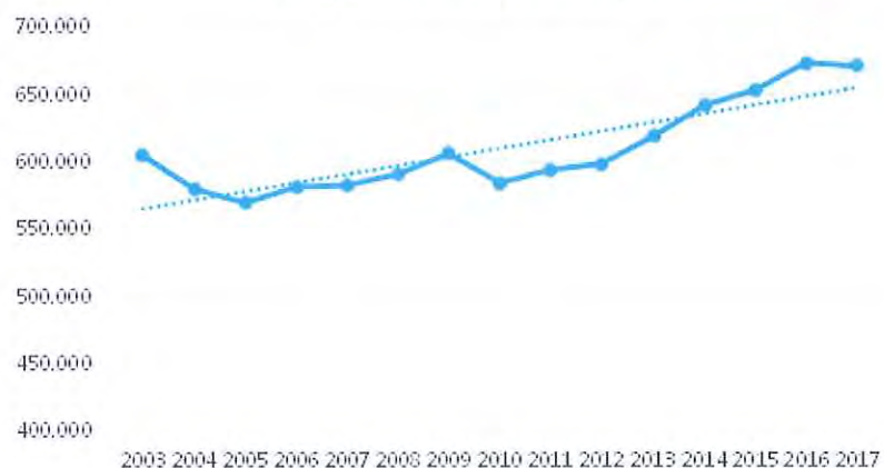
Passagiers Holwerd - Ameland

Voertuigen naar Ameland: Het autovervoer naar Ameland houdt gelijke tred met de ontwikkeling van het personenvervoer.