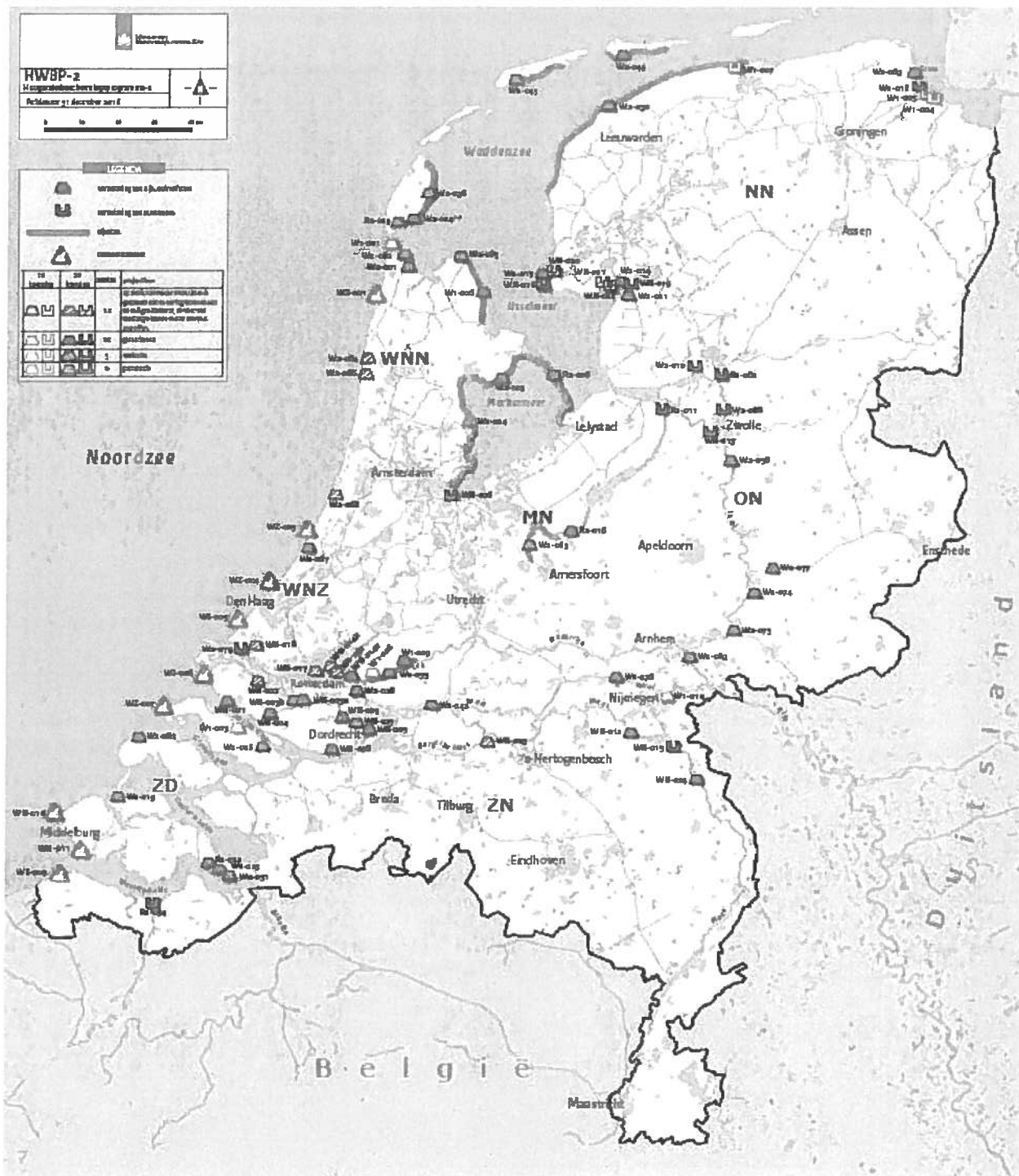
Figuur 2 Actuele scope van het programma, peildatum 31 december 2018