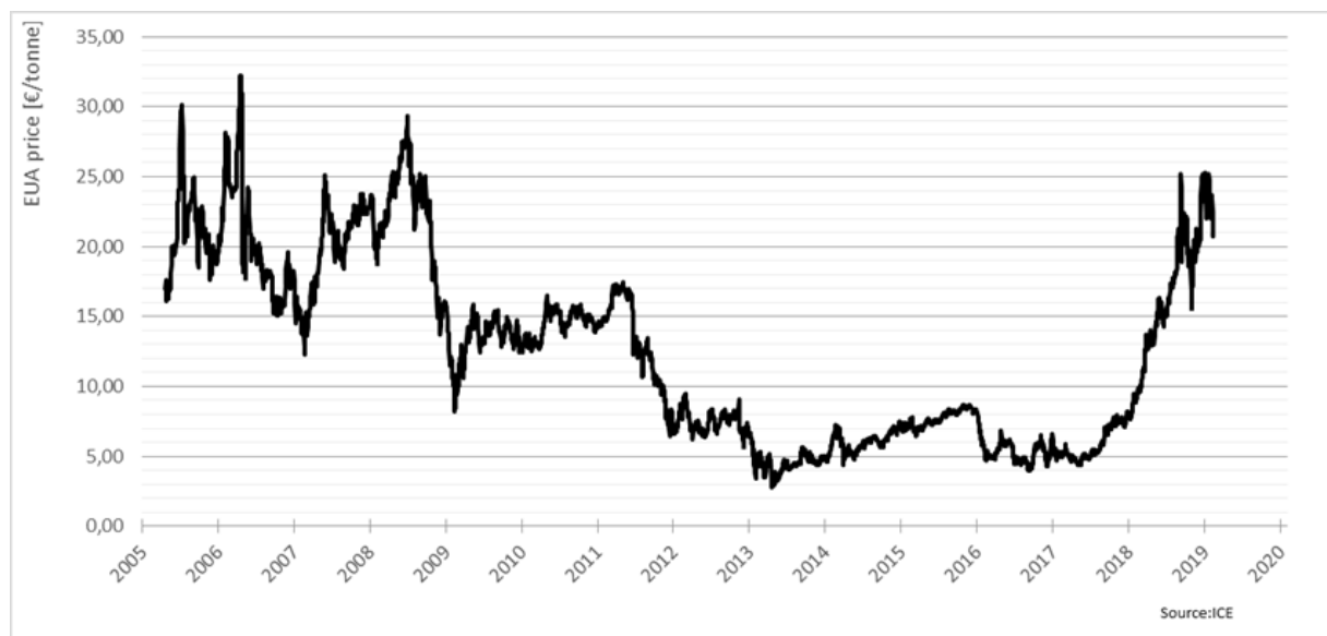
Figuur 4 - Ontwikkeling van de prijs van een ton CO 2 in het EU-ETS vanaf 2005