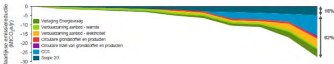
Figuur 2 – Potentieel reductiepad van de energie-intensieve industrie tot 2030

Uit de inventarisatie bleek dan ook dat het technisch goed mogelijk is de beoogde 14,3 Mton CO 2 -reductie via diverse technologiesporen tot stand te brengen. Uit de inventarisatie kwam ook naar voren dat er daarnaast door keteneffecten nog eens 6 à 7 Mton extra CO 2 -besparing mogelijk is (figuur 2) 12 . De inventarisatie richt zich vooral op projecten die zich nog in de demonstratie- en innovatiefase bevinden en dus pas na verloop van tijd tot effect leiden. Naar verwachting zal de industrie 9 tot 15 miljard euro moeten investeren om deze projecten ook daadwerkelijk tot stand te brengen 13 .