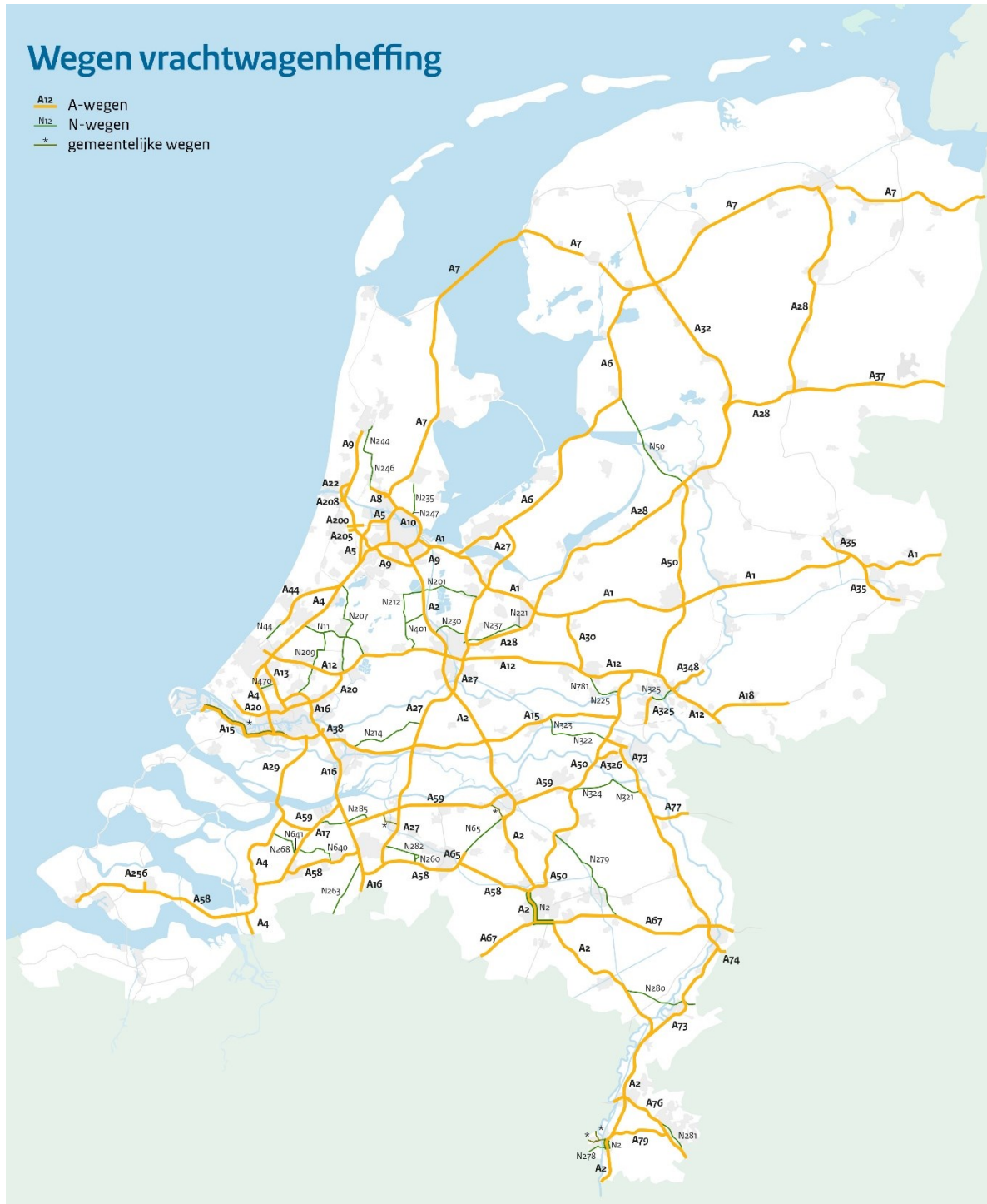
Figuur 2: Heffingsnetwerk van Nederland