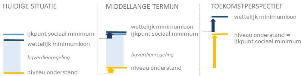
Figuur 1: Perspectief inkomenskant 1

1 Bij huidige situatie is de situatie voor Bonaire weergegeven waar het huidige niveau van het wettelijk minimumloon onder het niveau van het ijkpunt sociaal minimum voor een alleenstaande ligt. In de hoogte van het ijkpunt is uitgegaan van een redelijk niveau van de kosten voor basale uitgaven.