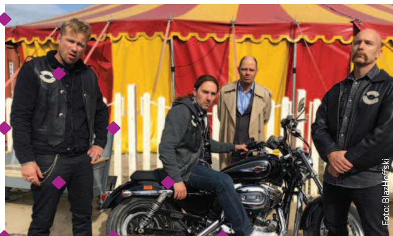
Begroting NPO 2020