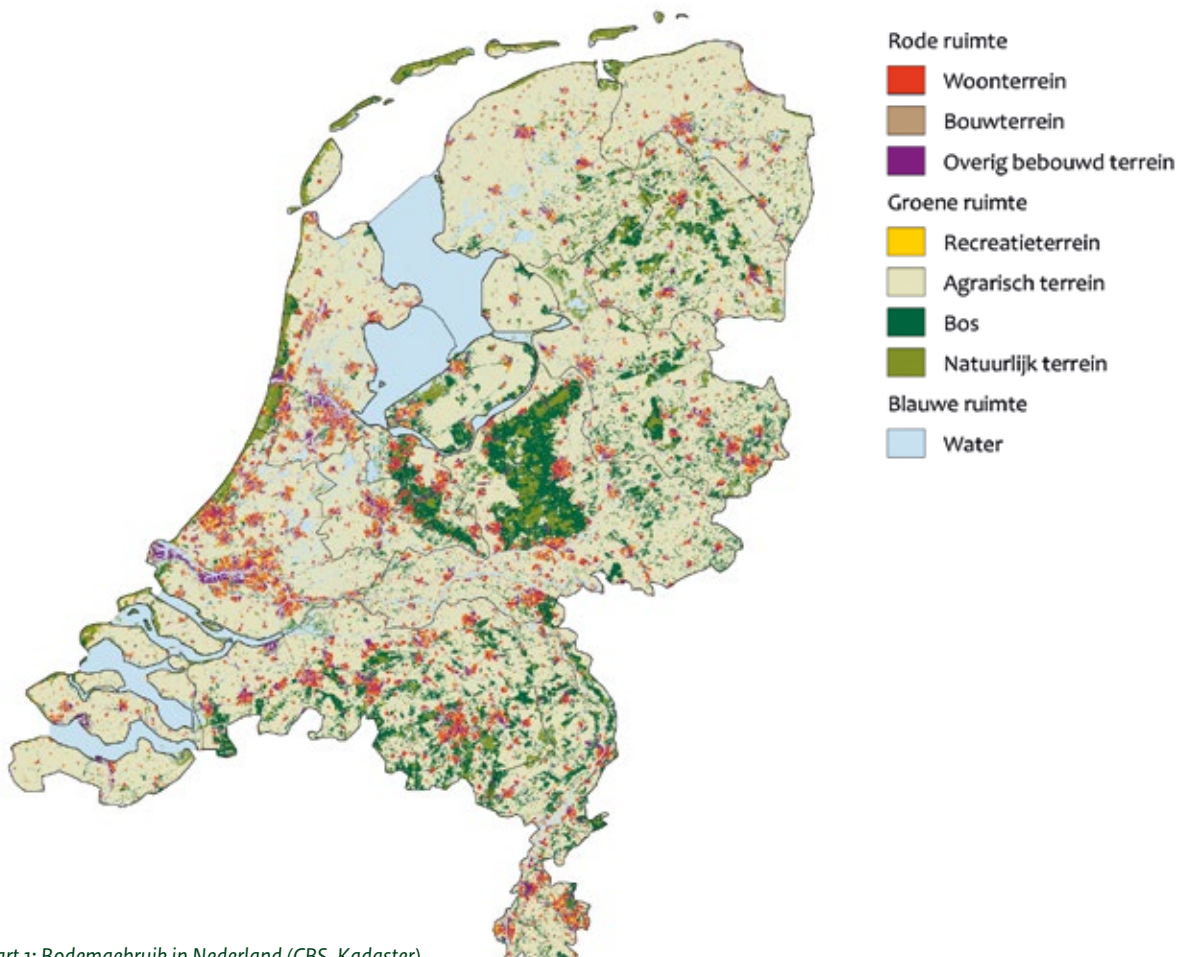
Kaart 1: Bodemgebruik in Nederland (CBS, Kadaster)

Maar soms moeten we andere keuzes maken, om bijvoorbeeld de veiligheid te borgen of om ruimte te creëren voor nieuwe woningen. In het reguliere beheer worden bomen gekapt voor verjonging en productie (zie het thema 'Vitaal bos'). Ook is het soms nodig om bos om te vormen naar andere typen natuur. Dat komt omdat het in Nederland slecht is gesteld met de plant- en diersoorten die afhankelijk zijn van open landschappen, zoals heide. Dit komt vooral door de hoge stikstofneerslag. We blijven daarom de herstelmaatregelen voor deze kwetsbare natuur uitvoeren.