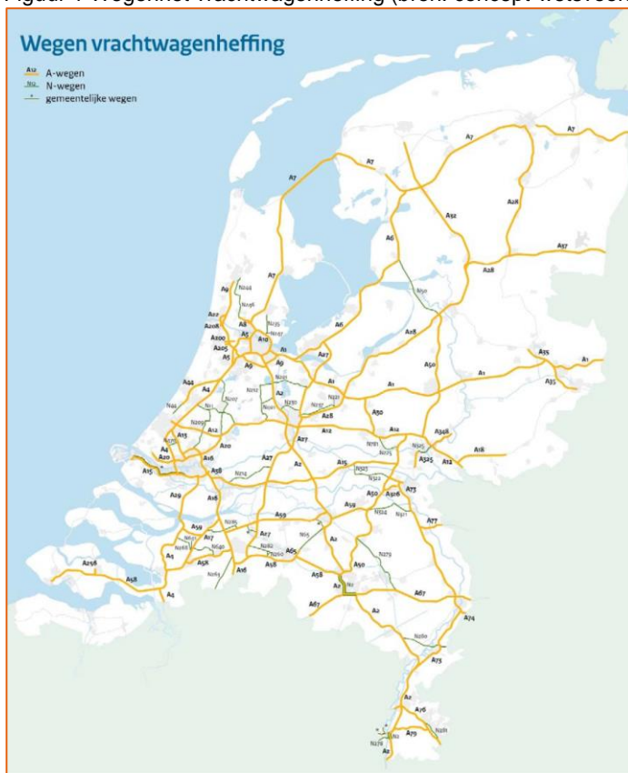
Figuur 1 Wegennet vrachtwagenheffing.

Tegenover de invoering van de heffing staat: