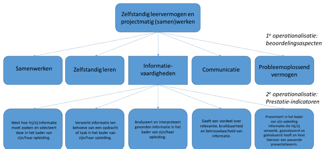
Figuur 2 Kwaliteit en interpretatie van assessment scores (naar Sluijter & Straetmans, 2012)

De PPS-methode houdt in dat er een dossier van resultaten – een prestatiedossier – wordt aangelegd op basis van de volgende principes: