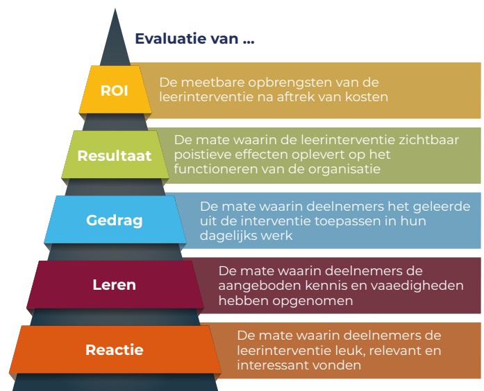
Figuur 2. Evaluatiemodel van Kirkpatrick 29

Om meer grip te krijgen op de doeltreffendheid van de KiPZ-regeling, moet de doelstelling van KiPZ duidelijker geformuleerd worden: wat valt er wel en niet onder strategisch opleiden?