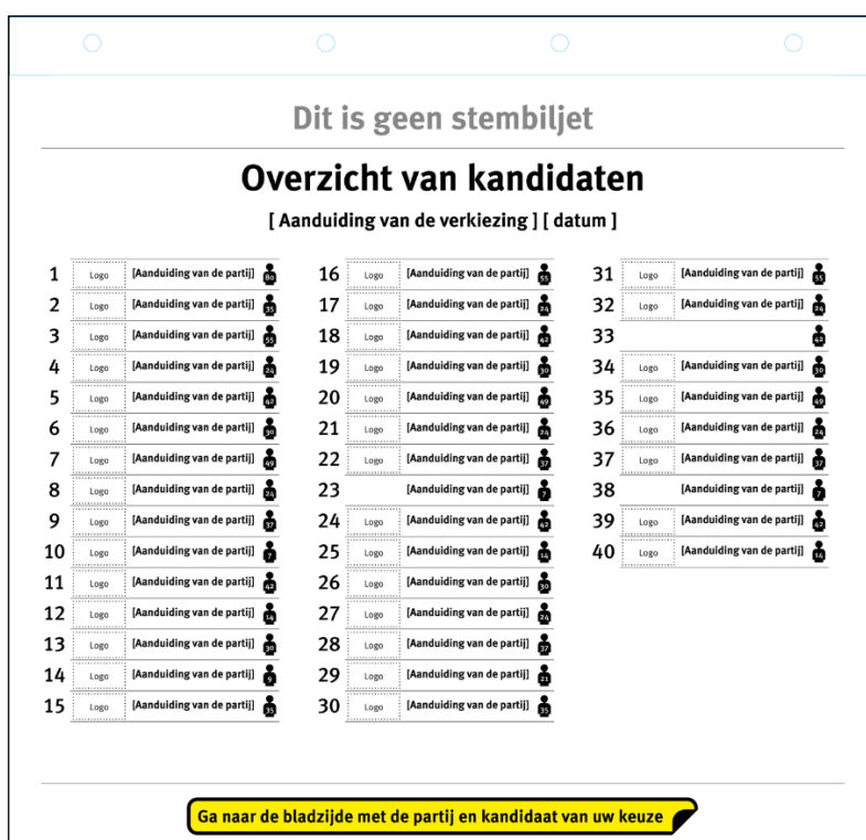
Schets van voorzijde van het overzicht van kandidaten

De namen en de nummers van de kandidaten kan de kiezer terugvinden in het Overzicht van kandidaten dat de kiezer voor de verkiezingsdag thuis krijgt, en dat tevens voor de kiezer in het stembokje beschikbaar is. In dat overzicht staan ook de overige gegevens van de kandidaten die op het huidige stembiljet staan, te weten voorletter(s), (eventuele) roepnaam, gemeente of woonplaats en eventueel geslacht. Verder staat op het overzicht, evenals op het stembiljet, bij elke partij het aantal kandidaten vermeld dat op de lijst staat. 15 De kiezer raadpleegt het Overzicht van kandidaten om na te gaan welk kandidaatsnummer hoort bij de kandidaat op wie hij wil stemmen. Hieronder staan twee schetsen afgebeeld van het Overzicht van kandidaten: een schets van de voorzijde van het Overzicht van kandidaten en een schets van een willekeurige pagina van een partij (hier: pagina 4, partij 4). Bij ministeriële regeling wordt een model voor dit overzicht van kandidaten vastgesteld.