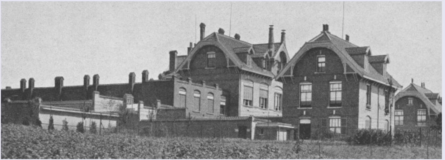
De Hunnerberg - toen nog Tuchtchool voor jongens - in 1906.