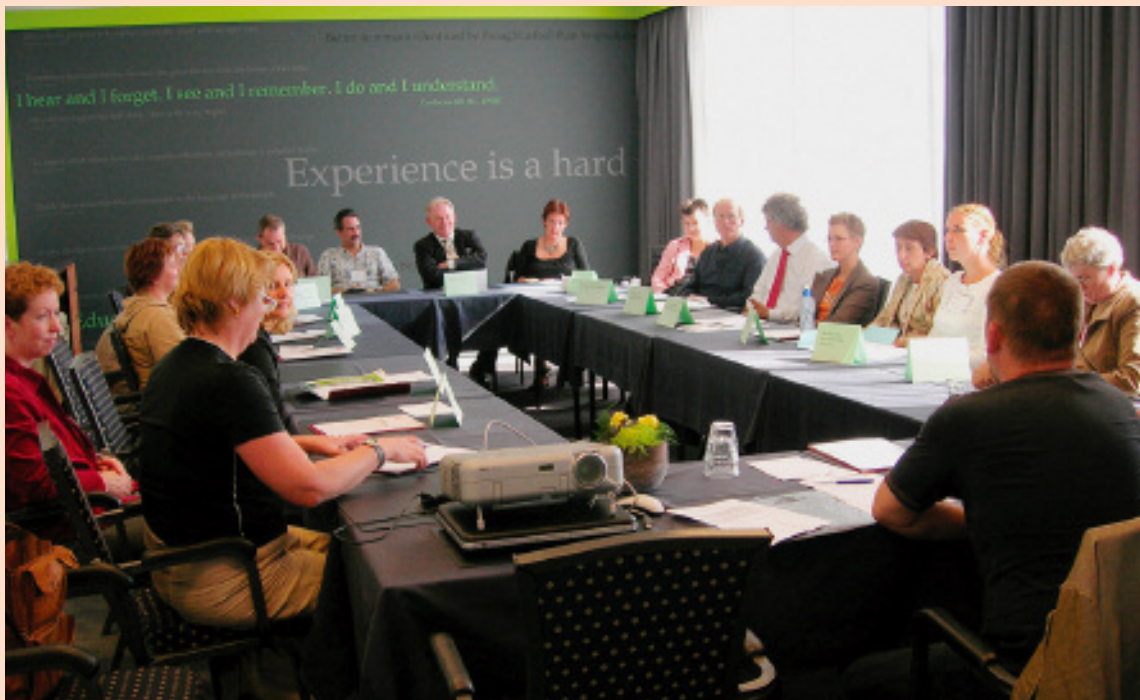
Geanimeerde discussies in workshops met Limburgse gezinscoaches en lokale coördinatoren multiprobleemgezinnen

en dit legt de basis voor goede hulpverlening. Onze ervaring leert overigens dat gezinscoaching geen beroep is, maar een taak . Volgens ons hoeft een gezinscoach geen professional te zijn, zolang het maar iemand is in wie het gezin vertrouwen stelt. Een andere ervaring is dat veel multiprobleemgezinnen behoefte hebben aan langdurige onderhoudshulpverlening.”