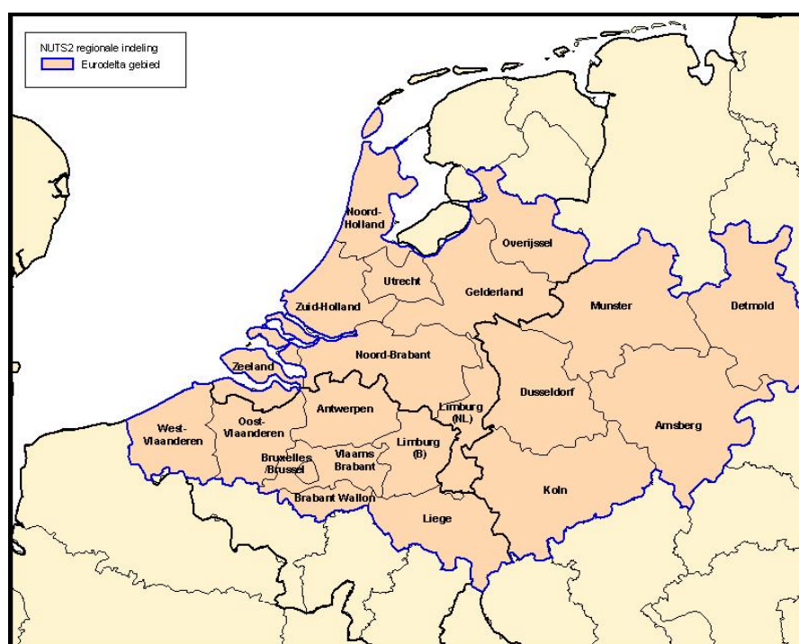
Fig.1 NUTS-2 regio's opgenomen in het hypothetisch onderzoeksgebied van de Raad

Voor alle duidelijkheid: het gaat hier om een voorlopig onderzoeksgebied . De Raad beveelt niet aan om dit gebied bestuurlijk af te bakenen.