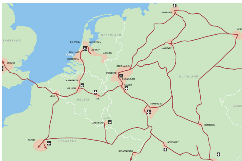
Fig.4 Hoge snelheidsverbindingen in Noordwest-Europa (>200 km/u)

Aan internationale bedrijven die bij de EU in Brussel komen praten over een geschikte vestigingsplaats in het Eurodeltagebied als "West Gateway to Europe" wordt documentatiemateriaal meegegeven, waarin onder meer het volgende kaartje is opgenomen.