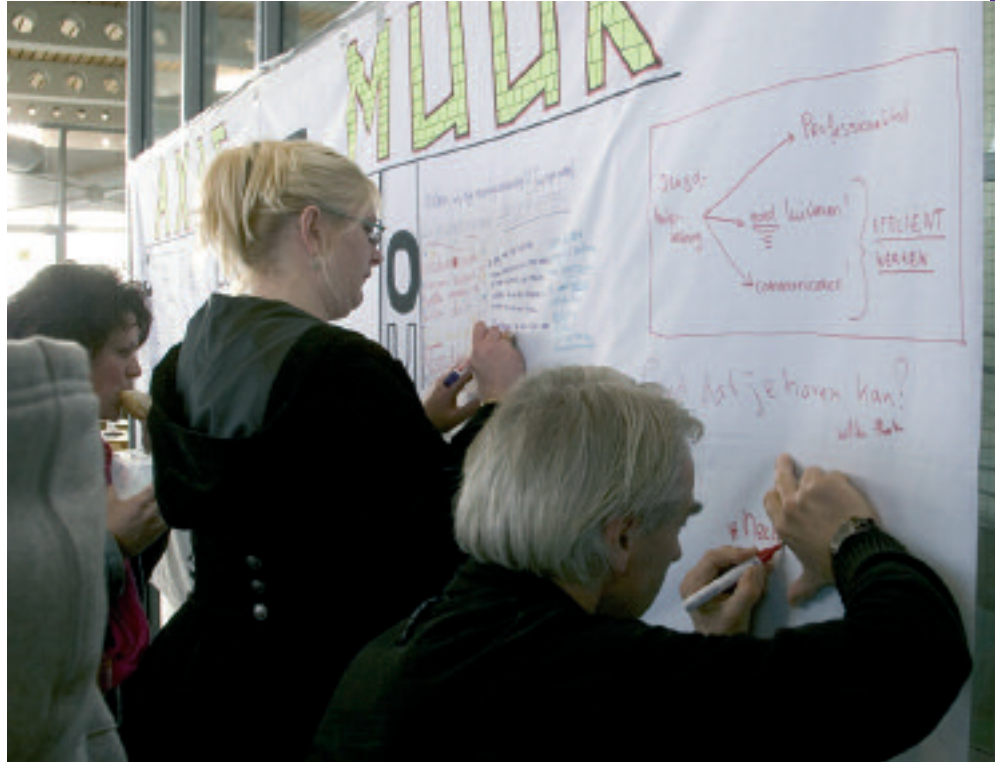
Deelnemers aan de Landelijke Cliëntendag konden hun reacties kwijt op een 'interactieve muur'

Veel vragen kwamen voort uit slechte ervaringen met de jeugdzorg, zoals te jonge hulpverleners, het ontbreken van inspraak, bureaucratie, eenzijdige rapportages, niet luisterende gezinsvoogden, de eigen bijdrageregeling en wachtlijsten. Uit de discussie kwam ook naar voren dat