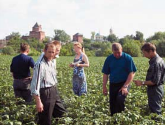
NIVAP-aardappeltrainingsprogramma in Kolomna.