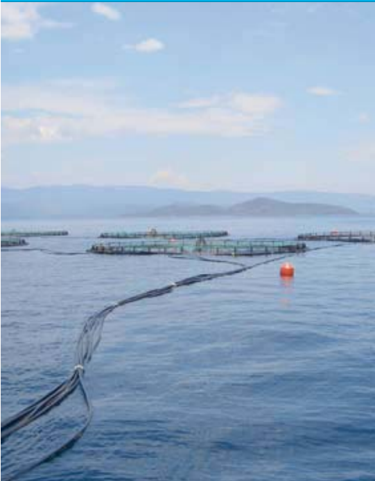
Drijvende kooien: In kooien zoals deze wordt zeebaars en dorade opgekweekt.

Van 24-27 oktober a.s. vindt in het WTC te Istanbul de visserijvakbeurs Future Fish Eurasia plaats. Aan de beurs is een internationale conferentie van de European Aquaculture Society gekoppeld met als thema: Aquaculture Europe 2007, Competing Claims.