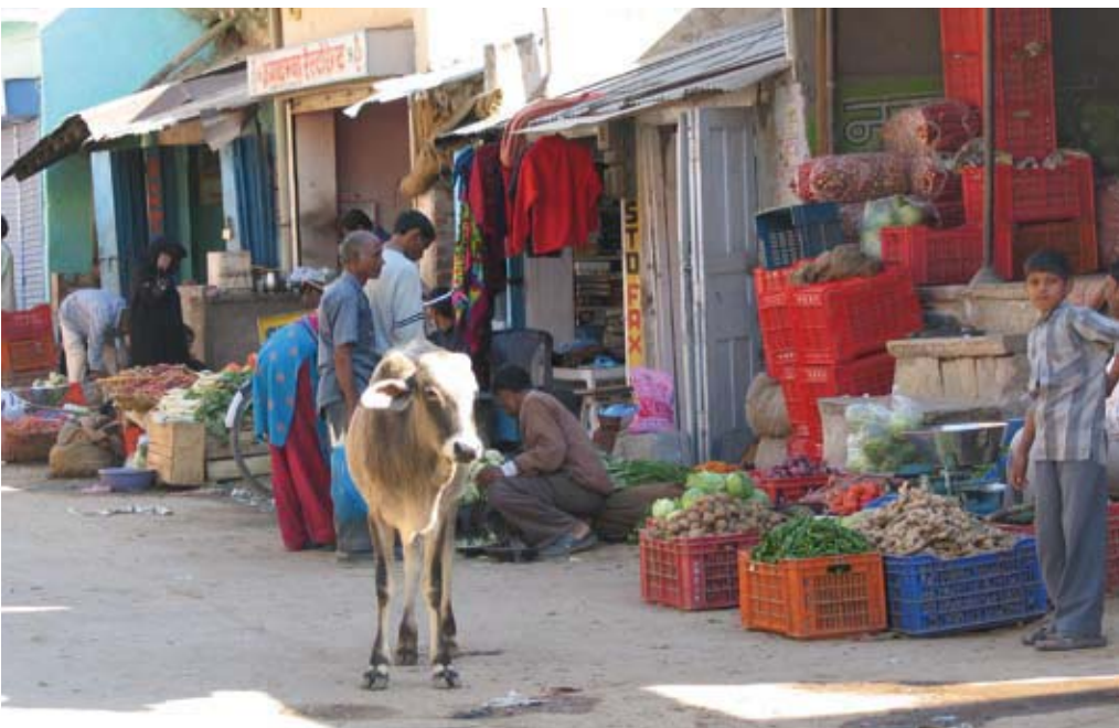
Retail in een middengrote Indiase stad.