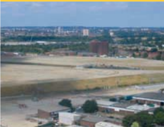
De locatie voor de Olympische Spelen is nu vooral nog een bouwplaats in ontwikkeling.