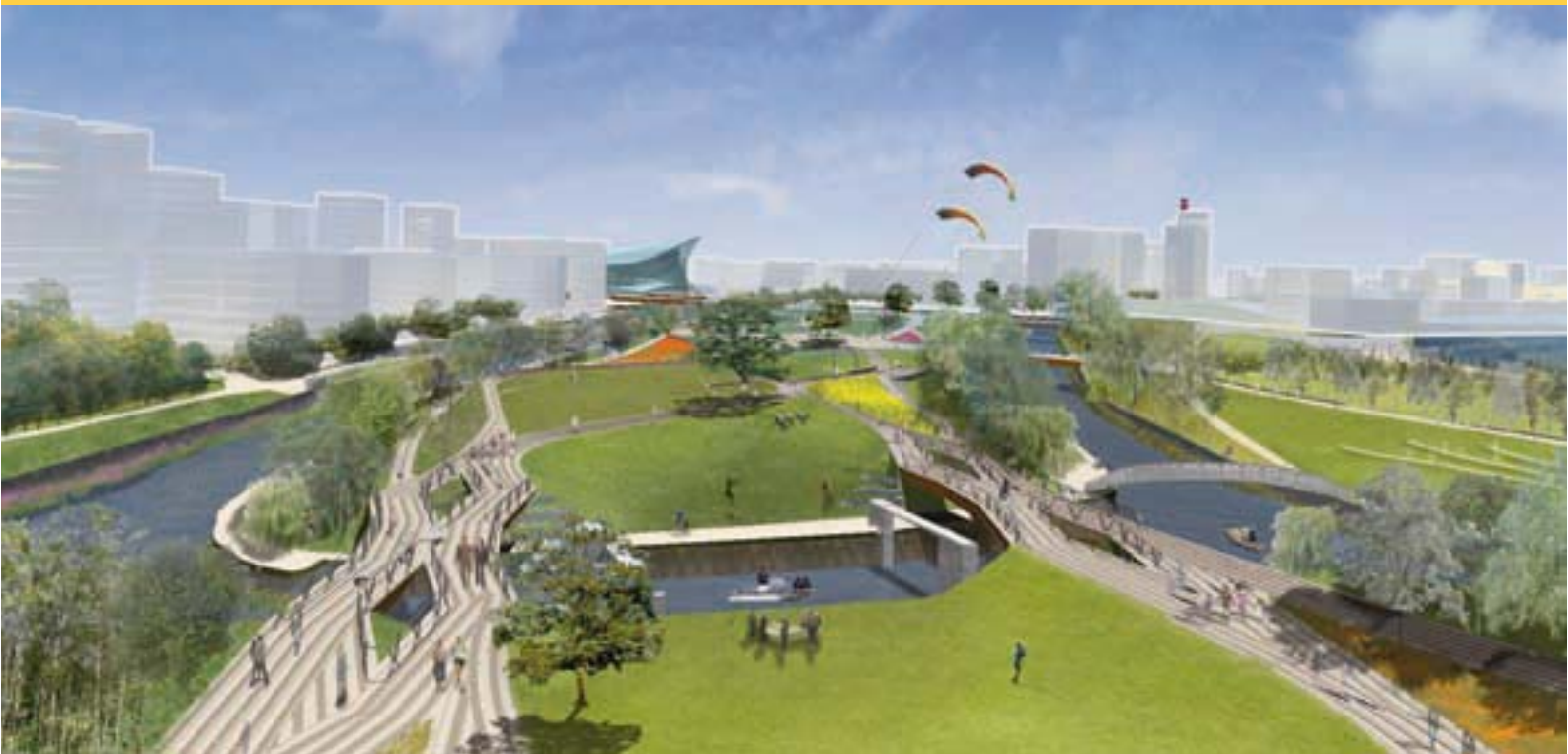
Impressie van het Olympische Park na de conversie van het terrein, na afloop van de Spelen van 2012.