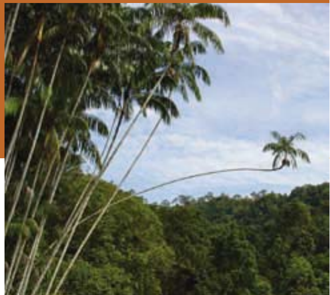
Grootschalige productie van palmolie.