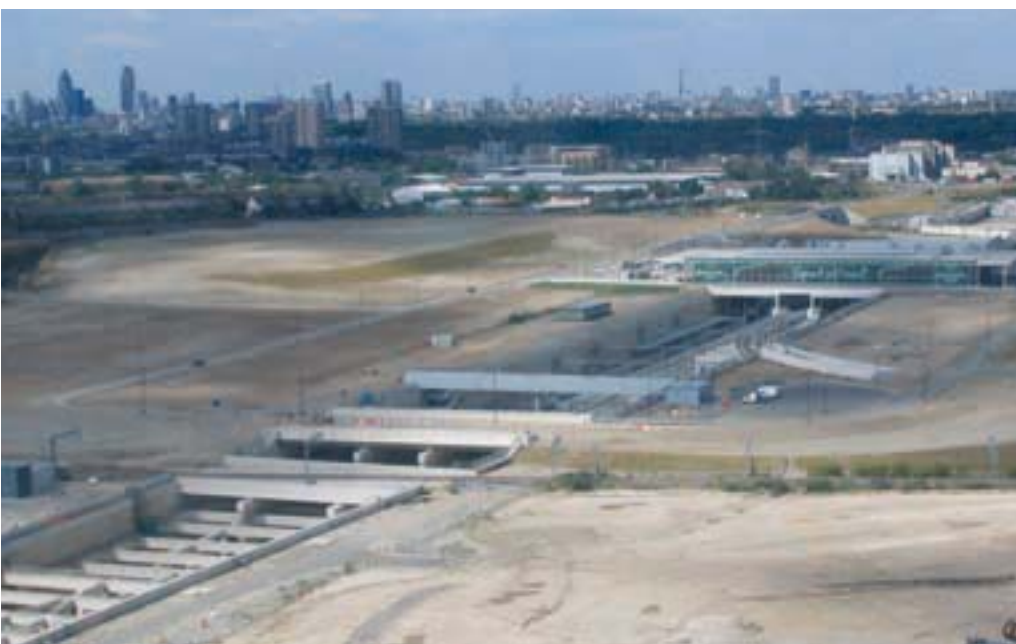
Verbindingen tussen de locatie van de Olympische Spelen en enerzijds Europa en anderzijds de stad Londen zijn essentieel: een nieuw station voor (internationale) treinverbindingen is gepland.

De toekomstige locatie voor de Olympische Spelen is thans nog één van de slechtst ontwikkelde en armoedigste delen van Londen. Duidelijk nevensdoel van de Londense bid voor de Spelen van 2012 was en is dan ook regeneratie van het gebied. De Spelen zullen dit gebied een blijvende sociaal-economische impuls moeten geven. Deze vermenigvuldiging van doelstellingen is de oorzaak van politiek geharrewar over de financiën, reden dat de Spelen de laatste tijd een aantal keren negatief in het nieuws zijn gekomen.