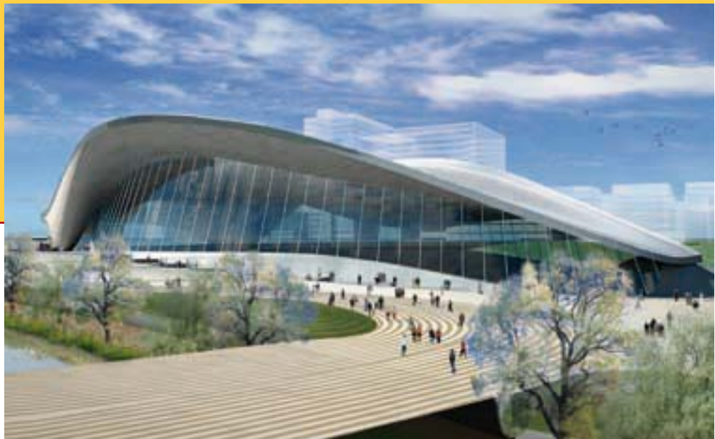
Het Aquatics Centre is een van de nieuw te bouwen accommodaties.

structurele en bouwprojecten. De London Organising Committee (LOCOG) brengt tenders uit voor contracten voor diensten. Op de website http://etenders.london2012.com kunnen bedrijven contracten bestuderen en gebruikmaken van een planning package .