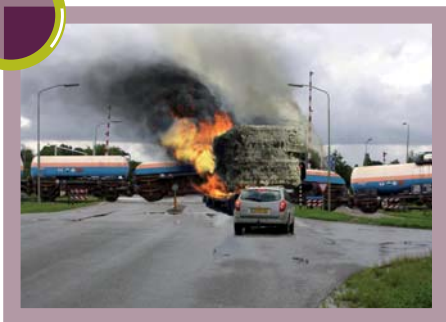
Groningen: Een botsing tussen een trein met een lading gevaarlijke chemicaliën en een vrachtwagen met hooi.

Hij laat zich inspireren door de risicokaart van de betreffende regio en informeert bij het eerste bezoek aan een regio naar relevante risico's. 'Het is moeilijk om de regio's met elkaar te vergelijken maar ik doe mijn uiterste best toch vergelijkbare scenario's op te stellen. Het spreekt vanzelf dat een regio met 60 BRZO-bedrijven een zwaardere voorbereidingslast heeft dan de regio waar maar twee van dergelijke risicovolle bedrijven zijn.'