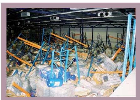
Brabant Zuid-Oost: Ingestorte stellingen in een opslagloods met chemicaliën.