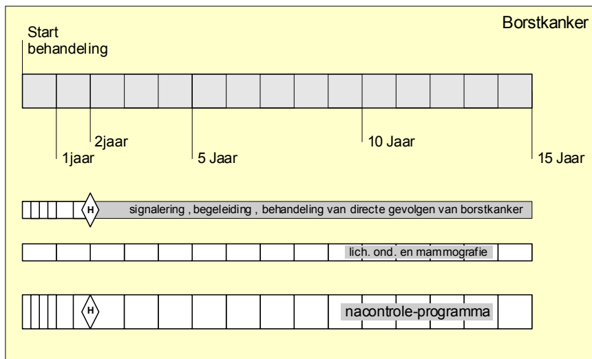
Figuur Programma van nacontrole: borstkanker.

Het totaalprogramma van nacontrole van borstkanker na borstsparende behandeling kan worden weergegeven in de onderstaande tijdbalk (zie onderstaande figuur).