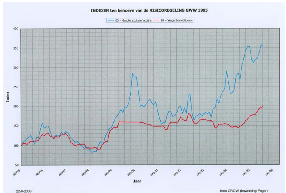
Figuur 2. Indexen ten behoeve van Risicoregeling GWW 1995 over de periode 1995 – 2006

Uit analyse van tijdreeksen blijkt dat de prijs van bitumen en asfalt wordt beïnvloed door de olieprijs. Het verloop in de bitumenprijs is echter vlakker dan de olieprijs. Dat maakt het volgens de projectgroep moeilijk om onregelmatigheden in de bitumenprijs te ontdekken. De bitumenprijs volgt de prijsstijging van olie in oktober 1998 slechts gedeeltelijk. En de prijsstijging van olie in oktober 2003 wordt zelfs nauwelijks gevolgd door de prijs van bitumen. Een mogelijke verklaring is dat internationale invloeden ervoor zorgen