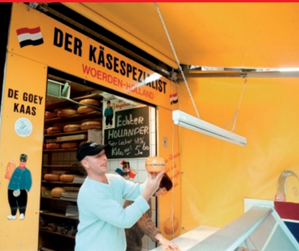
Kaas uit het vuistje. Ook in Duitsland.