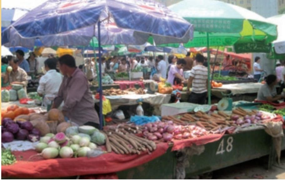
Verse producten spelen een belangrijke rol in het leven van de Chinese consument.

houden, maar er is grond nodig voor de teelt van voedergewassen. Die grond gaat verloren voor de productie van voedsel en dat zal resulteren in een toenemende import van gewassen.