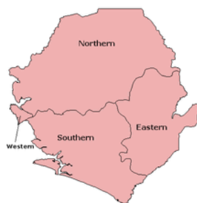
Provinciale indeling van Sierra Leone

Sierra Leone is verdeeld in een Western Area (het schiereiland Freetown en een aantal eilanden, waaronder de Banana-eilanden, Sherbro, de Turtle-eilanden en York), drie provincies (Noord, Oost en Zuid) en 14 districten. De Western Area is verdeeld in een Western Urban District en een Western Rural District . Provincie Noord is onderverdeeld in de districten Bombali, Kambia, Koinadugu, Port Loko en Tonkolili. Provincie Oost is onderverdeeld in de districten Kailahun, Kenema en Kono. Provincie Zuid is onderverdeeld in de districten Bo, Bonthe, Moyamba en Pujehun. 2