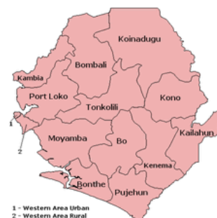
De 14 districten van Sierra Leone