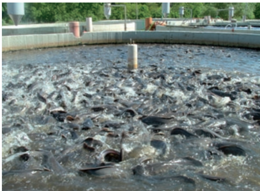
Tank vol met catfish.

belangrijkste activiteiten gericht op het het trainen van de Vietnamese autoriteiten op detectie van verschillende soorten antibiotica en andere mogelijke verontreinigingen in de vis. Zowel in Nederland als in Vietnam hebben trainingen plaatsgevonden. Inmiddels is het zo dat de getrainde Vietnamezen vervolgentrainingen geven in Vietnam (Train-de-trainer). Een nieuw cluster van activiteiten richt zich op verduurzaming van de teelt van pangasius. In de viswijzer van het Wereld Natuur Fonds en Stichting Noordzee is pangasius opgenomen in de oranje categorie. Het is de ambitie om pangasius in de groene, duurzame categorie te krijgen. Maar vanwege de onbekendheid met product en productiewijze is er een dreiging