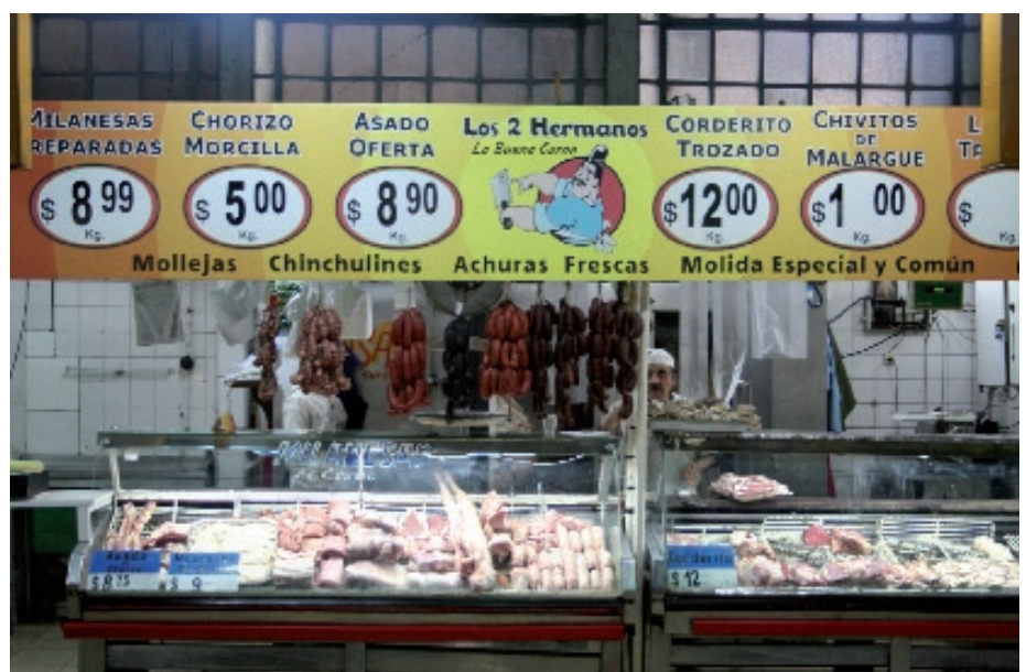
De overheid moedigt de burger aan tot het eten van varkensvlees. Zo blijft er rundvlees over om te exporteren.

Het bestaan van exportheffingen en de manier waarop ze gestructureerd zijn, heeft sterke invloed op de keuze voor bepaalde productie en op de exportmogelijkheden. Een interessant voorbeeld is de exportbelasting voor biodiesel die, -en in Argentinië is dat altijd op basis van sojaolie- slechts 16% bedraagt. Deze tax is fors lager dan de 32% die geldt voor de grondstof sojaolie. Zeker zolang er nog tal van investeringen in de pijplijn zitten en de producenten in 2010 zorgen dat ze voor de dan verplichte bijmenging 5% van de binnenlandse dieselbehoefte kunnen dekken, zal dat percentage voor biodiesel laag blijven. Tot die tijd hoeft Rotterdam