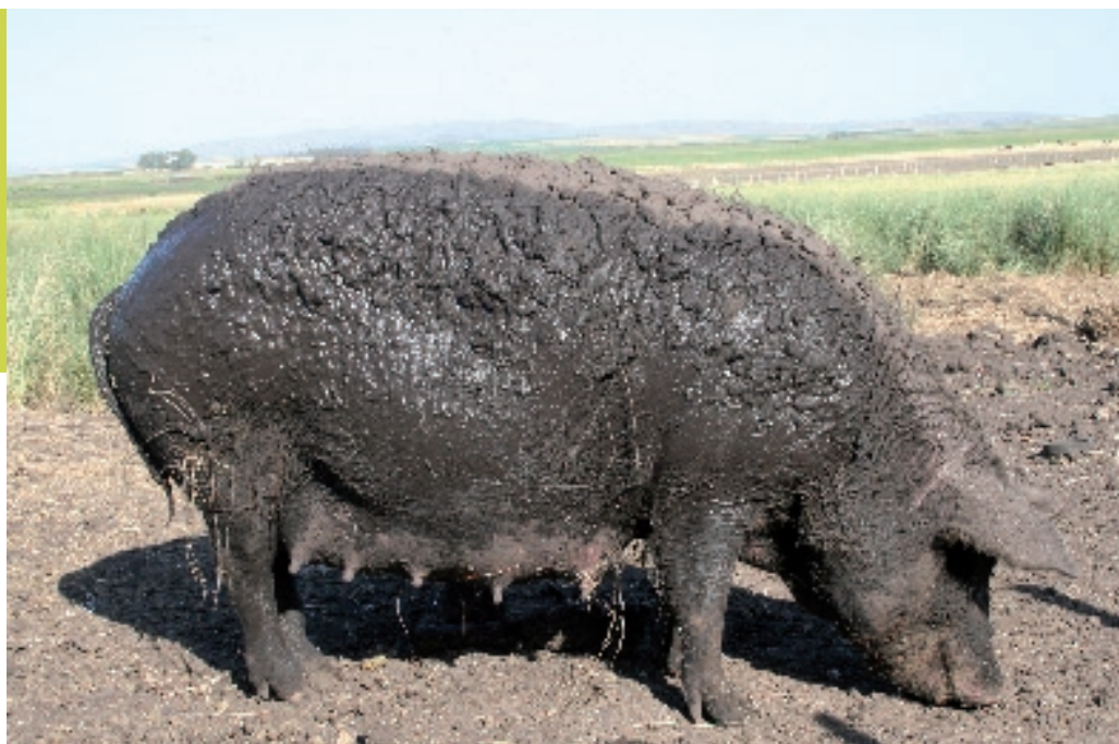
Een vrij (en blij) varken.

Waar Argentinië werkelijk mee kan concurreren is de productie van varkensvlees. Ook op dit product is de exportbelasting slechts 5%. Wie er een wereldkaart bijpakt waarop de mondiale varkensvleesproductie staat weergegeven, ziet Argentinië niet liggen. In 2007