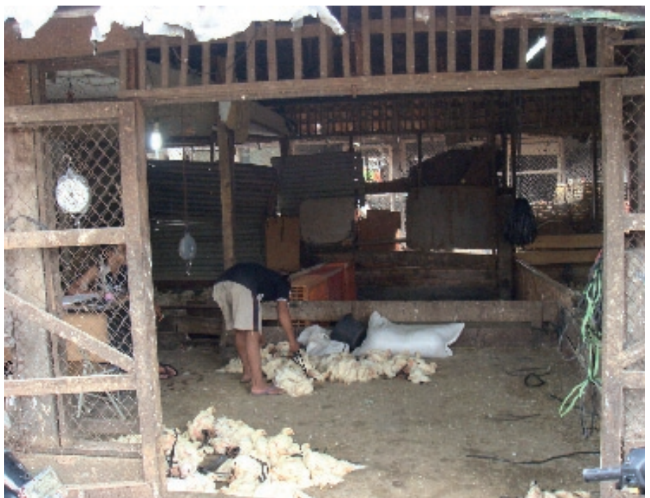
Een zogenoemd 'collector house'.