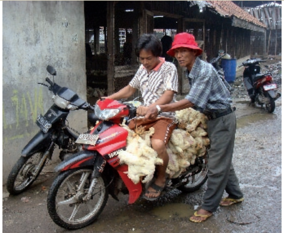
Transport van pluimvee.

In 31 van de 33 Indonesische provincies is deze dierziekte endemisch. Indonesië zit dus vol met het virus. Het HPAI-virus kan via besmetting van dier naar mens zoals bekend ook dodelijk zijn voor de mens. Dat blijkt wel uit de cijfers: in Indonesië vallen nu meer dan 115 dodelijke slachtoffers te betreuren. En steeds maar waarschuwen wetenschappers dat het virus kan muteren in een vorm die mens op mens besmetting makkelijk mogelijk maakt. Tot nu toe is die gevaarlijke mutatie gelukkig nog niet vastgesteld. Als dat wel gebeurt, en mensen elkaar besmetten, spreken we van een pandemie zoals we die de afgelopen eeuw een paar keer hebben gehad. Denk aan de bekende Hong Kong en Spaanse griep-epidemieën. Een pandemie kan, zo leert de geschiedenis, miljoenen slachtoffers maken. Het gemuteerde virus moet eerst bekend zijn wil er een vaccin