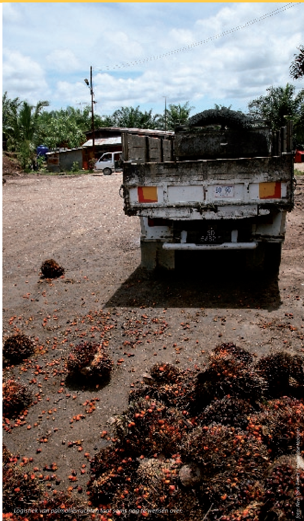
Logistiek van palmolievruchten laat soms nog te wensen over.