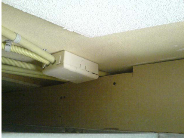
Foto 1: Wand is vanwege doorgetrokken leidingen niet meer 20 minuten brandwerend.