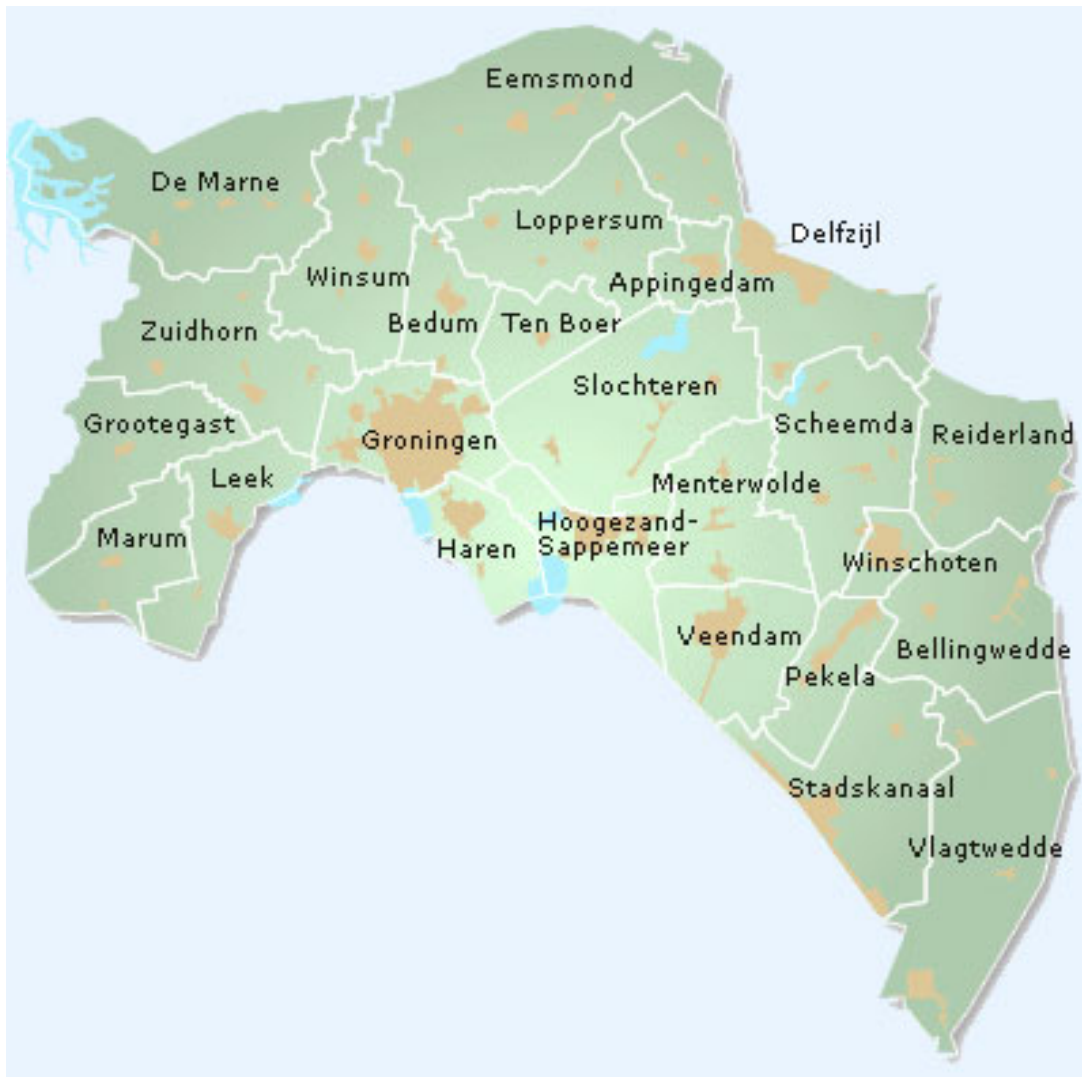
Gemeenten in de provincie Groningen