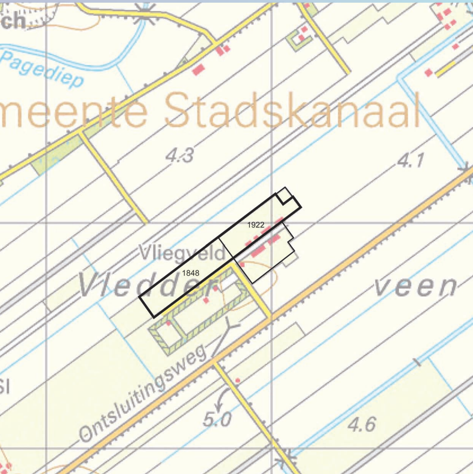
Kaart met kadastrale aanduidingen