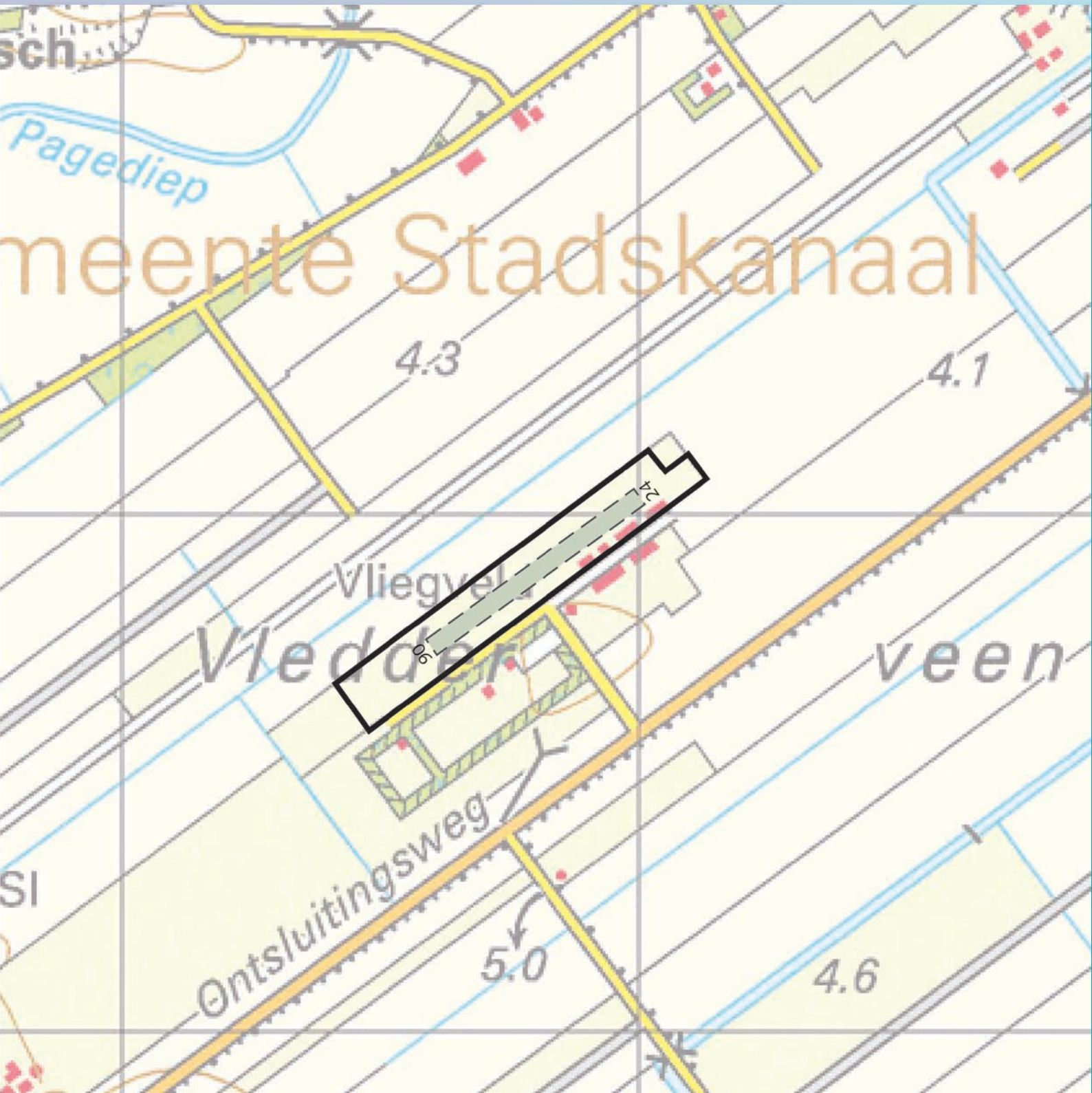
Kaart van het luchtvaartterrein