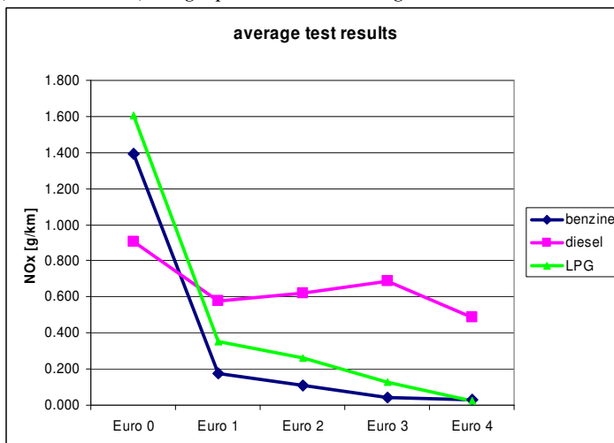
Figuur 1: de gemiddelde NO x -emissieniveaus van personenauto's op basis van alle meetdata samen (11.164 testen), uitgesplitst naar voertuigklassen.

In Figuur 1 zijn de gemiddelde NO x -emissieniveaus bij warme motor weergegeven van verschillende typen personenauto's, bepaald op basis van een groot aantal metingen. Uit de figuur blijkt dat het gemiddelde NO x -emissieniveau van Euro-4 dieselauto's met bijna 0,5 g/km substantieel hoger ligt dan de emissienorm van 0,25 g/km. Vergelijkbare studies in Europa laten een soortgelijk beeld zien: de