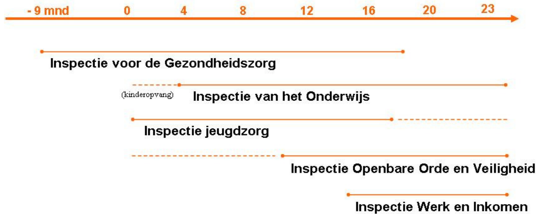
Figuur 1: Inspecties gerelateerd aan de levensloop van de jeugd

ITJ beoogt een bijdrage te leveren aan het versterken van de preventieve taak van algemene en specifieke voorzieningen voor de jeugd en daarmee aan het oplossen van maatschappelijke problemen van jongeren. Zij richt zich daarbij op de effectiviteit van de samenwerking van voorzieningen in de jeugdketen. Uiteindelijk zal deze effectiviteit zichtbaar moeten worden in reductie van het aantal jongeren dat als gevolg van een zwakke samenwerking tussen voorzieningen tussen wal en schip raakt of ontspoot. Dit zal bovendien tot maatschappelijke en economische inverdieneffecten (kunnen) leiden.