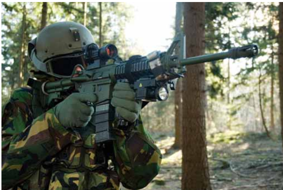
Militair met verbeterde uitrusting voor Diemaco C8.

In 2008 zijn binnen het Commando Landstrijdkrachten regionale personeelsdiensten opgericht. Ondanks enige opstartproblemen en personele onderbezetting stijgt het niveau van de dienstverlening. Tijdens mijn werkbezoeken heb ik geconstateerd dat de contacten met de regionale personeelsdiensten en de verantwoordelijke commandanten verbetert, maar dat er zeker nog enkele onvolkomenheden bestaan. Vaak is mijn aandacht gevraagd voor de onvolledige arbeidsplaatsenbank, het moeizaam contact kunnen krijgen met medewerkers van het Personeelscommando en de gebrekkige informatie over het functietoewijzingsproces. Eind 2008 heeft de commandant van het Personeelscommando aan het personeel een brief gestuurd, waarin hij op de gesignaleerde knelpunten is ingegaan en heeft uiteengezet hoe de bestaande procedures worden aangepast en geoptimaliseerd.