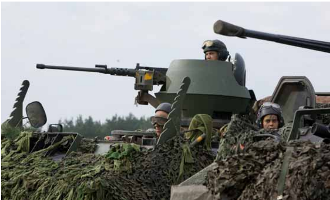
Oefening 'Rhino Lionhearted' 17 Pantser Infanteriebataljon, Duitsland.

Commandanten van eenheden die ik heb bezocht op bataljonsniveau en lager, vragen steeds vaker aandacht voor de onevenredige inspanningen en energie die zij moeten leveren om hun integrale verantwoordelijkheid ('de jure' dan wel 'de facto') bij de uitoefening van de vredesbedrijfsvoering te kunnen waarmaken. Deze toegenomen werkdruk is het gevolg van de spreiding van bevoegdheden. Het kost steeds meer moeite om dingen voor elkaar te krijgen, zoals tijdige en adequate personeelszorg. Dit heeft een negatieve uitwerking op het boeien en binden van personeel. Bovendien wordt de positie van de commandant verzwakt, als het personeel ervan overtuigd raakt dat zelfs de commandant niet in staat is om de basisvoorzieningen (tijdig) te regelen. Veel commandanten ervaren een grote discrepantie tussen het functioneren in een operationele omgeving enerzijds en het uitoefenen van de vredesbedrijfsvoering anderzijds.