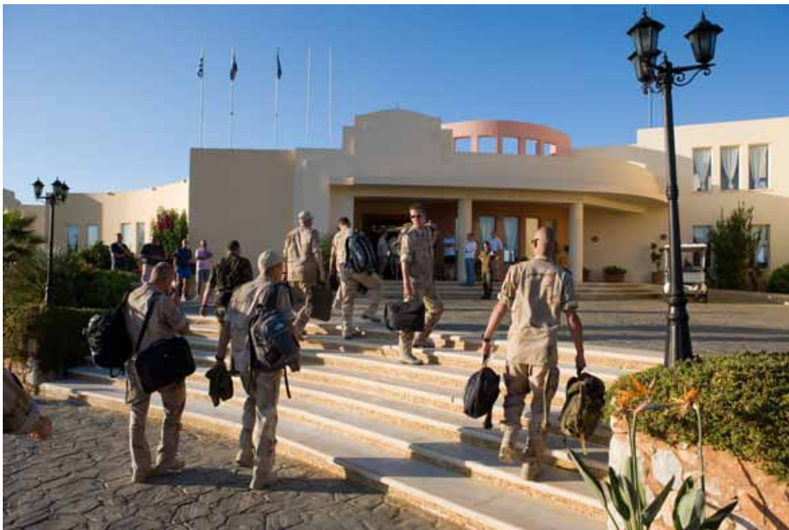
Aankomst van, uit Afghanistan terugkerende, militairen op Kreta voor het adaptatieprogramma.