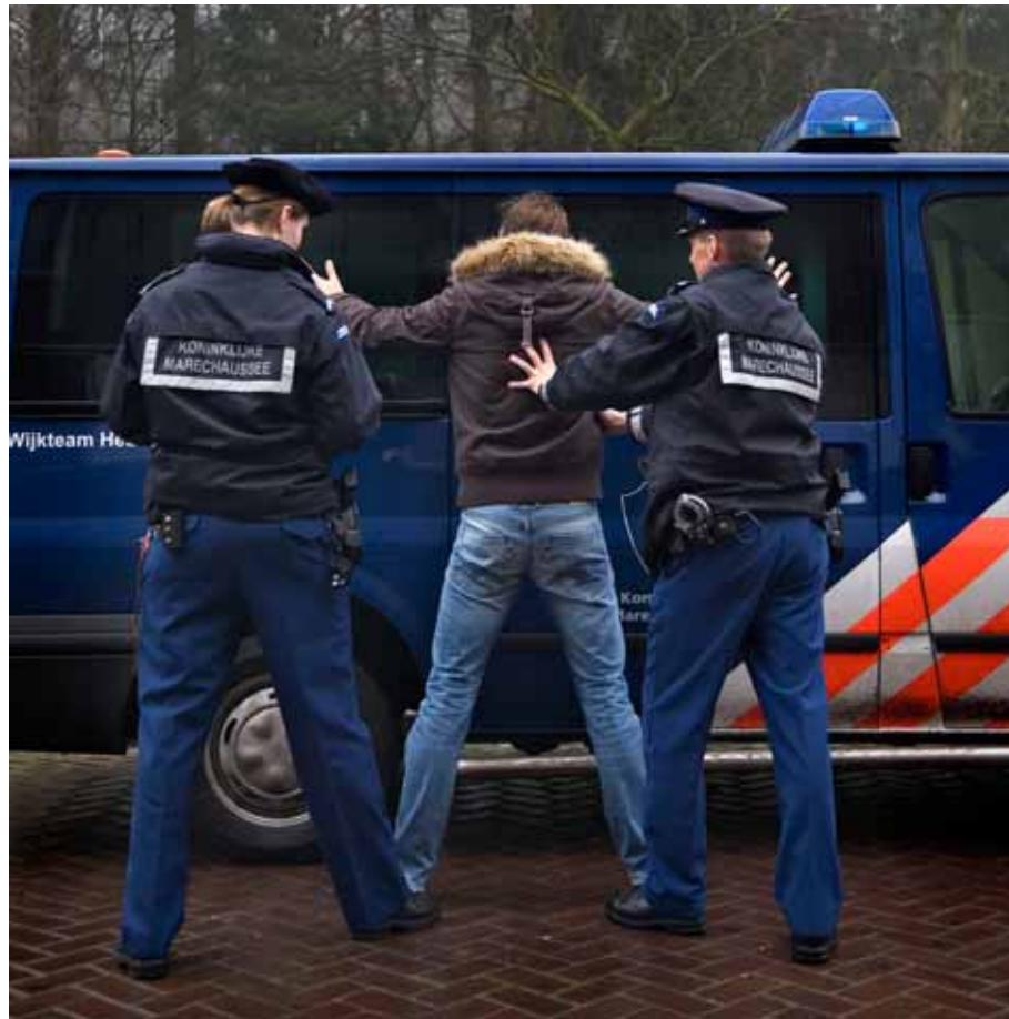
Koninklijke Marechaussee fouilleert een verdachte.