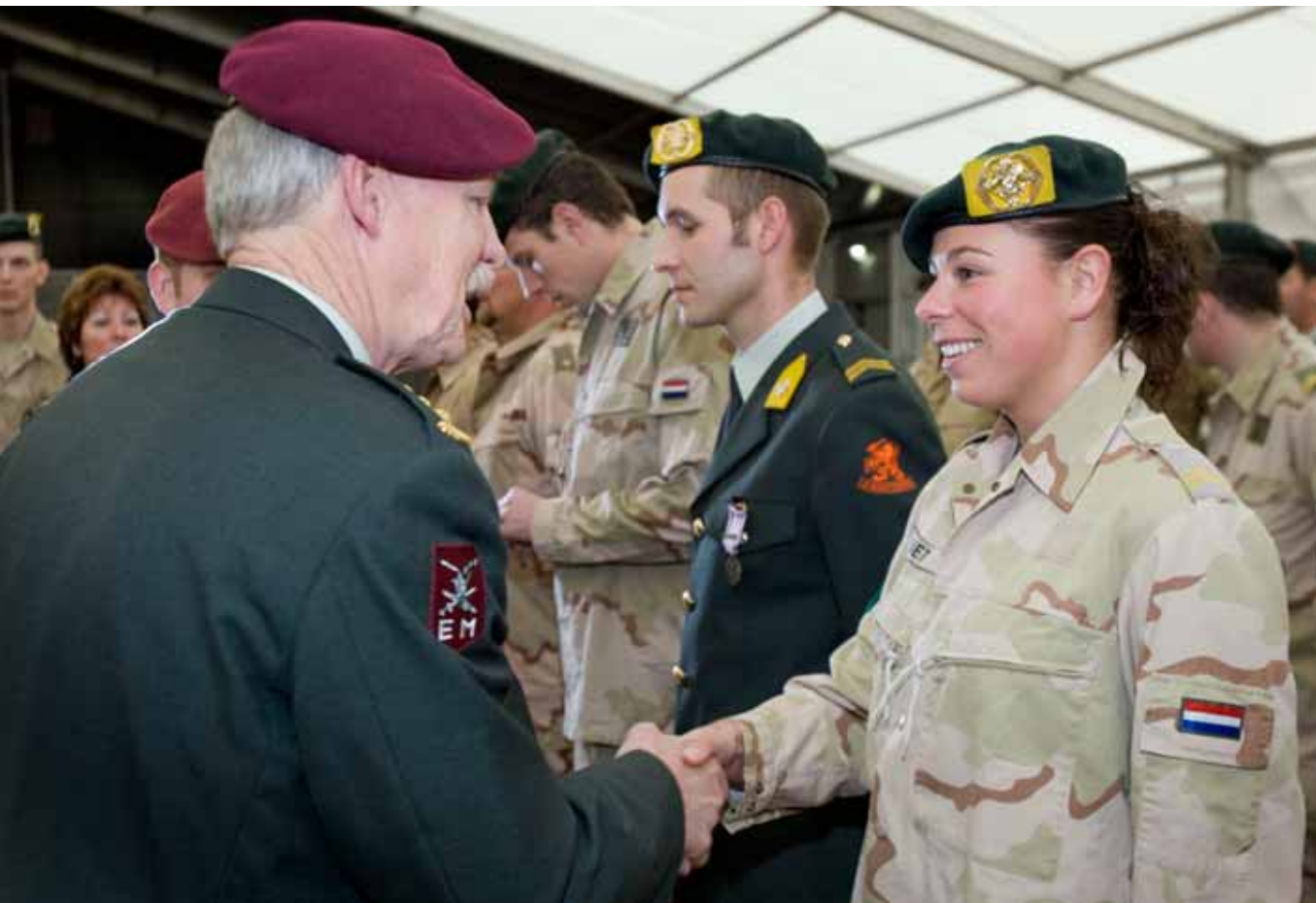
Medaille uitreiking Taskforce Uruzgan Rotatie Ondersteuningsteam 5 (ROOT-5).

Tot slot hebben vertegenwoordigers van mijn staf vastgesteld dat het adaptatieprogramma voor het Nederlandse personeel dat terugkeert uit missiegebieden, op een professionele wijze wordt uitgevoerd. Ik ben ervan overtuigd dat het programma een grote toegevoegde waarde heeft bij de overgang van uitzending naar thuiskomst.