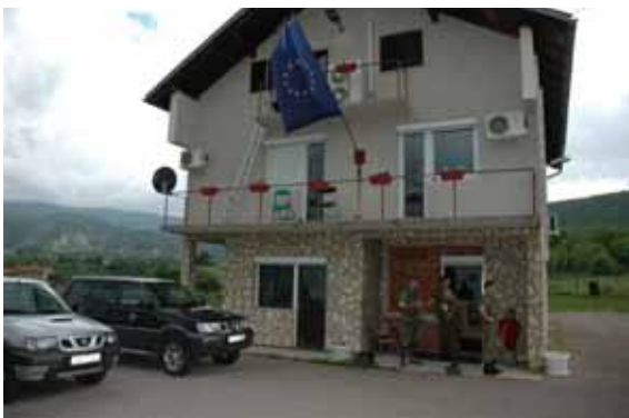
Liaison, Observer Team (LOT-) huis Drvar, Bosnië Eufor.