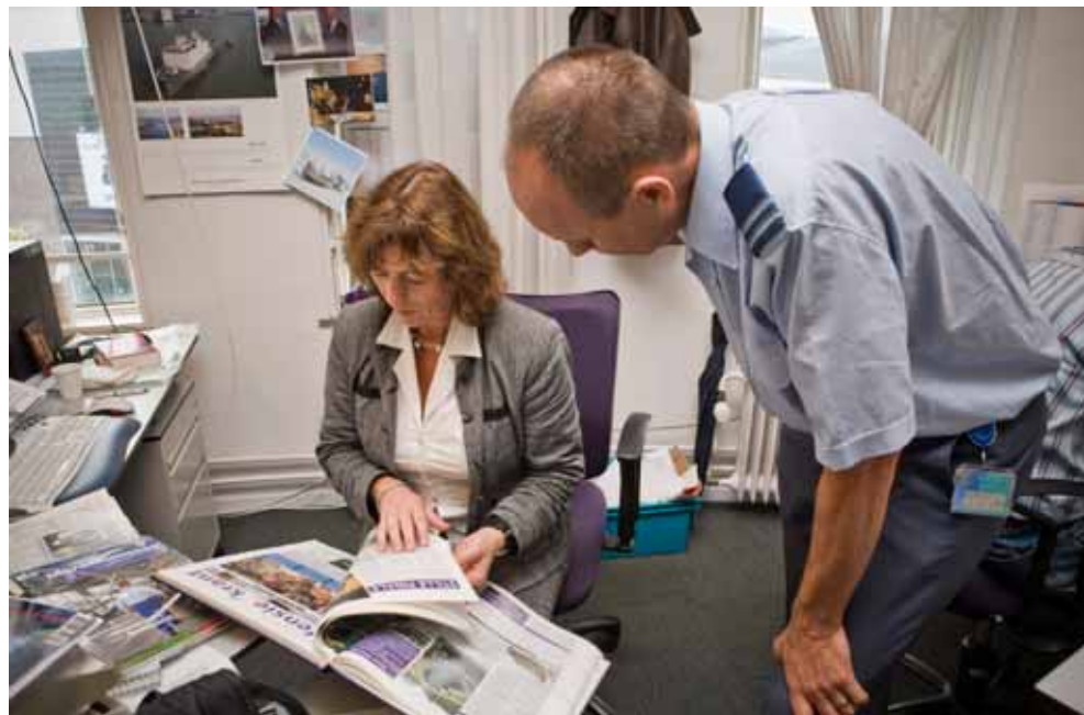
Journalisten Defensiekrant van de Directie Voorlichting aan het werk op de redactie.

In het kader van het actieplan Werving en Behoud is onderkend dat er behoefte is aan ondersteuning van het lijnmanagement. Wat de realisatie van de P&O-norm 1:100 betreft is de verdere reductie met een jaar opgeschort. In dat jaar wordt onderzocht of het wenselijk is om de norm 1:100 te handhaven. Bij deze heroverweging worden de rijksbrede P&O-discussie, de ondersteuningsbehoefte van commandanten en de ontlasting van de commandanten door toename van loopbaanbegeleiders in beschouwing genomen. Indien de norm wordt losgelaten, betekent dit wel dat de beoogde reductie elders binnen Defensie dient te worden gerealiseerd. Ik zal dit onderwerp blijven volgen.