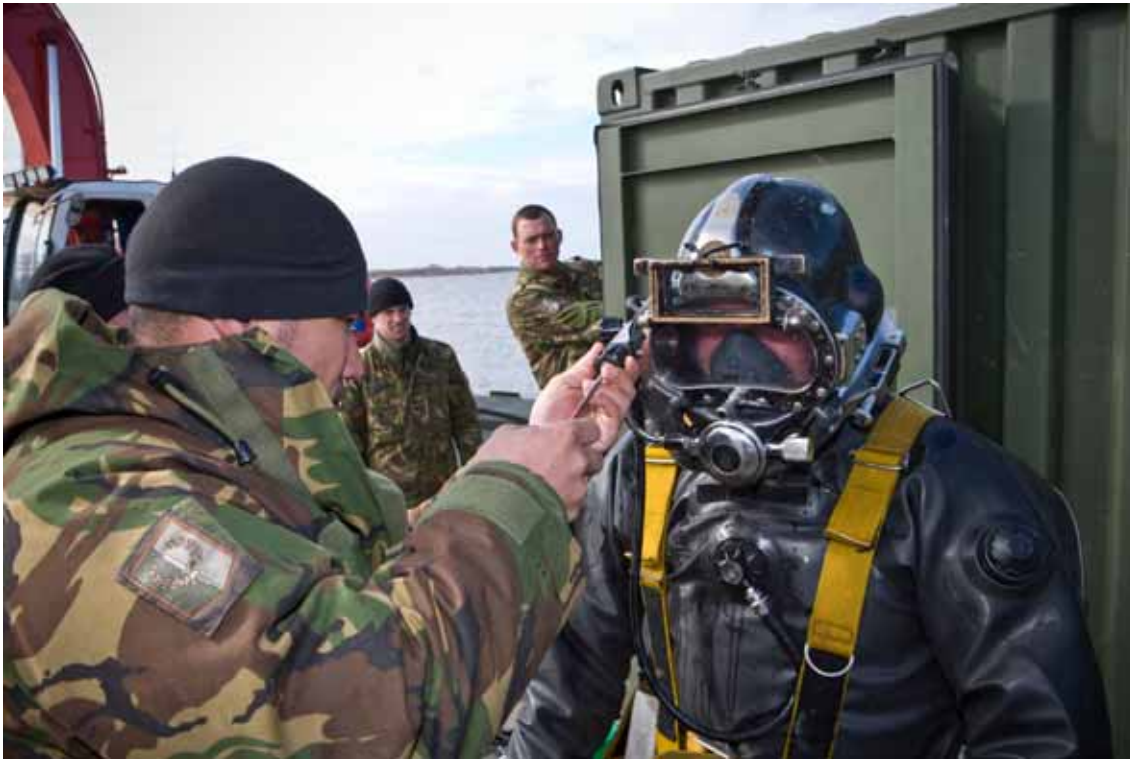
Genieduikers aan het werk in het Oostvoornsemeer.

3. vervolgoopleidingen). In toenemende mate komen deze laatste twee categorieën echter onder spanning te staan, wat vooral voelbaar is voor hen die een doorstart maken op een andere functie (doorstromers) en geconfronteerd worden met een wachtrij voor de vereiste functieopleiding. Met het oog hierop heb ik aanbevolen personeel zo veel mogelijk op organieke functie uit te zenden, zodat het omscholen van personeel dat op een niet-organieke functie wordt uitgezonden, wordt beperkt, waardoor meer ruimte ontstaat voor de niet-missiegerelateerde opleidingen en trainingen. Hieraan wordt zo veel mogelijk gevolg gegeven. Verder heb ik in algemene zin nadrukkelijk aandacht gevraagd voor het waarborgen van opleidingscapaciteit die benodigd is voor zowel nieuw geworven en nog te werven personeel (mede gelet op een reeds gesignaleerde toenemende belangstelling voor een functie bij Defensie) als het noodzakelijk behoud van defensiemedewerkers. De vaak lange wachttijden voor functieopleidingen blijken een negatieve uitwerking te hebben op behoud van personeel, waardoor Defensie onnodig mensen verliest.