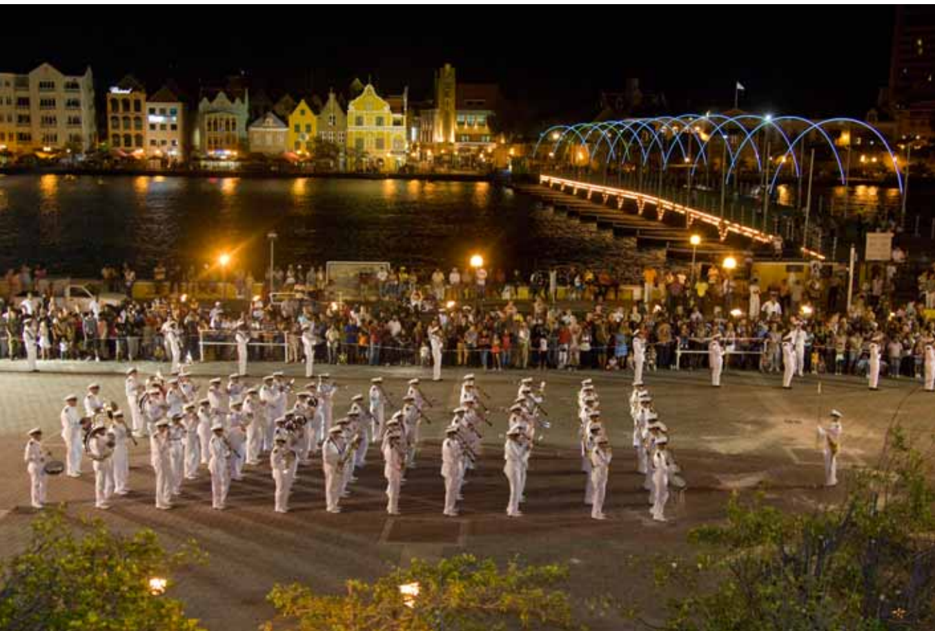
Optreden Marinierskapel tijdens Vlootdagen op Curaçao.

Bij alle bezoeken aan eenheden en gesprekken met personeel heb ik telkens weer een grote mate van loyaliteit en betrokkenheid van de mensen bij de eigen eenheid, maar ook het eigen krijgsmachtdeel, geconstateerd. Mede daardoor is het Commando Zeestrijdkrachten er opnieuw in geslaagd zijn operationele verplichtingen op goede wijze in te vullen. Bovendien heeft het Commando Zeestrijdkrachten de loyaliteit en betrokkenheid van het personeel meer en beter naar waarde weten te schatten.