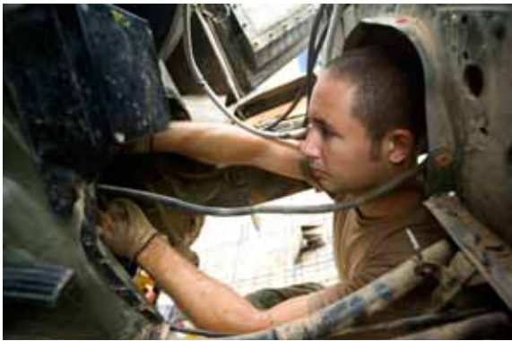
Monteur repareert koppeling LandRover, Goz Beida, Tsjaad.

Ik ben dan ook voorstander van een 'search'-toelage voor dit gevaarlijke werk.