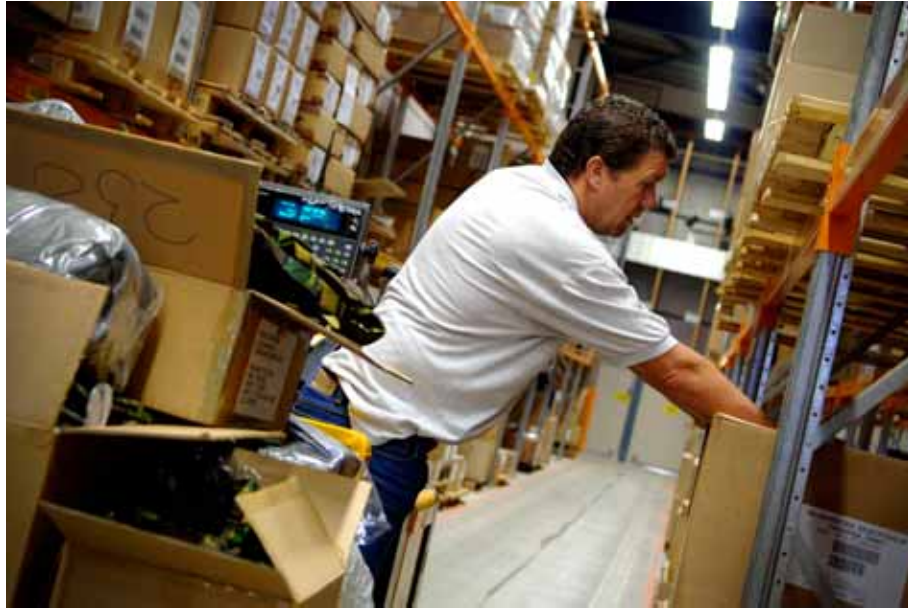
Medewerker Kleding en Persoonsgebonden Uitrusting (KPU) verwerkt bestelorders.

doorgevoerd. Dit wordt vooral veroorzaakt doordat de beide voormalige marine-eenheden nog sterk verbonden zijn met het Marinebedrijf te Den Helder, dat ook onder de Defensie Materieel Organisatie valt. Deze situatie heeft sterke invloed op de bedrijfsvoering en zorgt op sommige locaties voor spanning bij het personeel op de werkvloer. Inmiddels heeft de Defensie Materieel Organisatie besloten het Scheilab organisatorisch onder te brengen bij het Marinebedrijf.