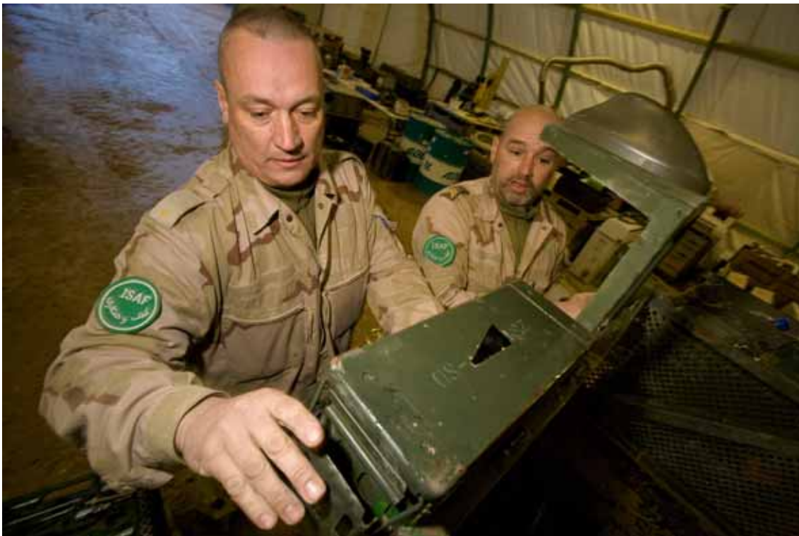
Technici aan het werk in onderhoudstent, Afghanistan.