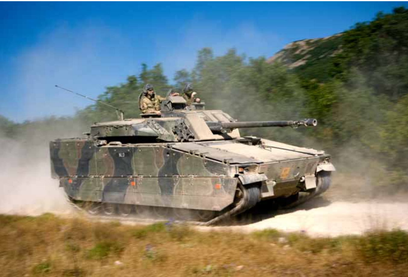
CV 90 tijdens 'Dust and Sand trials', Frankrijk.

Geneeskundig Bataljon steun geleverd aan het Medisch Spectrum Twente te Enschede, een relatieziekenhuis van Defensie. Vanwege een calamiteit binnen het ziekenhuis kon geen gebruik meer worden gemaakt van de aanwezige voorzieningen voor Intensive Care. Door het op zeer korte termijn inbrengen en gedurende enige maanden in stand houden van een mobiel geneeskundig operatiekamersysteem, is de bedrijfsvoering van het ziekenhuis niet in gevaar gekomen.