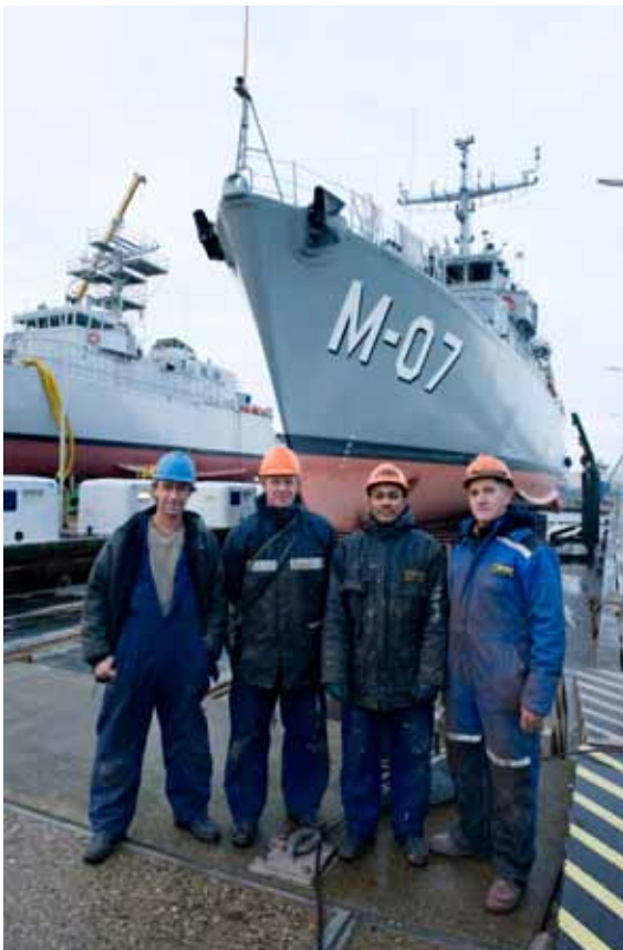
Medewerkers van de marinewerf, Den Helder.

In het verslagjaar heb ik de volgende eenheden van de Defensie Materieel Organisatie bezocht: