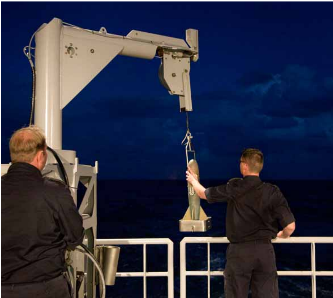
Sonde-meting aan boord van het hydrografisch schip Hr. Ms. Luymes.

Het is mij tijdens werkbezoeken opgevallen dat het flexibel personeelssysteem een steeds grotere bekendheid heeft gekregen. Ook maken steeds meer medewerkers gebruik van loopbaanbegeleiding door P&O-functionarissen: zowel het aantal gevoerde loopbaangesprekken is toegenomen, als het aantal gevallen dat medewerkers daarvan een gespreksnotitie ontvangen. Het personeel is nu veel meer dan binnen het voormalige personeelssysteem zelf verantwoordelijk voor de vormgeving van de eigen loopbaan en de eigen individuele ontwikkeling. Zij worden hierbij ondersteund door loopbaanbegeleiders. In 2008 zijn de eerste 48 van in totaal 200 loopbaanbegeleiders aangesteld bij de operationele commando's en met hun opleiding begonnen bij de Human Resource Management Academie (onderdeel van de Nederlandse Defensieacademie).