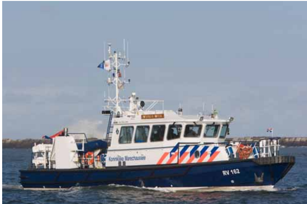
Koninklijke Marechaussee ijmuider.

districten tijdelijk te detacheren bij de Brigade Grensbewaking. Inmiddels heeft de Commandant Koninklijke Marechaussee in samenspraak met de medezeggenschapscommissie en de centrales van overheidspersoneel een pakket van maatregelen samengesteld, waaronder een vaste aanstelling (fase 3 binnen het flexibel personeelssysteem), functieroulatie, legeringsfaciliteiten, tegemoetkoming in de hogere voedingskosten en terugkeergarantie naar de brigade van herkomst bij verplichte plaatsing. Deze maatregelen moeten de vullingsproblematiek in 2009 structureel oplossen. De commandant hoopt dat met de maatregelen het werken bij de Brigade Grensbewaking aantrekkelijk genoeg is om vulling op basis van vrijwilligheid zeker te stellen. Indien dat niet het geval blijkt te zijn, zal personeel moeten worden aangewezen voor een functie bij deze brigade.