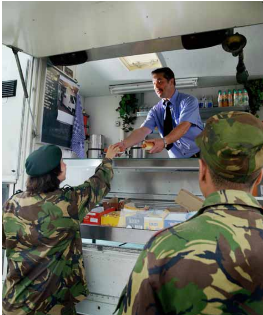
Ingebruikname nieuwe Cantinedienstwagen (CADI wagen).

In het kader van het Defensie Besluitvormingsmemorandum 2008 is aan Paresto (Paarse Restauratieve Organisatie) een besparing opgelegd van 25,3 miljoen euro. Een prijsverhoging van een deel van het voedingsmiddelenassortiment kon hierdoor niet uitblijven. Het basispakket bij Paresto (ongeveer vierhonderd artikelen) is echter ontzien. Luxe en minder gezonde voedingsmiddelen zijn met ingang van 14 april 2008 fors duurder geworden.