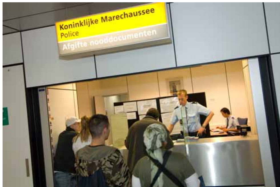
Medewerkers district Koninklijke Marechaussee Schiphol geven nooddocumenten uit.

De Koninklijke Marechaussee heeft in 2008 te maken gehad met relatief veel vacatures in de districten West en Schiphol. Hoewel de Koninklijke Marechaussee geen problemen heeft met de werving van nieuw personeel, is de zuigkracht vanuit de diverse regionale politiekorpsen duidelijk voelbaar. Daarbij komt dat de Randstad in verband met de hoge woonlasten en files weinig aantrekkelijk is, waardoor er minder bereidheid is om vanuit andere delen van Nederland te solliciteren naar een functie binnen de districten West en Schiphol.