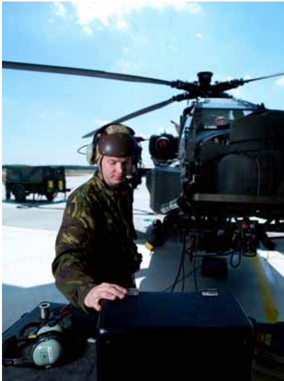
Onderhoudswerkzaamheden aan Apache helikopter, Vliegbasis Gilze Rijen.

door dit commando aangestuurd, waardoor efficiënter kan worden gewerkt en procedures beter op elkaar kunnen worden afgestemd. Na de zomer zijn alle op de Vliegbasis Soesterberg gestationeerde Chinook-, Cougar- en Alouette-helikopters in drie slagen naar de vliegbasis Gilze-Rijen overgevlogen. Na de komst van de NH-90-helikopters zal een verdere concentratie van helikopters op Gilze-Rijen plaatsvinden. Twaalf van de twintig NH-90-helikopters zullen echter opereren vanaf het Maritiem Vliegveld De Kooy. Tot de komst van de NH-90-helikopters blijven de Lynx- en de AB-412-helikopters vanaf hun huidige locatie (Maritiem Vliegveld De Kooy respectievelijk Vliegbasis Leeuwarden) opereren.