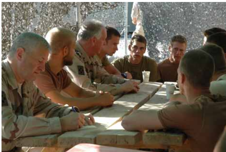
De IGK in gesprek met Nederlandse militairen in Deh Rawod, Afghanistan.

Na terugkeer uit Afghanistan heb ik vernomen dat de aanvraagprocedure (de zogenoemde faxprocedure) voor levering van niet-voorraadartikelen begin 2009 deels wordt geautomatiseerd. Verder heeft de Commandant der Strijdkrachten een team samengesteld dat een onderzoek heeft uitgevoerd naar de door mij geschetste problematiek bij de uitgezonden eenheden in Afghanistan. Dit heeft geleid tot een aantal verbetervoorstellen, waarover begin 2009 besluitvorming zal plaatsvinden. Het betreft bijvoorbeeld een tijdelijke uitbreiding van personeel