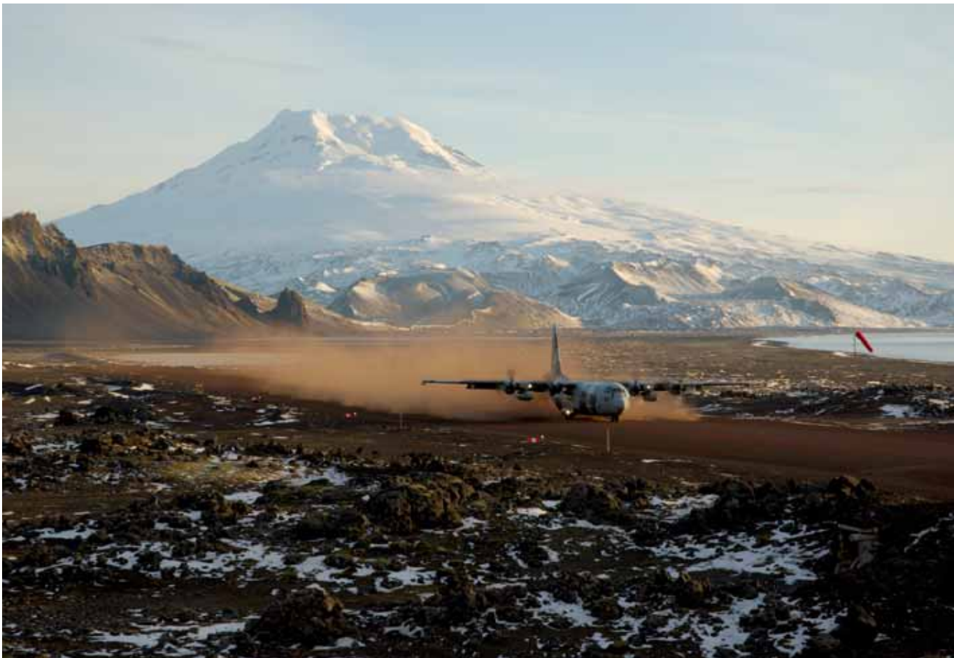
336 Squadron op eiland Jan Mayen, Noorwegen.

Met de oprichting van het Defensie Helikopter Commando op de Vliegbasis Gilze-Rijen op 4 juli 2008 is een belangrijke stap gezet op een weg die moet leiden tot verhoging van de beschikbaarheid en inzetbaarheid van de totale helikopter-capaciteit van de krijgsmacht. Alle luchtmacht- en marinehelikopters worden