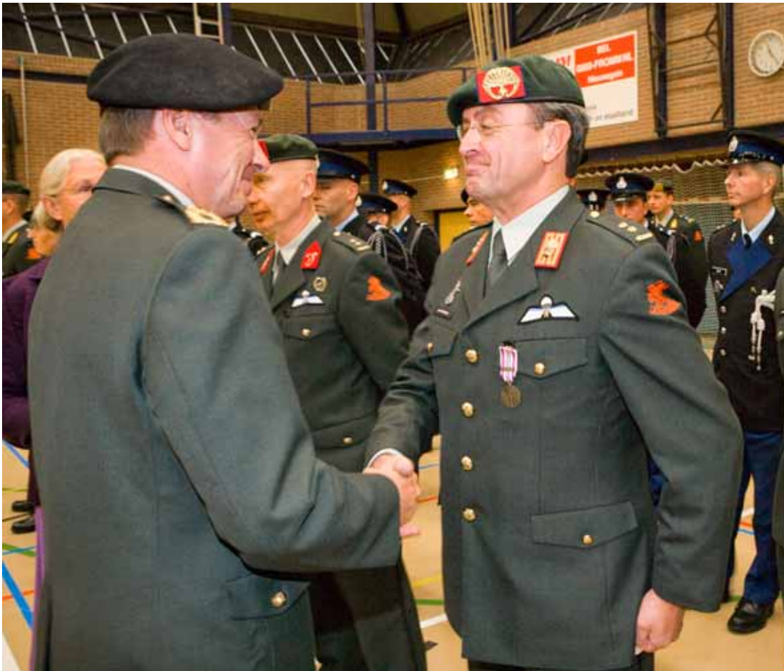
Medaille-uitreiking aan individueel uitgezonden militair voor de missie in Burundi.

zerne in Amersfoort. Op het moment van de formele samenvoeging was het uit negen arbeidsplaatsen bestaande bureau nog niet volledig gevuld. Ook hebben zich binnen korte tijd veel personeelsmutaties voorgedaan. Sinds 1 mei 2008 zijn alle functies bezet. De hoofdtaak van het Bureau Individuele Uitzendingen is de coördinatie van alle activiteiten in relatie tot het formeren en gereedstellen van individuele militairen. Daarnaast is het bureau betrokken bij de organisatie van vooropkomstdagen en thuisfrontactiviteiten (per missie), de coördinatie van de verschillende opleidingen (met uitzondering van de Missie Gerichte Opleiding/Missie Gerichte Instructie), het verstrekken van de pakketten Persoonlijke Gevechtsuitrusting, het verplicht impregneren van de kleding, de reis naar en vanuit het missiegebied, aanwezigheid bij vertrek naar en terugkeer uit het missiegebied, het faciliteren van de verstrekking van reisdocumenten (visa, diplomatiek paspoort) en de organisatie van de medaille-uitreikingen. Uit gesprekken met het bureauhoofd en het personeel van het Bureau Individuele Uitzendingen is gebleken dat het huidige aantal arbeidsplaatsen van het bureau niet toereikend is om, naast de coördinerende taken, alle genoemde overige werkzaamheden die aan de status van formerende eenheid verbonden zijn, uit te kunnen voeren.