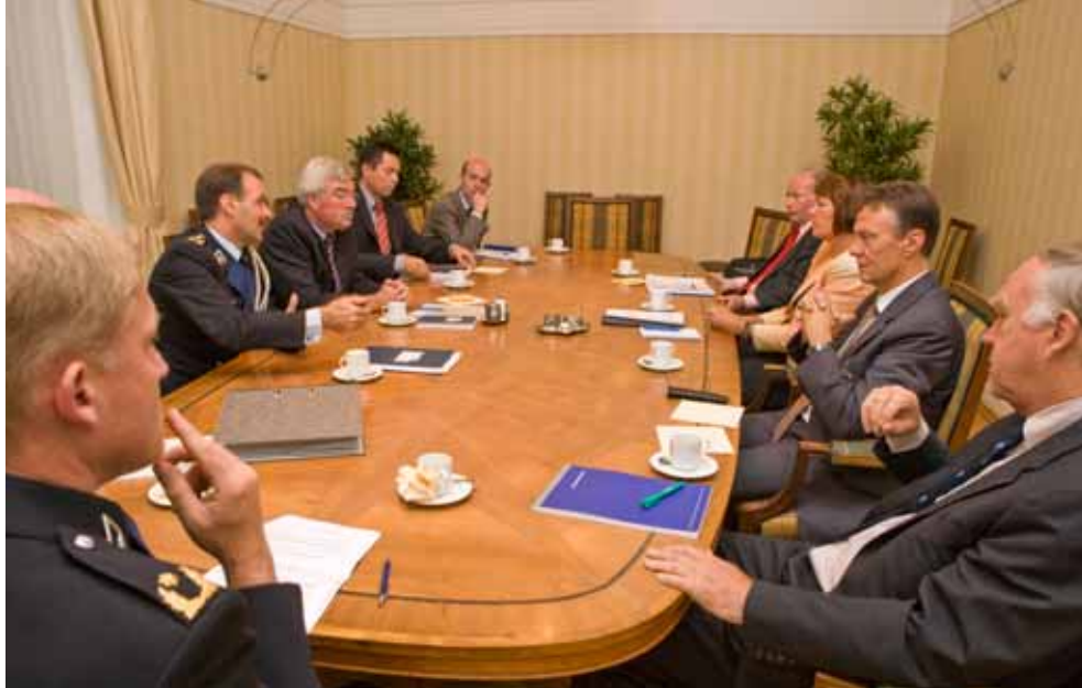
Startbijeenkomst Commissie evaluatie beleidsplan Koninklijke Marechaussee.