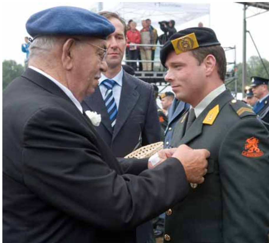
Veteraan reikt herinneringsmedaille uit tijdens de Nederlandse Veteranendag.

Derhalve heeft het Comité Nederlandse Veteranendag besloten dat de Nederlandse Veteranendag voortaan op de laatste zaterdag van de maand juni plaatsvindt.