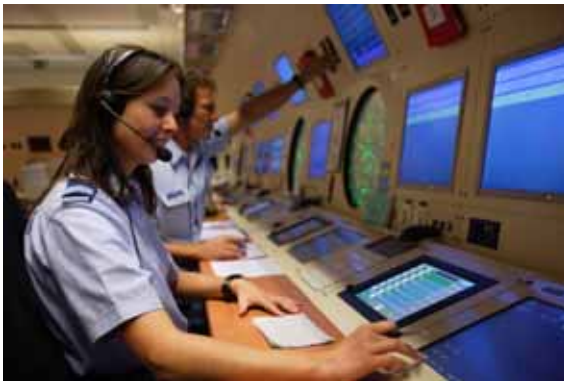
Medewerker Air Operations Control Station Nieuw Milligen.

Tijdens mijn werkbezoek aan het Air Operations Control Station Nieuw Milligen heeft het management mij geïnformeerd over de komende reorganisatie. Het huidige militaire verkeersleidings- en het gevechtsleidingsquadron zullen hun