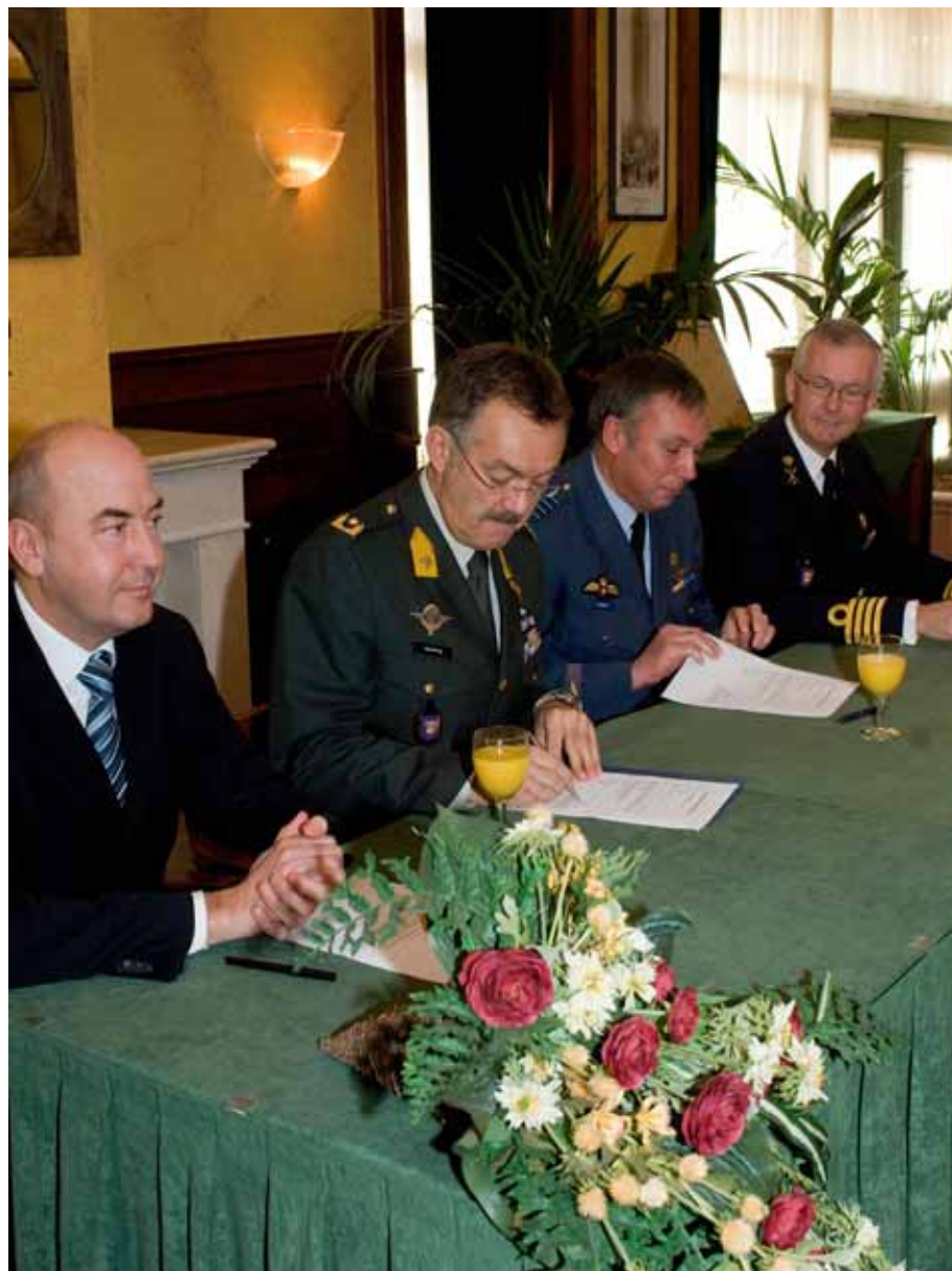
Overdracht van de facilitaire ondersteuning en bewaking/beveiliging Soesterberg van Commando Luchtstrijdkrachten aan Commando Dienstencentra.

kingen opgelegd bij een aantal bedrijfsgroepen. De maatregelen zijn inputgericht en hebben tot doel de kwaliteit van de dienstverlening te verbeteren en de klantrelatie te versterken. Zo zijn om de interne efficiency te vergroten de bedrijfsgroepen Informatie- en CommunicatieTechnologie en Informatievoorziening samengevoegd tot de Bedrijfsgroep Informatievoorziening en -Technologie (IVENT; voorheen de Defensie Telematica Organisatie (DTO)). Met deze samenvoeging is tevens meer duidelijkheid gecreëerd binnen de informatievoorzieningsketen van Defensie. Inmiddels zijn processen vereenvoudigd en is synergie bereikt door kennis van de organisaties te bundelen. Ook is door uitvoering van de businesscase Multifunctionals het aantal afzonderlijke randapparaten, zoals printers, faxen en scanners, aanzienlijk teruggebracht en zijn de huidige kopieerapparaten vervangen.