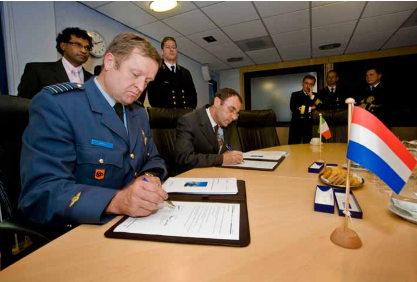
Contractondertekening voor wapensystemen op nieuwe patrouilleschepen.

Inzetbaarheid dan wel beschikbaarheid van alle hoofdtrappingsstukken (platform, voertuig, en dergelijke) voor gebruik moet op eenheidsniveau (schip, bataljon, zelfstandige compagnie, squadron) binnen de norm liggen. De systeem- en assortimentsmanagers zouden idealiter zo veel budgettaire ruimte moeten krijgen dat prioriteiten slechts in uitzonderlijke gevallen moeten worden aangepast.