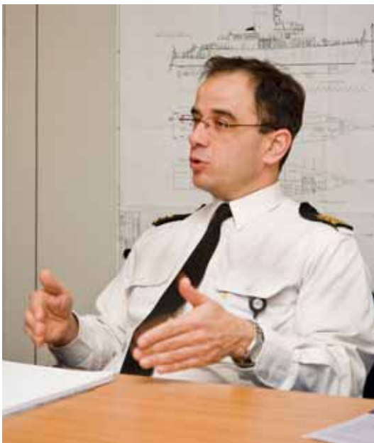
Projectleider (PAM) 'Project Aanpassing Mijnenbestrijdingscapaciteit'.