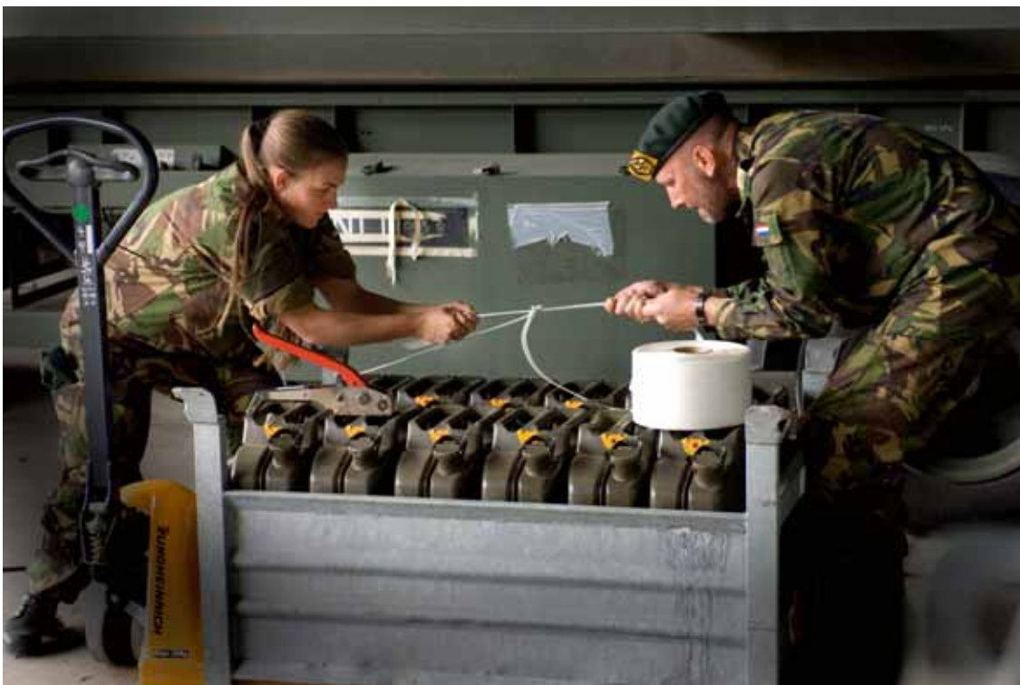
Zekeren van de Jerrycans tijdens een schietoefening in Duitsland.

Bij de scholen voor initiële opleiding is mijn aandacht gevraagd voor het aspect vorming. Zeker bij de huidige generatie jonge militairen wordt een toegenomen vormingsnoodzaak onderkend. De instructeur vervult binnen de vorming een cruciale rol. Hij of zij is vaak het eerste ijkpunt voor de aankomende militair en het is van belang dat deze instructeur, ondanks zijn of haar drukke werkzaamheden, de gelegenheid krijgt zich te scholen in deze materie en de ontwikkelingen op dit gebied. Ik ondersteun dan ook het initiatief om een psycho-sociaal werker bij deze eenheden aan te stellen.