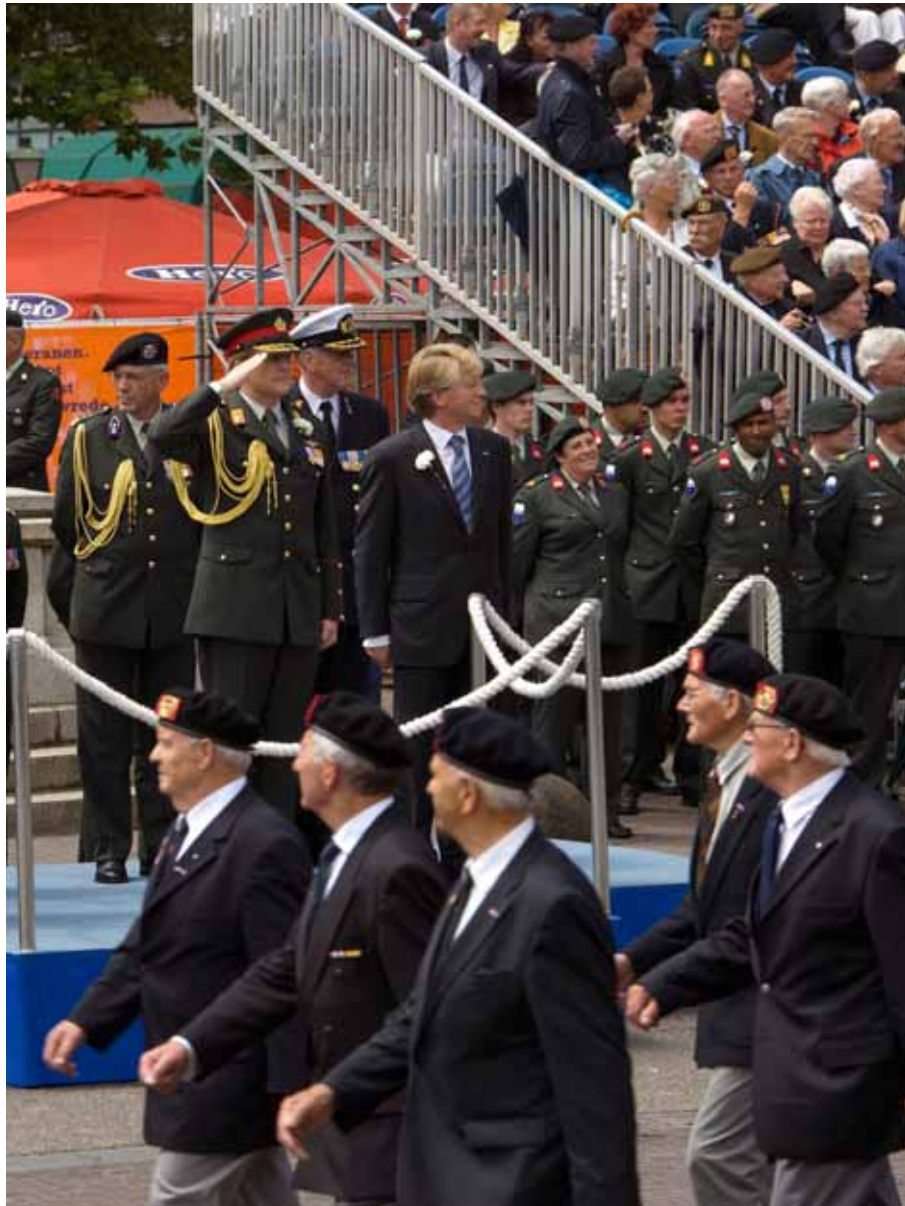
Z.K.H. Prins Willem Alexander neemt Defilé af op Nederlandse Veteranendag 2008.