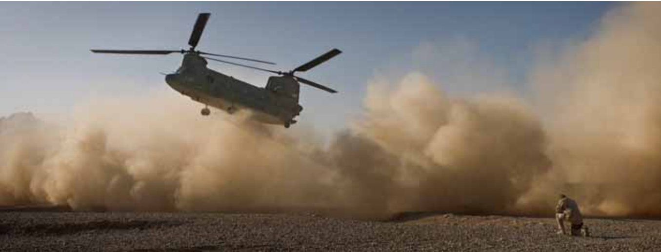
Een Chinook landt op Deh Rawod.

door de Commandant der Strijdkrachten. De voortvarendheid van deze Task Force heeft inmiddels geleid tot het nemen van zeer effectieve besluiten, zoals de inzet van snuffelhonden die getraind zijn in het opsporen van explosieven, de invoering van Recce Lite (fotoapparatuur onder de F-16 die afwijkingen in het terrein waarneemt), het aanbrengen van een Improvised Explosive Devices Interrogation Arm aan de Bushmaster (onder pantser bestuurbare mechanische arm) en het op korte termijn invoeren van een Pressure Plate Killer (onbemand voertuig dat door zijn gewicht zorgt dat het geïmproviseerde explosief tot ontploffing wordt gebracht).