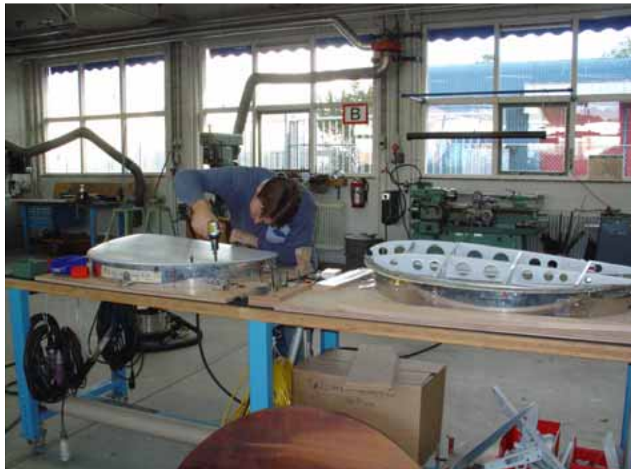
Plaatwerkzaamheden in werkplaats Militair Luchtvaart Museum.

Het afgelopen jaar heeft het Commando Luchtstrijdkrachten operationeel een prima prestatie geleverd. De continue inzet van Apache-gevechtshelikopters, F-16-jachtvliegtuigen en Chinook- en Cougar-transporthelikopters is essentieel geweest voor de missie van de Nederlandse grondeenheden in Afghanistan.