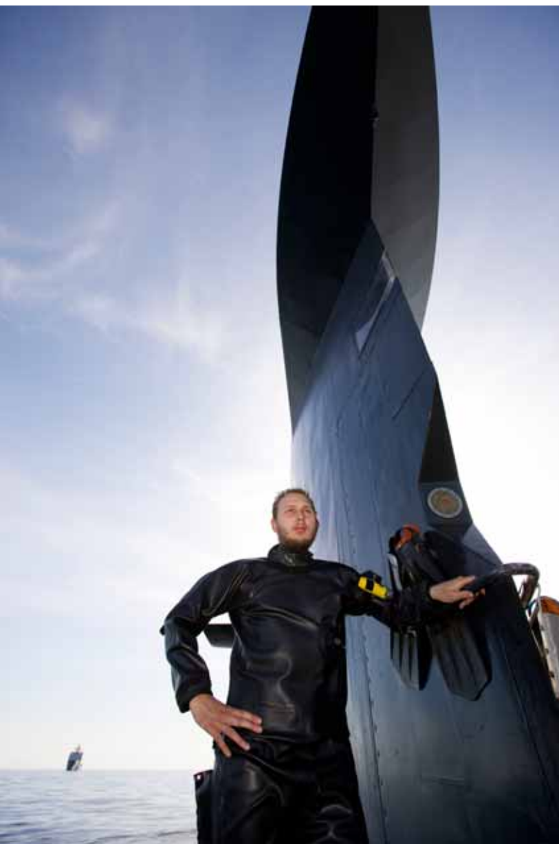
Deelnemer Submarine escape oefening 'Bold Monarch' in Noorwegen.