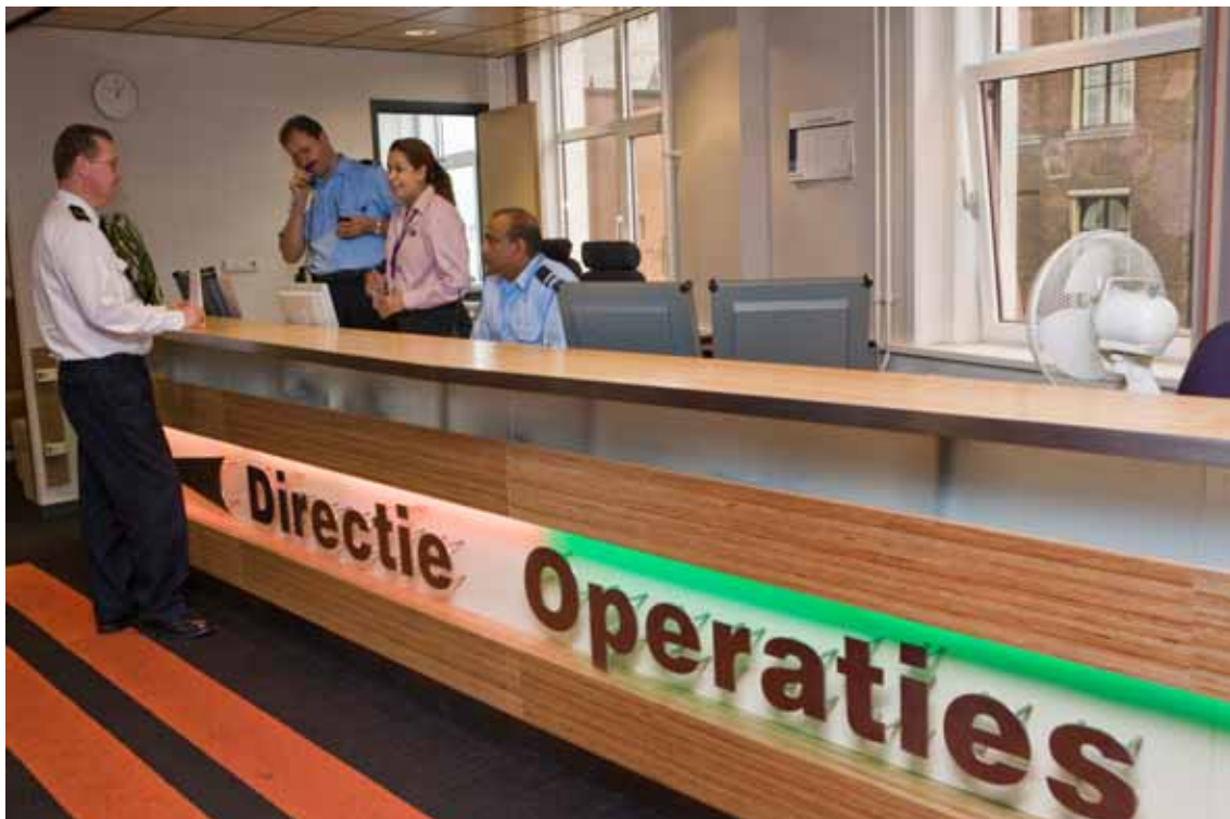
Baliemedewerkers van de Directie Operaties.

In 2008 hebben de ongeveer tweeduizend burgermedewerkers en militairen van de Bestuursstaf opnieuw veel en goed werk verzet. De infrastructurele omstandigheden waarin een groot deel van de medewerkers de werkzaamheden heeft moeten verrichten, is vanwege de renovatie van het Plein-Kalvermarktcomplex, niet optimaal geweest. Zo is een aantal directies vanwege de renovatie gehuisvest op verschillende locaties in Den Haag, wat de communicatie niet altijd ten goede is gekomen. Verder is de tijdelijke huisvesting kwalitatief onvoldoende. Naar verwachting zal deze situatie helaas voortduren tot in 2012.