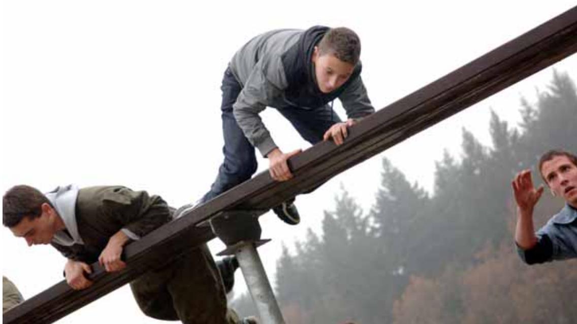
Jeugd maakt kennis met Korps Mariniers tijdens informatiedagen.

De eerder geconstateerde zorgwekkende situatie wat de personele vulling van de onderzeeboten betreft, is in 2008 verder verslechterd. Sprake is van structurele onderbezetting van de boten en het herhaaldelijk op korte termijn wisselen van personeel, waardoor de plaatsingsonrust toeneemt en sprake is van irreguliere