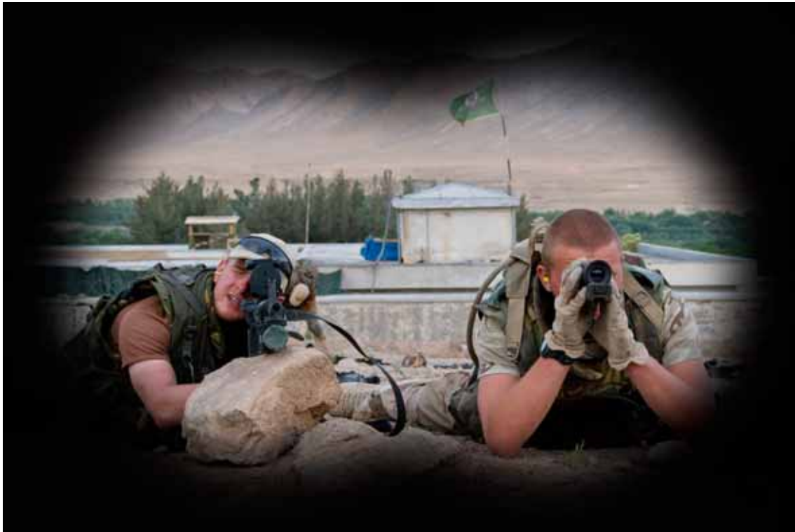
Militairen schieten hun HV-kijker (nachtzichtapparatuur) in, Chora Afghanistan.