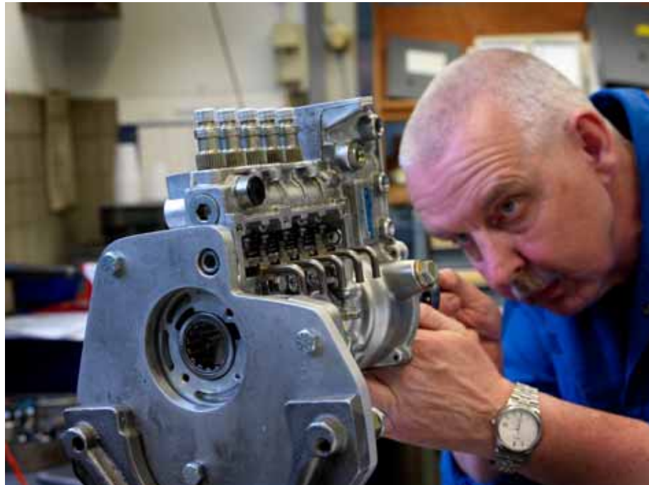
Intern onderzoek van een chinook motor door personeel van het Logistiek Centrum Woensdrecht.

De voorgenomen verhuizing van het Command & Control Support Centre naar de Bernhardkazerne te Amersfoort, als onderdeel van de concentratie van meerdere eenheden op deze kazerne, zorgt voor veel onduidelijkheid en onzekerheid bij het personeel. Het betreft in het bijzonder veelvuldige vertraging en herhaald uitstel (waardoor het tijdschema meermalen is aangepast), de capaciteit van de (nog te bouwen) nieuwbouw en het voorziene tekort aan facilitaire voorzieningen. Ook de nieuwbouw op de Vliegbasis Woensdrecht voor het Logistiek Centrum