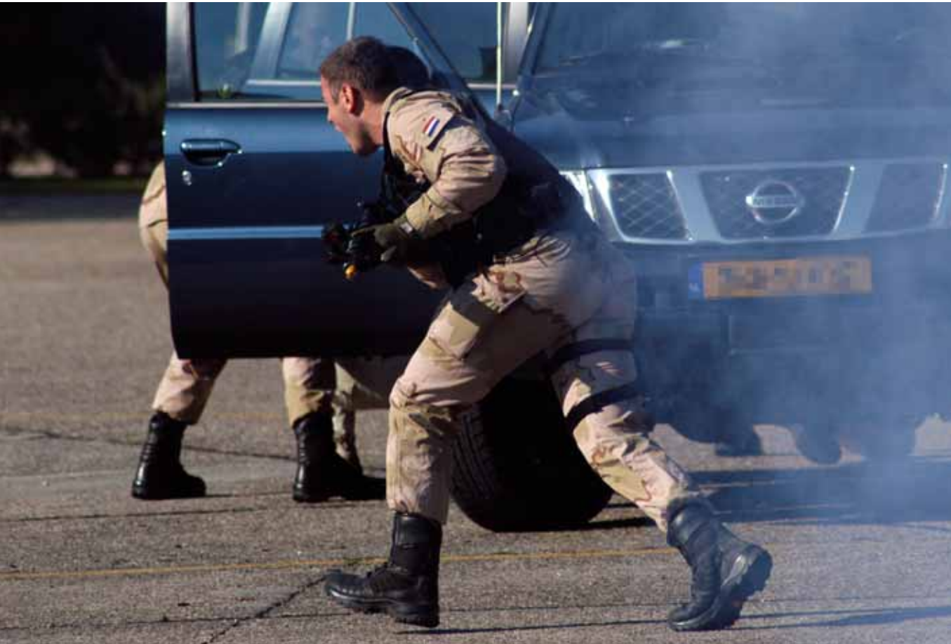
Brigade Speciale Beveiligingsopdrachten (BSB) tijdens oefening.