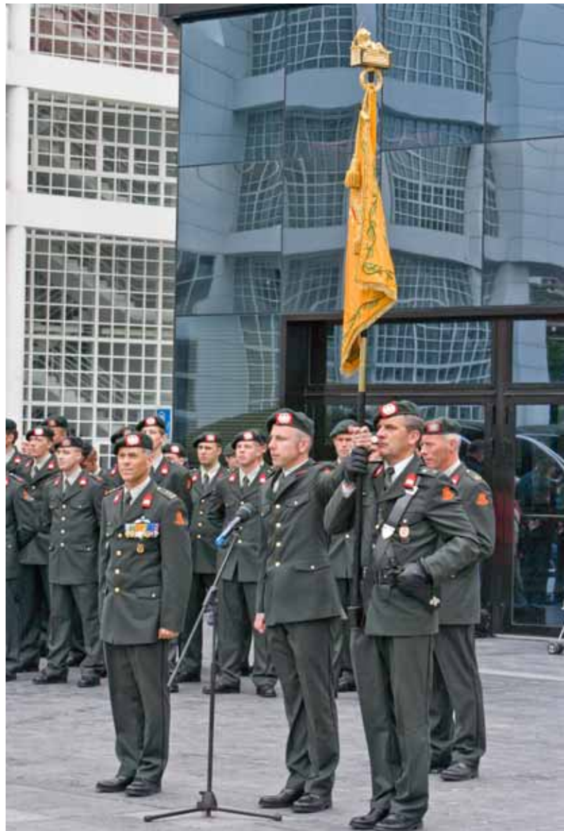
Beëdiging militairen van 20 Nationale Reservebataljon

Ik ondersteun het voorstellen om reservepersoneel ook in te zetten voor het tijdelijk waarnemen van functies binnen staven, die vanwege uitzendingen tijdelijk vacant zijn, de zogenoemde 'backfill'-optie. Op deze wijze kan de reguliere bedrijfsvoering doorgaan en ontstaat er geen extra werkbelasting bij hen die door de uitzending van een collega extra taken toebedeeld krijgen.