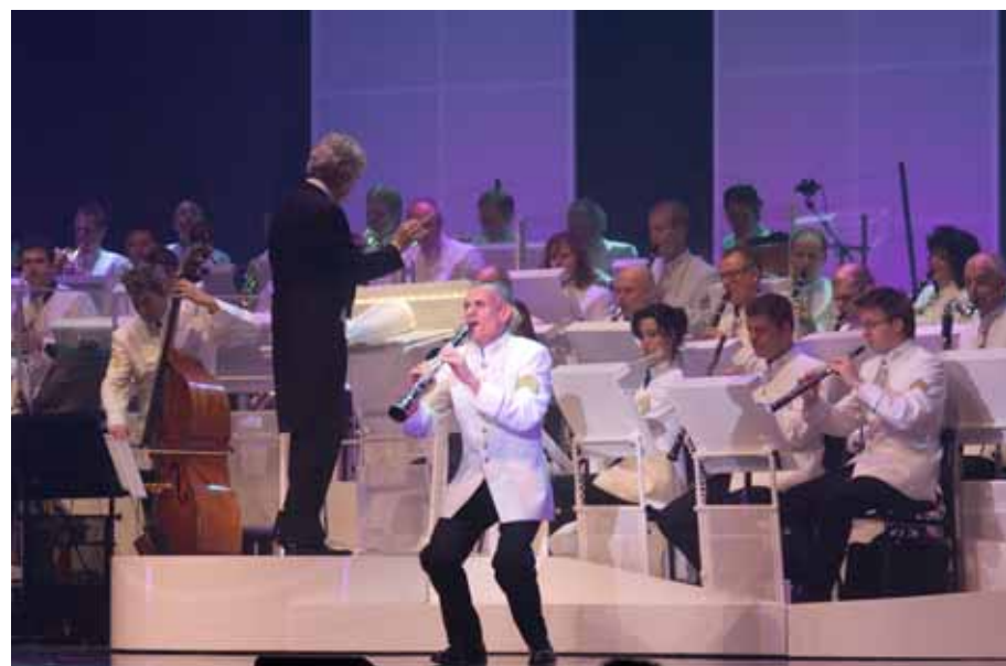
Premiere Hollywood van het Orkest Koninklijke Luchtmacht.

Tijdens diverse werkbezoeken is mij duidelijk geworden dat de operationele taakuitvoering vanwege personeelstekorten steeds meer onder druk komt te staan. Ondanks enkele financiële maatregelen is de irreguliere uitstroom onverminderd hoog. Als voornaamste oorzaak noemt het personeel vooral de hoge uitzenddruk bij het thuisfront. Behoud van personeel is essentieel om het benodigde voortzettingsvermogen te kunnen handhaven. Uitbreiding en intensivering van de opleidingscapaciteit, in combinatie met verruimde inzet van reservepersoneel biedt mogelijkheden om de hoge uitzenddruk te verminderen en de uitstroom van ervaren personeel te beperken.