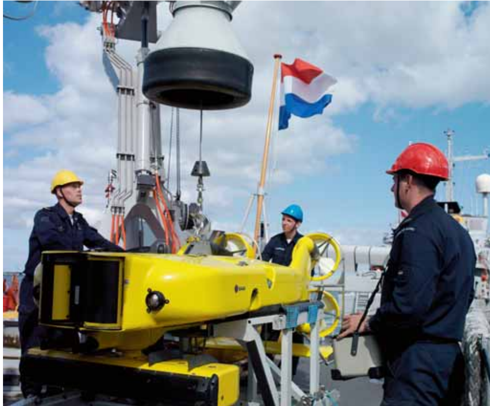
Gereedmaken onderwaterdrone op Mijnveger Hr. Ms. Urk.

uitstroom van personeel en een dreigend tekort aan kennis en expertise. De Commandant Zeestrijdkrachten is actief betrokken bij oplossingen voor deze problematiek. Zo is een belangrijke stap gezet met het (her)benoemen van een volledig voor andere taken vrijgestelde Groepsoudste Onderzeeboten om deze groep opnieuw identiteit en saamhorigheid te geven. Door de toepassing van een combinatie van maatregelen is in de tweede helft van 2008 een positieve trend waargenomen. Ook streeft de Commandant Zeestrijdkrachten in het kader van werwing en behoud naar verhoging van de huidige onderzeedienstvaarttoelage. Deze toelage, bedoeld om de verschillen in werk- en leefomstandigheden tussen de onderwatereenheden en de bovenwatereenheden te compenseren, is de afgelopen jaren nauwelijks aangepast. Omdat enerzijds de leef- en werkomstandigheden aan boord van de oppervlakteschepen aanzienlijk zijn verbeterd en anderzijds de accommodatie aan boord van de onderzeeboten nauwelijks is gewijzigd, leidt dit tot onbegrip en frustratie bij het zittende onderzeebootpersoneel. Daarnaast weerhoudt de huidige situatie het overige marinepersoneel ervan een functie op een onderzeeboot te ambiëren.