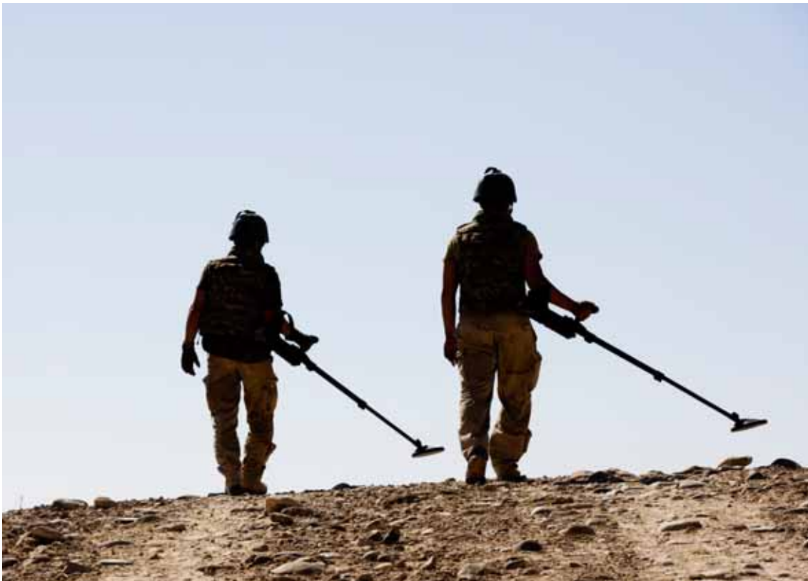
'Search'- activiteit naar Improvised Explosive Devices (IED), Afghanistan.

Naar aanleiding van mijn werkbezoek aan de missie in 2007 heb ik aanbevolen de kennis van maatregelen ter bestrijding van de dreiging van geïmproviseerde explosieven (Counter Improvised Explosive Devices) op de diverse niveaus beter te borgen. Tot mijn genoegen heb ik geconstateerd dat in dit verslagjaar hoge prioriteit is gegeven aan deze tegenmaatregelen. Niet alleen door het plaatsen van een speciale stafofficier Counter Improvised Explosive Devices binnen de staf van Regional Command South, maar met name door de oprichting en formalisering van de Task Force Counter Improvised Explosive Devices, rechtstreeks aangestuurd