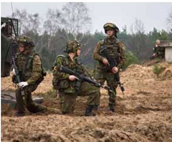
Gezamenlijke lucht- en landmacht oefening Uruzgan Integration.

Tot slot hebben vertegenwoordigers van mijn staf in de periode van 27 tot 31 oktober 2008 een bezoek gebracht aan Kreta in verband met het adaptatieprogramma voor het Nederlandse personeel dat terugkeert uit missiegebieden.