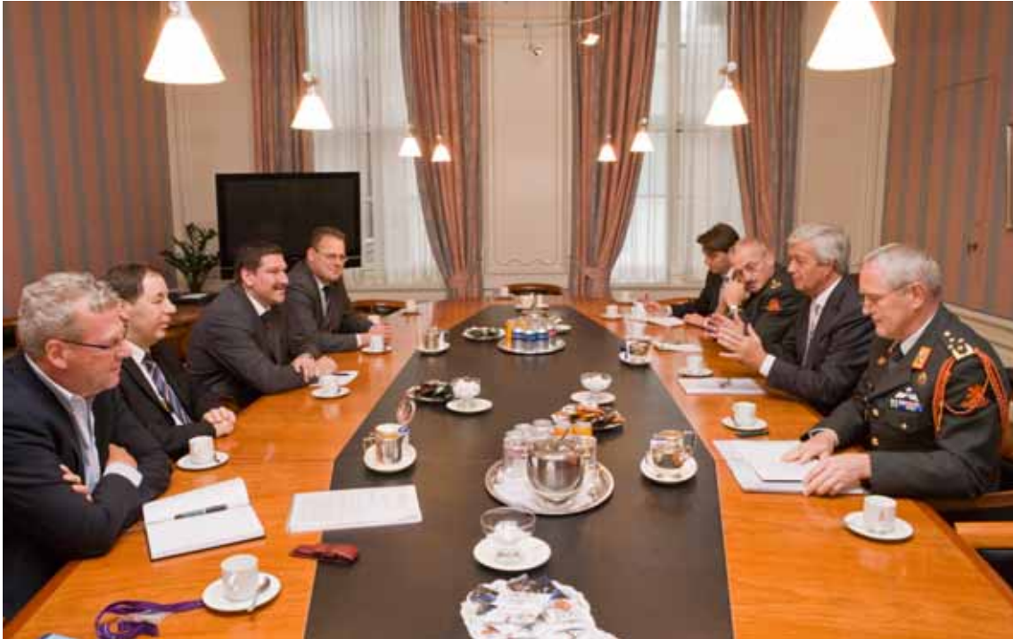
De minister in gesprek met de voorzitters van de centrales van overheidsperoneel.

Met de herinrichting van het personele functiegebied is een structurele besparing beoogd van 75 miljoen euro per jaar (1.500 functies). Per 1 september 2008 is 80% hiervan gerealiseerd. Gestreefd wordt naar een P&O-norm van 1:100 (ratio tussen P&O-functionarissen en medewerkers). Om dit streefcijfer te bereiken dienen nog 300 functies te worden gereduceerd. In dit hoofdstuk wordt hierop nader ingegaan.