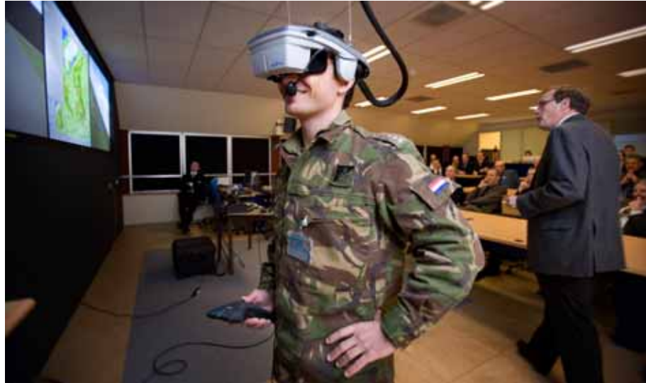
Overdracht Midlife Update van de Forward Air Controller (FAC) Simulator.