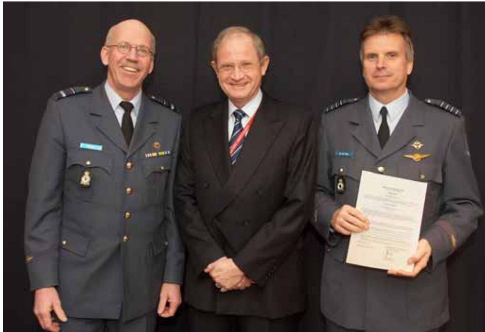
Uitreiking Militaire Luchtvaart Eis goedkeuringscertificaat door Directeur Militaire Luchtvaart Autoriteit aan Commandant Vliegbasis Eindhoven.

rekening is gehouden bij de vaststelling van de buitenlandtoelagen en waar nodig passende maatregelen te nemen. Er wordt inmiddels een inventarisatie gemaakt van gesignaleerde knelpunten. Vervolgens zal worden bezien op welke wijze hiermee dient te worden omgegaan.