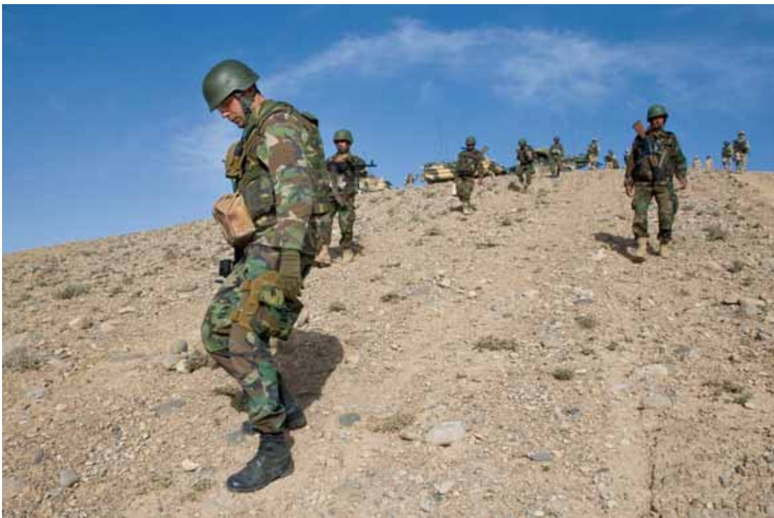
Een marinier van het Operational Mentoring and Liaison Team (OMLT) begeleidt militairen van het Afghan National Army tijdens een voetpatrouille.

voor het bewaken van de aanvraagketen. Bovendien heb ik vastgesteld dat ook de Defensie Materieel Organisatie op constructieve wijze bijdraagt aan de oplossing van deze problematiek. Tot slot is mij meegedeeld dat in de laatste periode van dit verslagjaar een verbetering is bereikt in de beschikbaarheid en opvoer van de noodzakelijke reservedelen, bijvoorbeeld motoren en versnellingsbakken. Ik zal de voortgang blijven volgen.