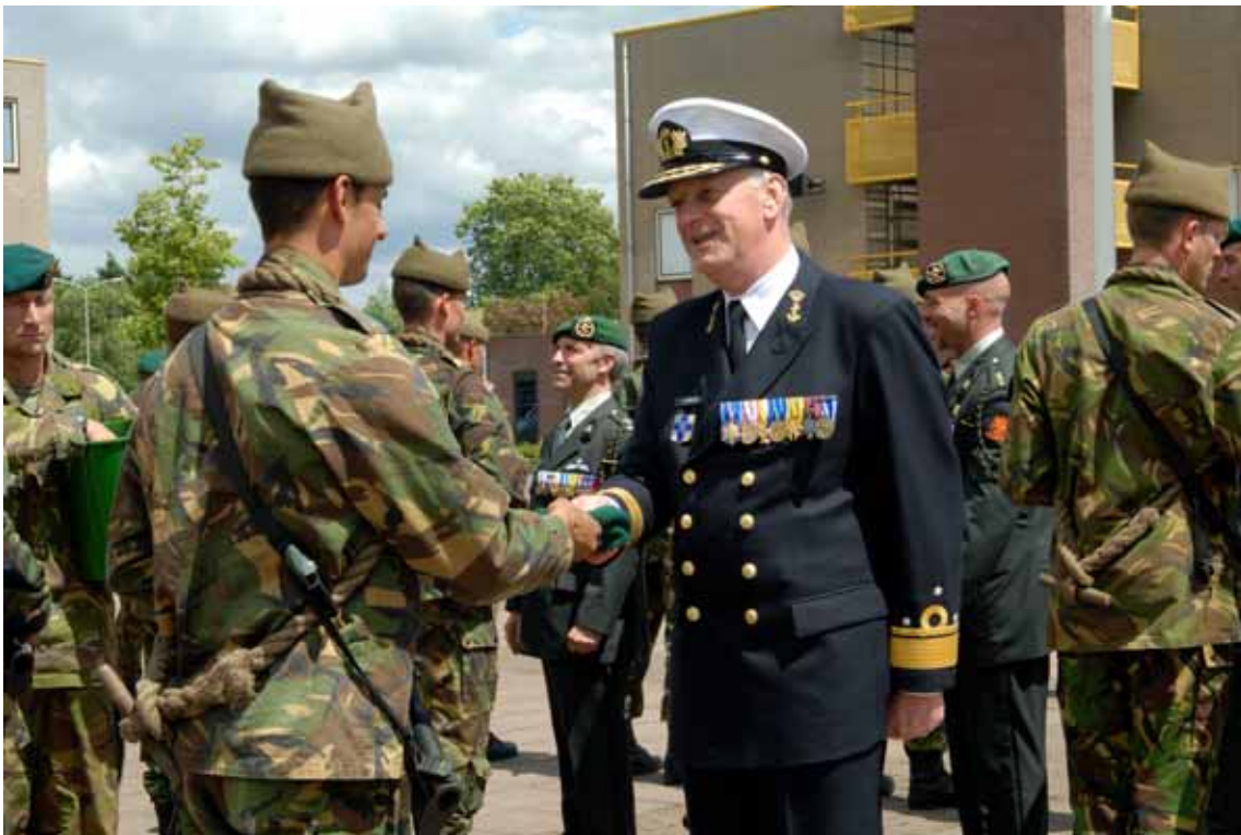
IGK reikt groene baret uit aan nieuwe commando.

Sinds de oprichting van het hoofdkwartier in 1995 heeft de Duits-Nederlandse samenwerking zich in positieve zin ontwikkeld tot op groepsniveau. Het naasthogere niveau (Joint Forces Command Naples) heeft de staf in de afgelopen periode gecertificeerd, waardoor de 'High Readiness'-status wederom voor drie jaar is verzekerd. In 2009 zal een groot deel van deze staf worden ingezet binnen het hoofdkwartier van ISAF. Tevens zullen functies worden vervuld binnen de staf