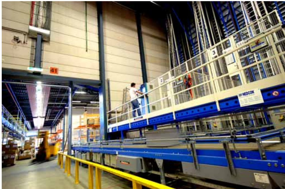
Magazijn Kleding en Persoonsgebonden Uitrusting (KPU) bedrijf.

lijke problemen bij levering van producten. Onzekere factoren kunnen worden opgevangen door de aanleg van een (bepaalde) reservevoorraad. Het verbruik, de geschatte levensduur en mogelijke onderhoudscapaciteit moeten bepalend zijn bij voorraadbeheer in plaats van beschikbare financiële middelen.