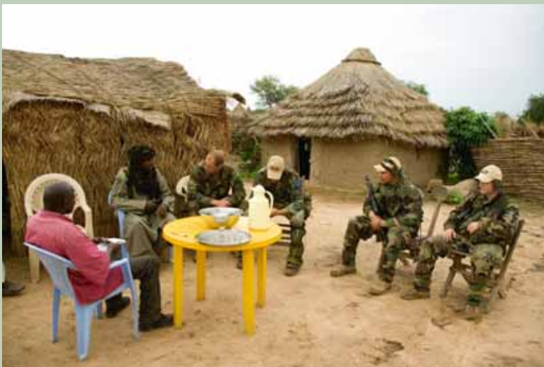
Nederlandse militairen in gesprek met de gezaghebbers van Ade, Tsjaad.

Ook in 2008 heeft de Nederlandse defensieorganisatie tot in alle onderdelen voelbare inspanningen geleverd om de formering, de gereedstelling, de inzet en de afwikkeling van het personeel en materieel ten behoeve van de lopende missies