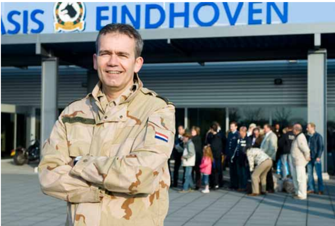
Medewerker Informatievoorziening en Technologie (IVENT) vertrekt op missie.

Het bureauhoofd heeft erop gewezen dat veelal per missie sprake is van een andere wijze van aansturing van de uitvoering, en dat per missie verschillende procedures van toepassing zijn (afhankelijk van de vraag of het een reguliere uitzending, een uitzending onder de vlag van de Verenigde Naties, dan wel een uitzending in het kader van Security Sector Reform betreft). Daarnaast heeft het bureau te maken met meerdere coördinerende operationele commando's. Ook is erop gewezen dat in een enkel geval sprake is van meerdere formerende eenheden voor één missie (SSR Burundi). Door het gebrek aan continuïteit en uniformiteit bij de verschillende uitzendingen ervaart het hoofd van het Bureau Individuele Uitzendingen dat het veel moeite kost het overzicht te houden over alle lopende missies. Ook heeft hij vastgesteld dat zijn eenheid met de huidige bezetting en onder de huidige omstandigheden niet in staat is als formerende eenheid op te treden voor alle individuele missies. Verder heeft hij opgemerkt dat tot op heden een geaccepteerde visie ontbreekt op het benodigde opleidingstraject voor individueel uit te zenden militairen (inclusief de benoeming van de hiervoor verantwoordelijke eenheid), er voortdurend overleg moet plaatsvinden over budgetten en de afstemming binnen en tussen de diverse secties van de Directie Operaties van het Commando Landstrijdkrachten dikwijls moeizaam verloopt.