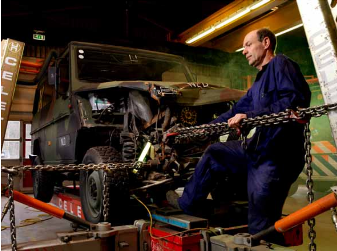
Herstelwerkzaamheden aan Mercedes Benz.

gegeven meer bevoegdheden nodig te hebben om personeel op die functies te plaatsen waarvan de vulling prioriteit heeft bij het realiseren van de resultaten die zijn afgesproken met de klanten. Dit geldt evenzeer voor militair personeel waarvan de operationele commando's plaatsingsautoriteit zijn.