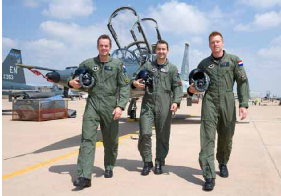
Vliegers in opleiding op Sheppard Airforce Base, Verenigde Staten.

Tijdens diverse werkbezoeken is mij duidelijk geworden dat de operationele taakuitvoering vanwege personeelstekorten steeds meer onder druk komt te staan. Ondanks enkele financiële maatregelen is de irreguliere uitstroom onverminderd hoog. Als voornaamste oorzaak noemt het personeel vooral de hoge uitzenddruk bij het thuisfront. Behoud van personeel is essentieel om het benodigde voortzettingsvermogen te kunnen handhaven. Uitbreiding en intensivering van de opleidingscapaciteit, in combinatie met verruimde inzet van reservepersoneel biedt mogelijkheden om de hoge uitzenddruk te verminderen en de uitstroom van ervaren personeel te beperken.