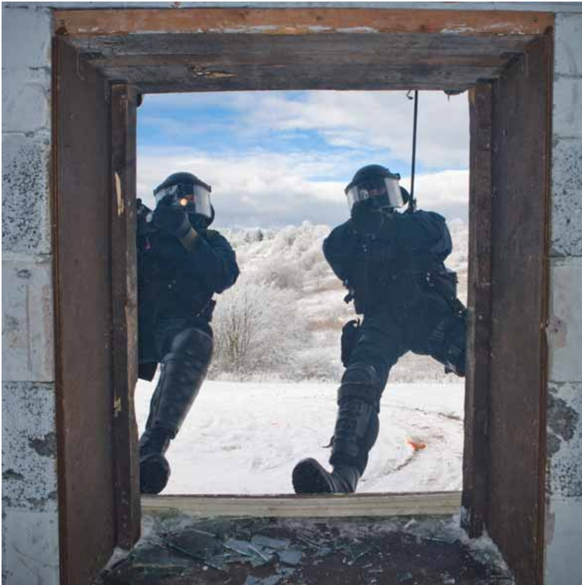
Maritieme Special Operations Forces oefenen in Wildflecken, Duitsland.

2008 is ook een jaar geweest van 'lessons learned' met betrekking tot de nieuwe organisatiestructuur. Ten aanzien van het nieuwe functietoewijzings- en loopbaansysteem is gestreefd naar een betere en directere communicatie met het personeel en een duidelijkere structuur. Tevens is besloten om vooralsnog bij wijze van proef de functies Groepsoudste Mijnenjagers en Groepsoudste Onderzeeboten tot niet-gebonden hoofdfuncties te maken om daarmee de groepsbinding en synergie te vergroten.