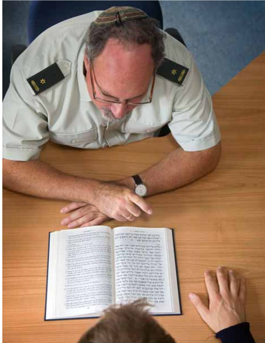
Rabbin in gesprek.

en facilitaire ondersteuning. Ook is de status van de geestelijk verzorger onduidelijk. De geestelijk verzorger is aangesteld als burger maar valt deels terug op de status van militair. In dit kader is wrevel over de uitvoering van de rechtspositie van de geestelijk verzorger. Verder is de relatie met de defensie-eenheid waar de geestelijk verzorger werkzaam is, onduidelijk. De geestelijk verzorger is, ongeacht zijn plaats van tewerkstelling, geplaatst bij het Commando DienstenCentra met standplaats Den Haag. De administratieve ondersteuning wordt dan ook verzorgd vanuit Den Haag en niet door de eenheid waarvoor de werkzaamheden worden verricht. De geestelijk verzorger voelt zich daardoor niet in het onderdeel opgenomen.