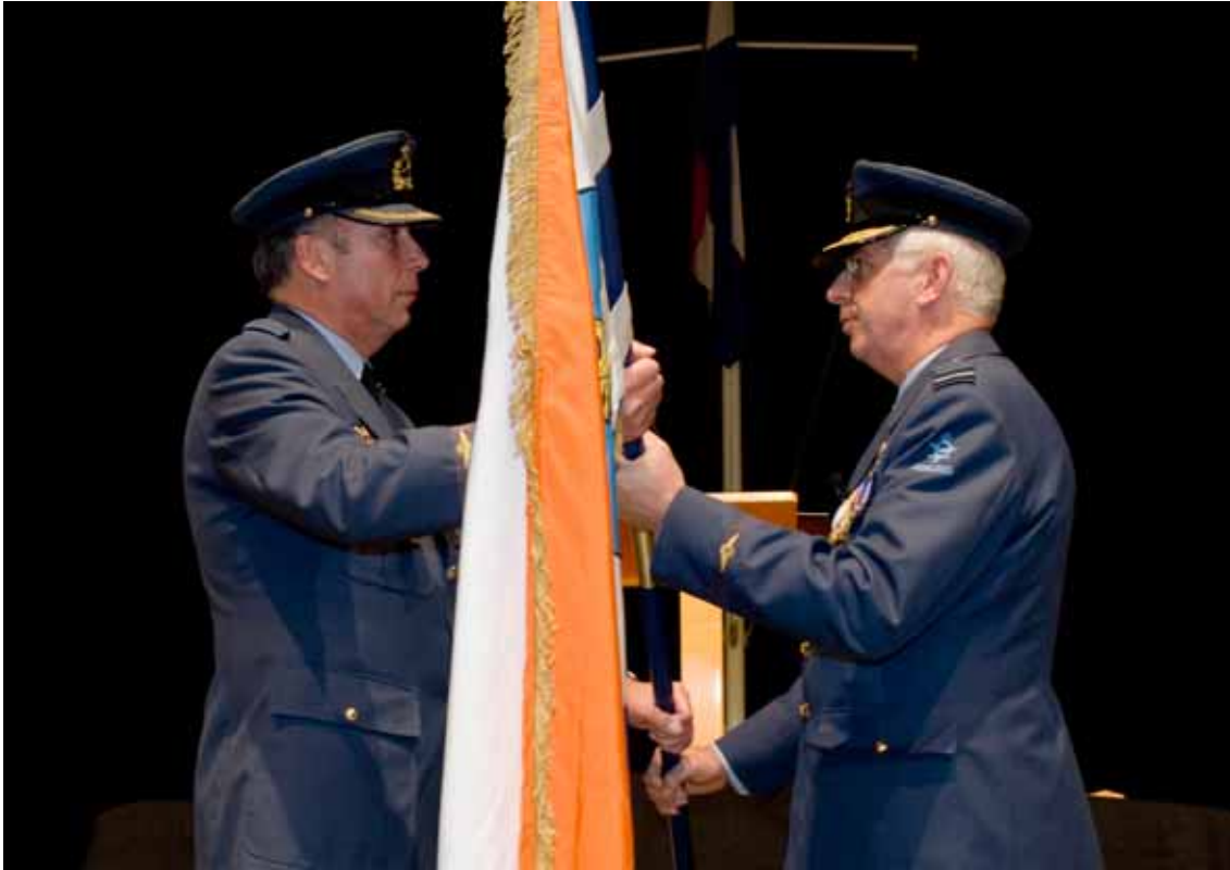
Teruggave commando Vliegbasis Soesterberg.

(Verenigde Arabische Emiraten) is ongewijzigd gebleven. Tijdens mijn werkbezoek in september aan eenheden van de Air Task Force (in Kandahar en Tarin Kowt) en het personeel van het Airport of Debarcation Detachment Minhad is mij opnieuw de grote inzetbereidheid van het personeel opgevallen, alsook de toewijding aan de ISAF-missie.