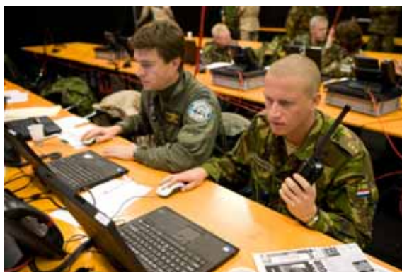
Stafoefening Taskforce Uruzgan-6 op Prins Maurits kazerne in Ede.

inzetbaarheid van het materieel. Door slijtage is het verbruik van reservedelen groot. Tijdens mijn gesprekken heb ik herhaaldelijk onbegrip bij het personeel geconstateerd over achterblijvende leveringen en gebrek aan terugkoppeling over de voortgang van de materieelaanvragen. Deze problematiek, die voornamelijk te wijten is aan een te laag voorraadniveau, gebrek aan geautomatiseerde ondersteuning voor artikelen die niet uit voorraad leverbaar zijn, gebrek aan personele capaciteit en naweeën van de verplichtingenstop in 2006 en 2007, heeft volgens de commandant van de Task Force Uruzgan nog