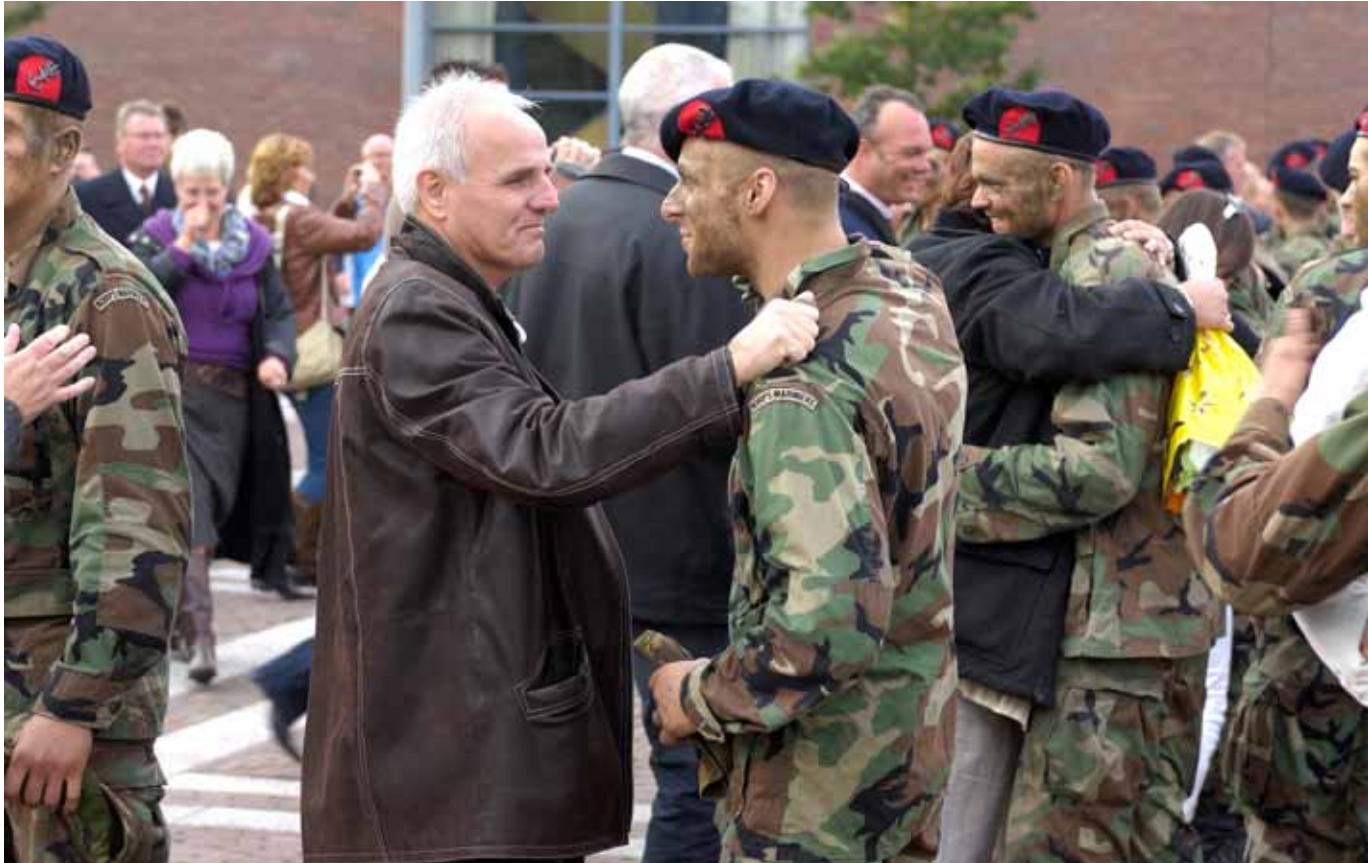
Mariniers ronden opleiding af.

Naast de sociaal-emotionele redenen moet naar mijn oordeel in dit kader ook blijvende aandacht worden besteed aan de tijdige eerste verstrekking van de persoonlijke uitrustingsstukken. Zie hiervoor ook de uitkomsten van het thema-onderzoek Demotiverende materieelaspecten, die in dit verslag zijn opgenomen (hoofdstuk 10).