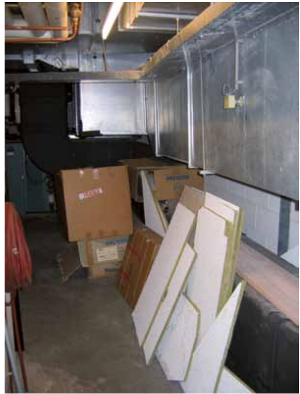
Opslag brandbare materialen in stookruimte

Bij vijf bureau's werden in strijd met de voorschriften brandbare goederen in de stookruimte aangetroffen.