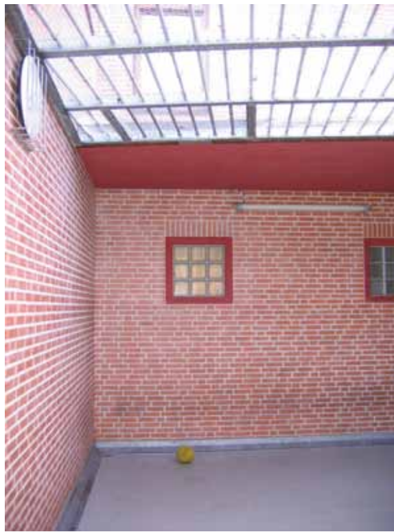
Luchtplaats met ontsnappingsluik

In politiebureau's waar tekortkomingen met de brandcom- partimentering zijn geconstateerd, was de rookcomparti- mentering meestal ook niet op orde.