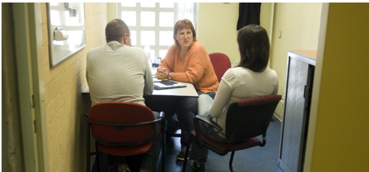
Regelmatig komen gemeenteambtenaren naar De Koepel om de terugkeer van hun burgers voor te bereiden.

Hierdoor zijn wij goed op de hoogte van de zorgbehoefte van de betrokken gedetineerden, de eventuele overplaatsing naar behandellocaties en de termijn waarop onze ketenpartners de betrokkenen weer terug kunnen verwachten. Dit biedt goede aanknopingspunten voor het - op termijn - realiseren van continuïteit van zorg.”