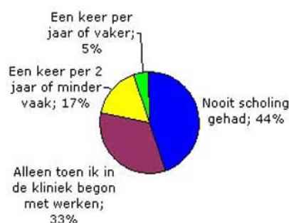
Grafiek 1 Respons op de vraag naar de frequentie van scholing over de rechtspositie van terbeschikkinggestelden.

rechtspositie te hebben gehad toen hij/zij in de tbs-inrichting begon met werken. Een andere groep medewerkers (17 procent) 4 geeft aan één keer per twee jaar of minder vaak scholing te hebben gehad. Vijf procent 5 geeft aan één keer per jaar of vaker geschouwd te zijn in de rechtspositie van verpleegden.