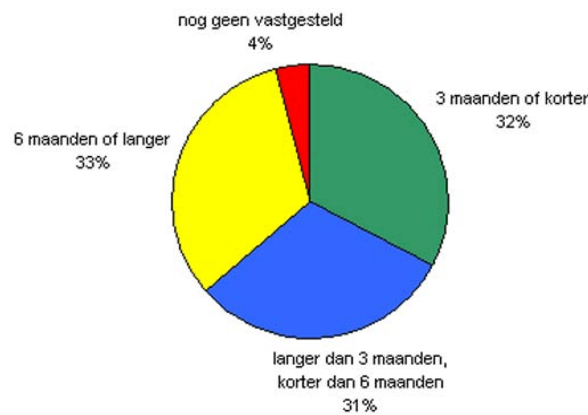
Grafiek 2 Respons op de vraag hoe lang terbeschikkinggestelden na binnenkomst in de inrichting op hun verplegings- en behandelingsplan hebben moeten wachten.

Uit de enquête komt naar voren dat eenderde 40 van de terbeschikkinggestelde zes maanden of langer heeft moeten wachten voordat het verplegings- en behandelingsplan vastgesteld is. Dertig procent 41 geeft aan langer dan drie maanden, maar korter dan zes maanden te hebben moeten wachten. Bij eenderde 42 van de verpleegden was het verplegings- en behandelingsplan wel binnen drie maanden opgesteld (zie grafiek 2).