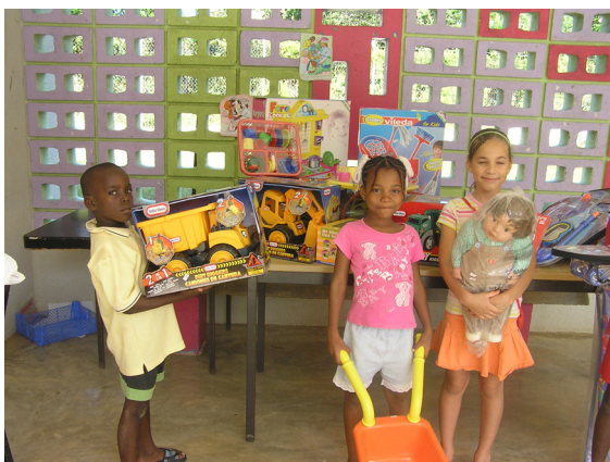
Kinderen Huize St. Jozef met nieuw speelgoed

De toekenning van het geld is voornamelijk besteed aan het opknappen van het gebouw en de brandbeveiliging (65.7%). Hiernaast is met 15.9% van de middelen de buitenspeelplaats opgeknapt.