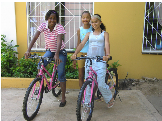
Jongeren Huize St. Jozef met nieuwe fietsen