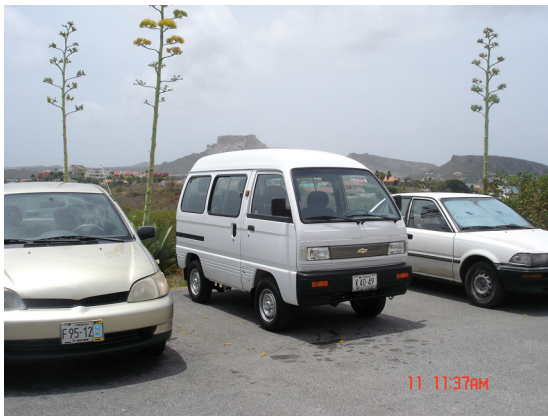
Nieuw busje Kinderorden Brakkeput

Een andere aanpassing is ook dat het tehuis aanvankelijk een bus zou aanschaffen waarin 15 personen kunnen worden vervoerd. Uiteindelijk hebben zij uit praktisch oogpunt twee bussen aangeschaft die zitplaatsen bieden voor 8 personen. De reden hiervoor is dat het besturen van een bus van 15 passagiers een groot rijbewijs vereist. Dit leidt tot beperkingen voor de inzet van mankracht als de chauffeurs met een groot rijbewijs niet beschikbaar zijn. Door het aanschaffen van de kleinere bussen kunnen de medewerkers ingezet worden om de bussen te besturen. De aanschaf van de twee bussen heeft geen consequenties gehad voor het budget.