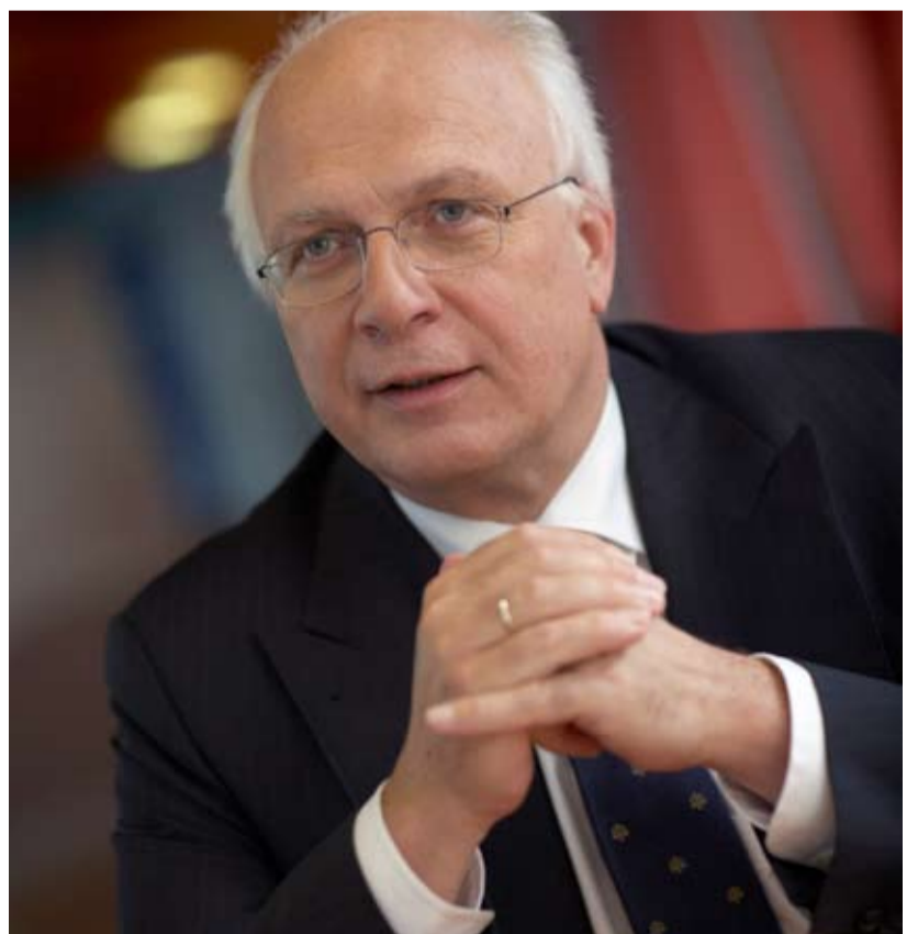
Harm Brouwer, voorzitter College van procureurs-generaal

Harm Brouwer Voorzitter College van procureurs-generaal