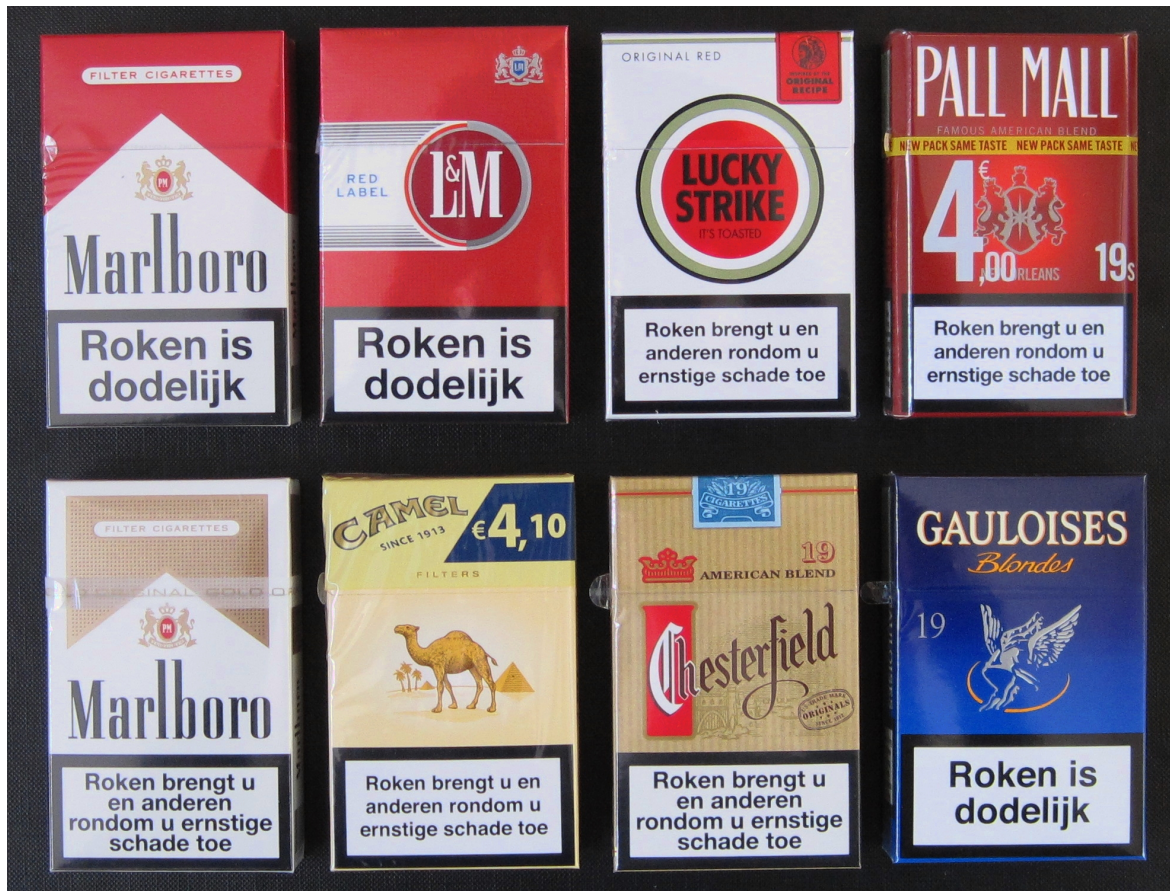
Figuur 2 Afbeeldingen van de verpakkingen van de acht 'meest gerookte' sigarettenmerken.