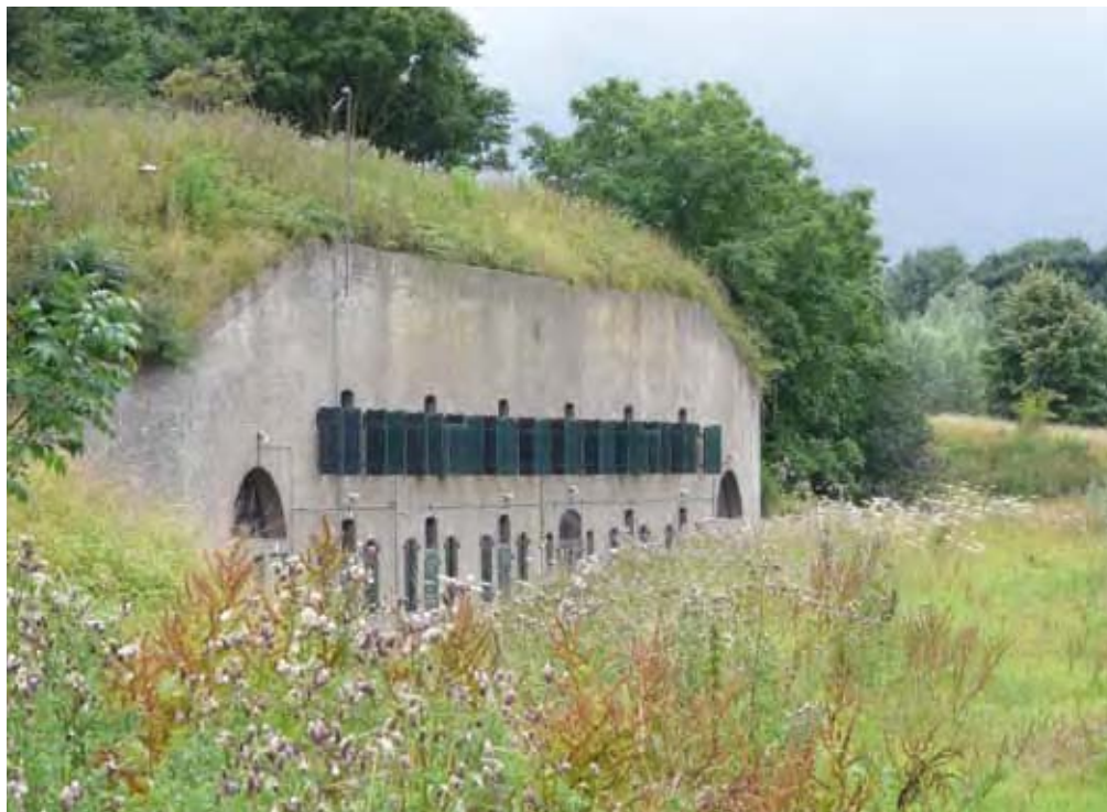
Rijnauwen-Vechten: fort 't Hemeltje