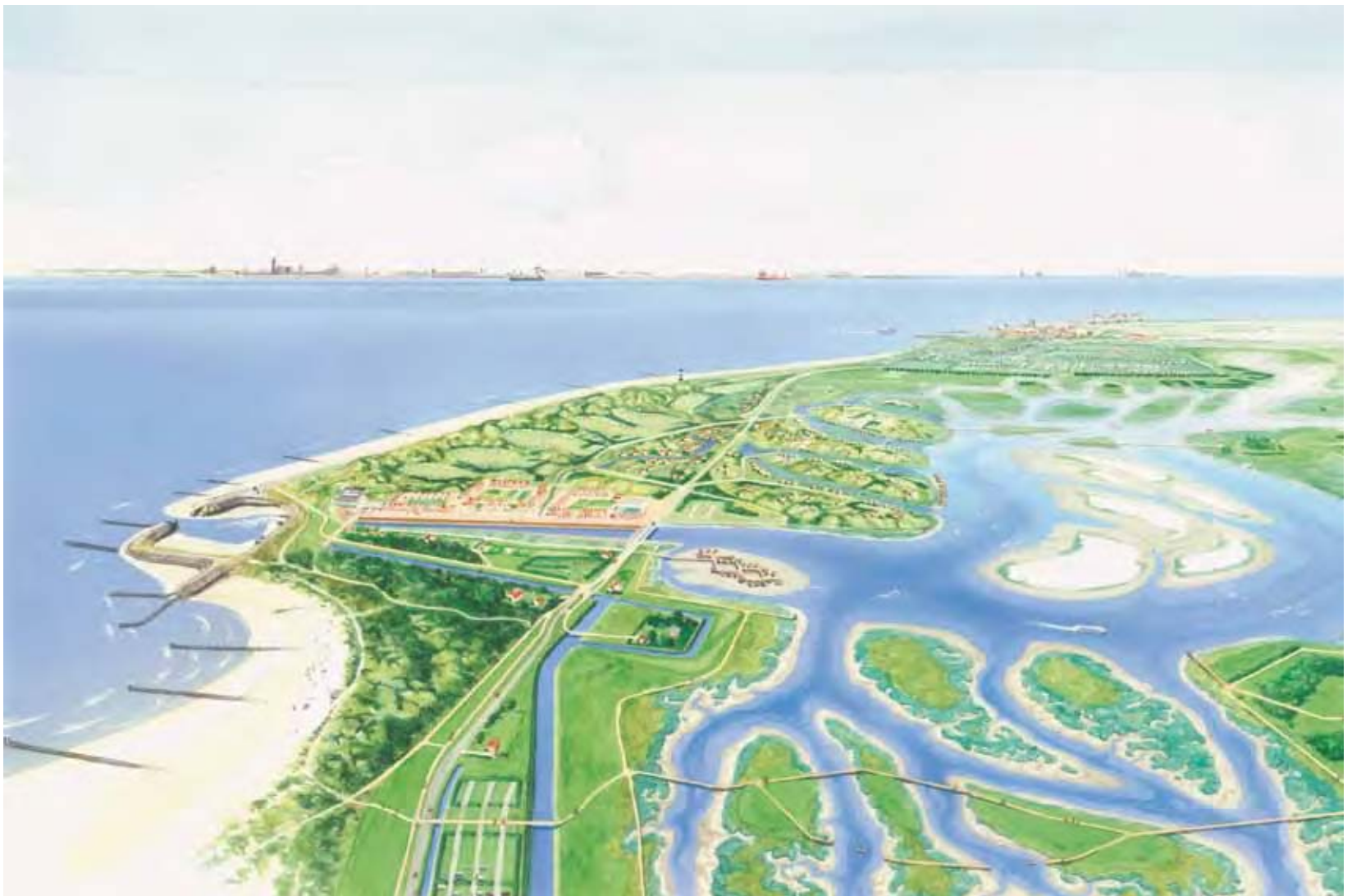
Birds-eye view Waterdunen

wijlen Thijs Kramer , gedeputeerde Zeeland, voorzitter stuurgroep en inspirator project