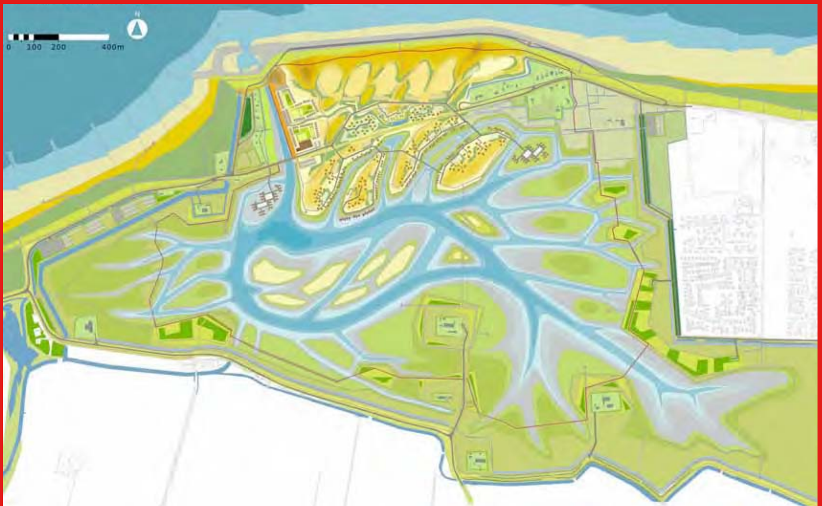
Inrichting Waterdunen (situatie 2020)