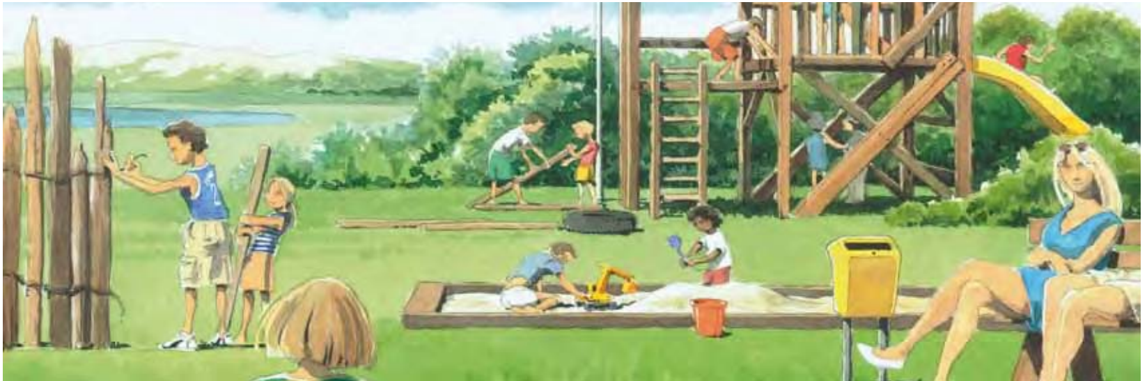
Recreëren in zilte natuur