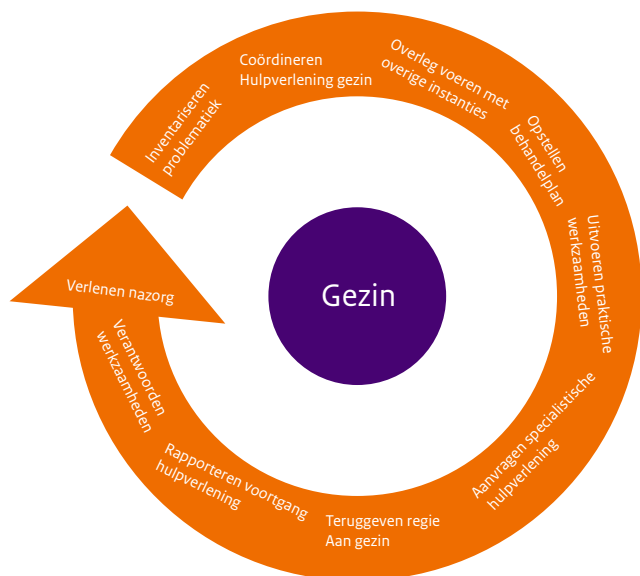
Figuur 2. Schematische weergave taken gezinsmanager

In figuur 2 staan de taken van de gezinsmanager schematisch weergegeven. Hierbij moet worden opgemerkt dat de taken niet altijd na elkaar worden uitgevoerd, maar parallel. Daarnaast lopen de taken in elkaar over en vloeien uit elkaar voort.