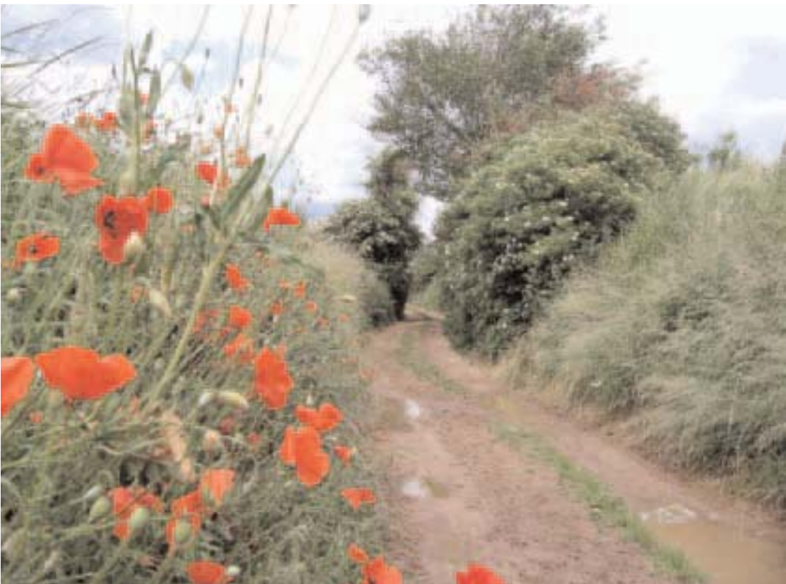
Nationaal Landschap Heuvelland in Zuid- Limburg