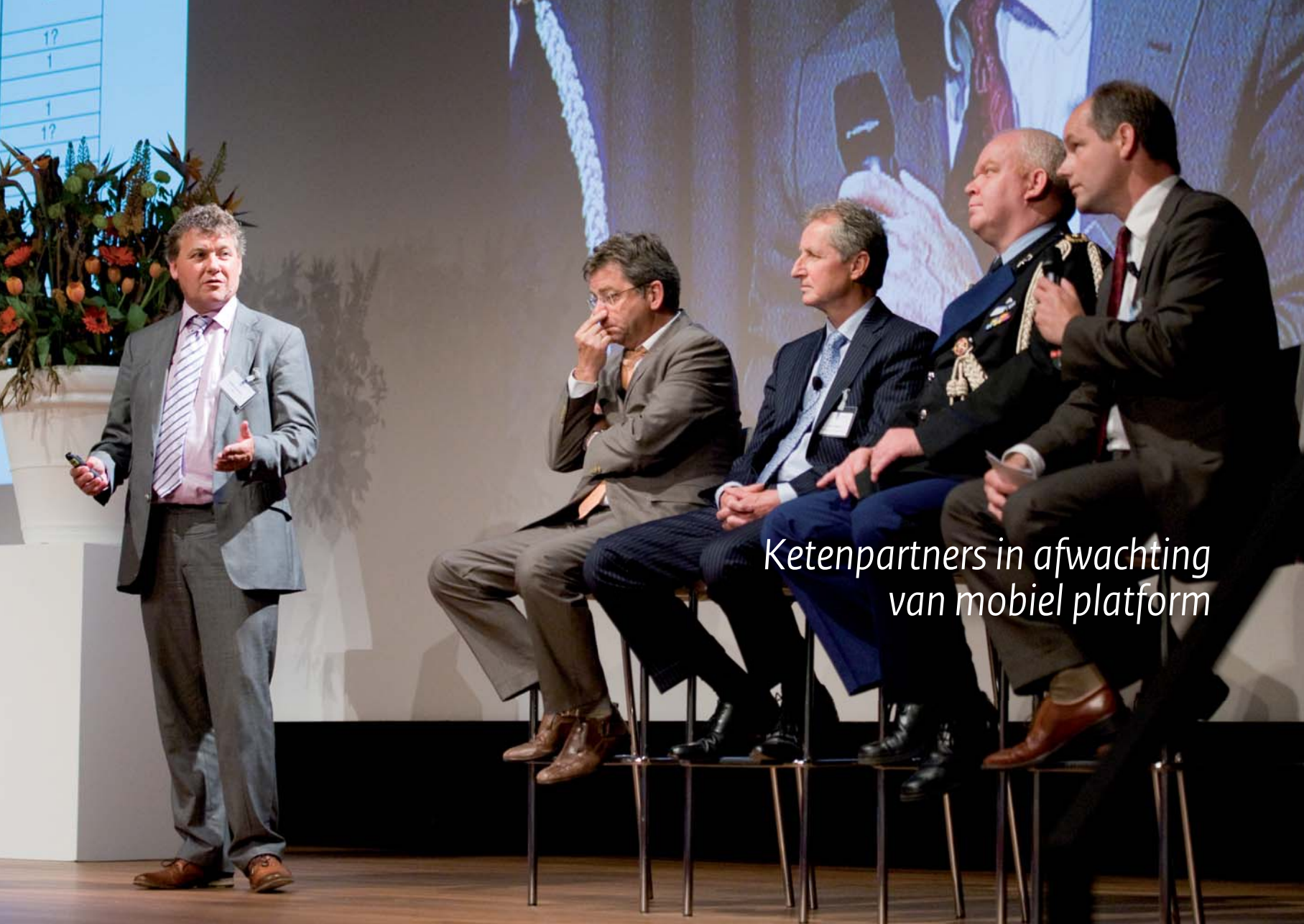
Ketenpartners in afwachting van mobiel platform