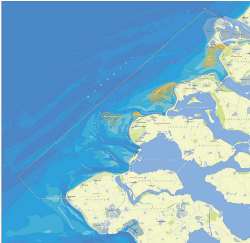
Figuur 2: Voordelta en het daarin gelegen bodembeschermingsgebied (binnen de rode contour) met rustgebieden (geel: jaarrond en geel gearceerd: alleen gedurende de winter)

Onderstaande figuur 2 laat zien waar het bodembeschermingsgebied met de bijbehorende rustgebieden is gelegen in de Voordelta.