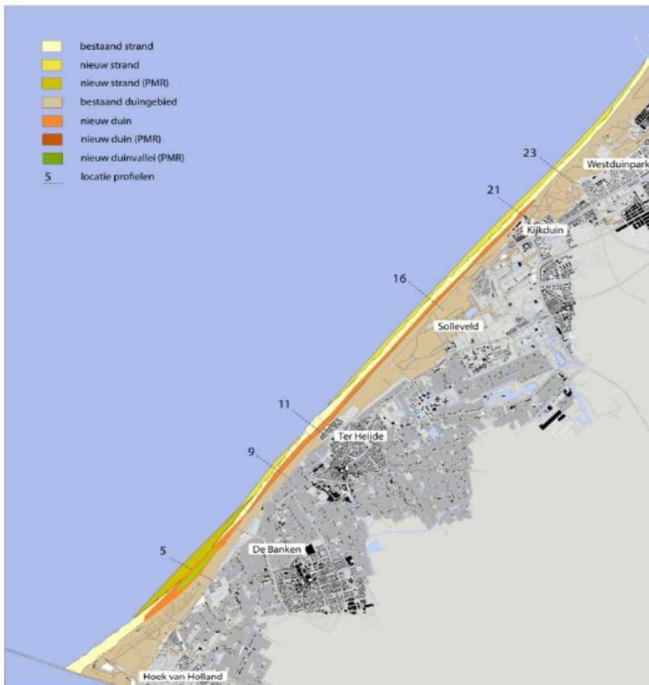
Figuur 1: Locatie duincompensatie Delflandse Kust en zwakke schakel Delfland.

Onderstaande figuur 1 laat de locatie zien waar de duincompensatie in combinatie met de versterking van de zwakke schakel Delfland zijn aangelegd.