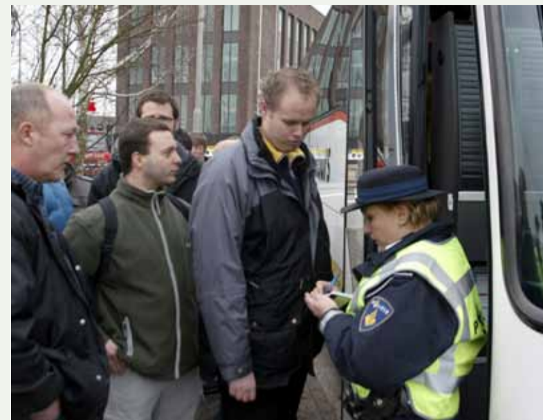
Bij een ontruimingsoefening van een discotheek noteert een politieagente gegevens van de jongeren en houdt bij wie naar welke sporthal wordt gebracht voor opvang.

Voor de registratie van de gegevens van (mogelijke) verwanten en vermisten wordt een frontoffice ingericht met een centrale website en een landelijk telefoonnummer. Het resultaat van