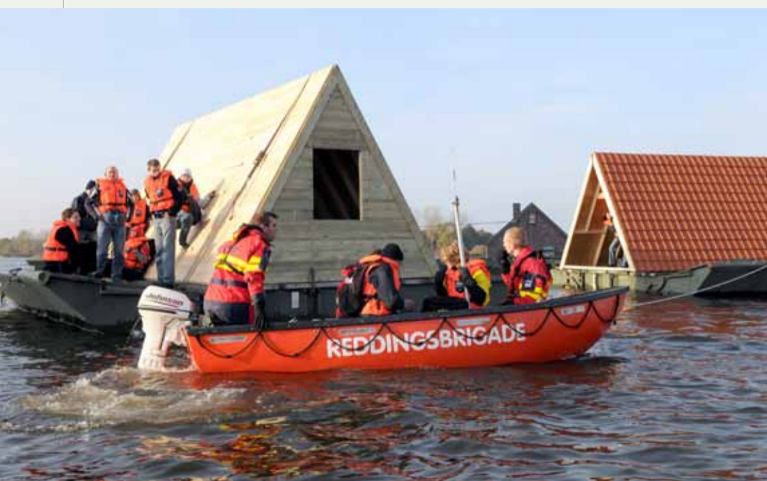
Reddingsbrigade actief tijdens een overstromingsoefening.

De KNRM en reddingsbrigades worden nogal eens door elkaar gehaald of voor één organisatie aangezien. Het zijn echter twee verschillende organisaties met hun eigen historie en hun eigen vrijwilligersbestanden. Beide organisaties zijn gericht op het redden van mensen uit het water, met als belangrijkste onderscheid dat de KNRM over grotere robuuste reddingsboten beschikt die ook onder zware weerscondities ver op open zee kunnen opereren en grotere aantallen mensen kunnen vervoeren.