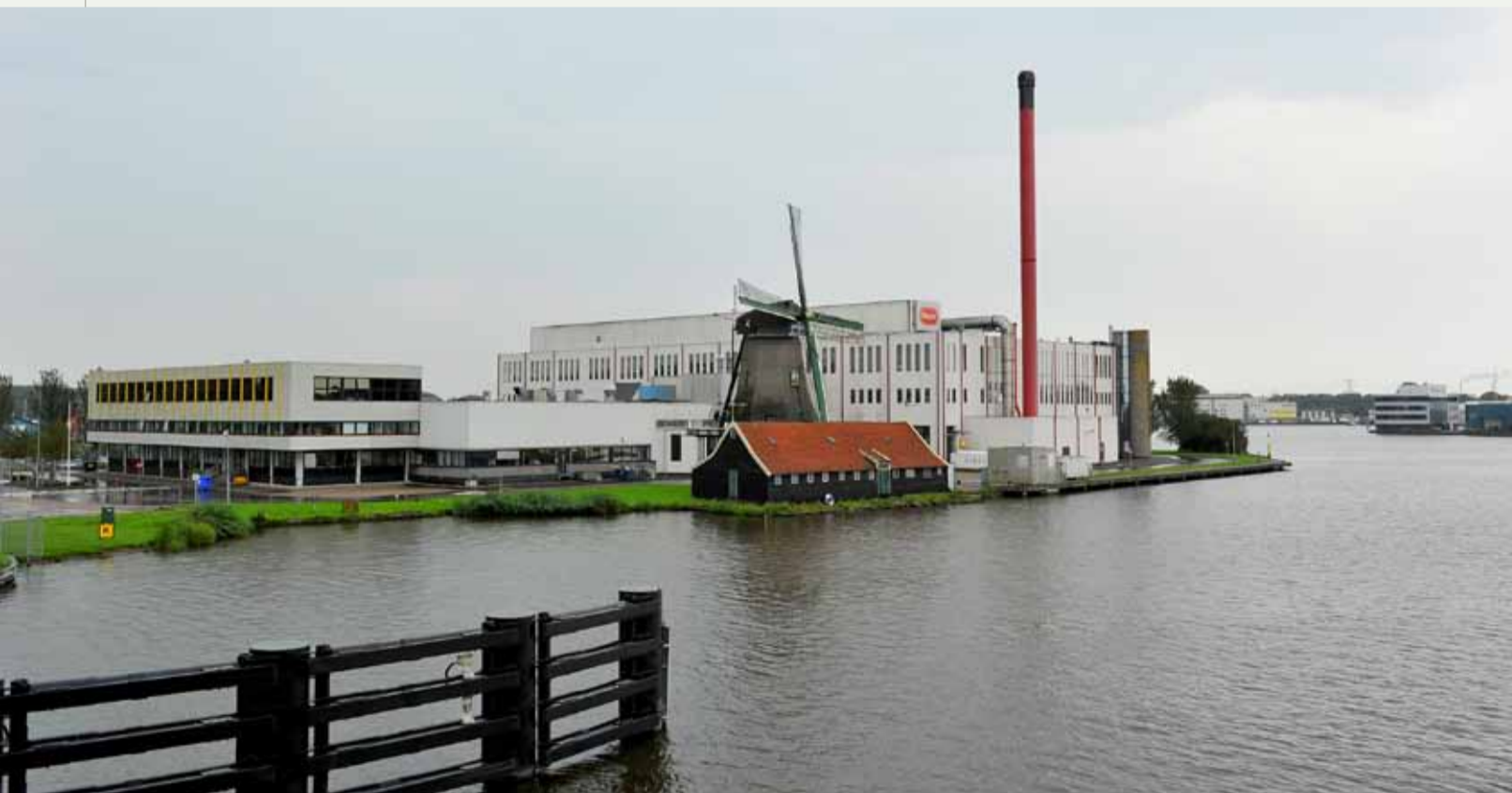
Industrie langs de Zaan, het oudste industriegebied van West-Europa.

Een belangrijk kenmerk van de Zaanstreek is de hier veelvuldig voorkomende combinatie van wonen en werken. De industrieën staan veelal dichtbij of zelfs midden in woonwijken. Volgens de Zaanse burgemeester Geke Faber is dat aan de ene kant de charme van het gebied, waaraan de inwoners van de Zaanstreek al eeuwen gewend zijn, maar aan de andere kant een risicoverhogende factor. Deze cumulatie van risico's in een regio met sterk verschillende gezichten maakt duidelijk waarom ook een kleine regio als Zaanstreek-Waterland een robuuste regionale veiligheidsorganisatie met flinke slagkracht nodig heeft.