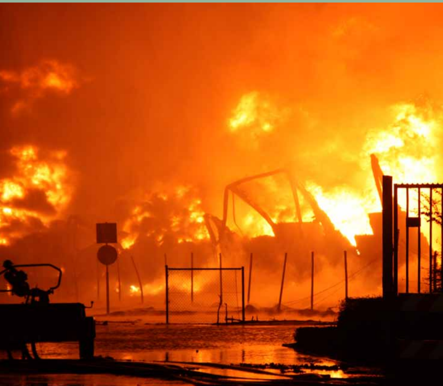
De brand bij Chemie-Pack in Moerdijk