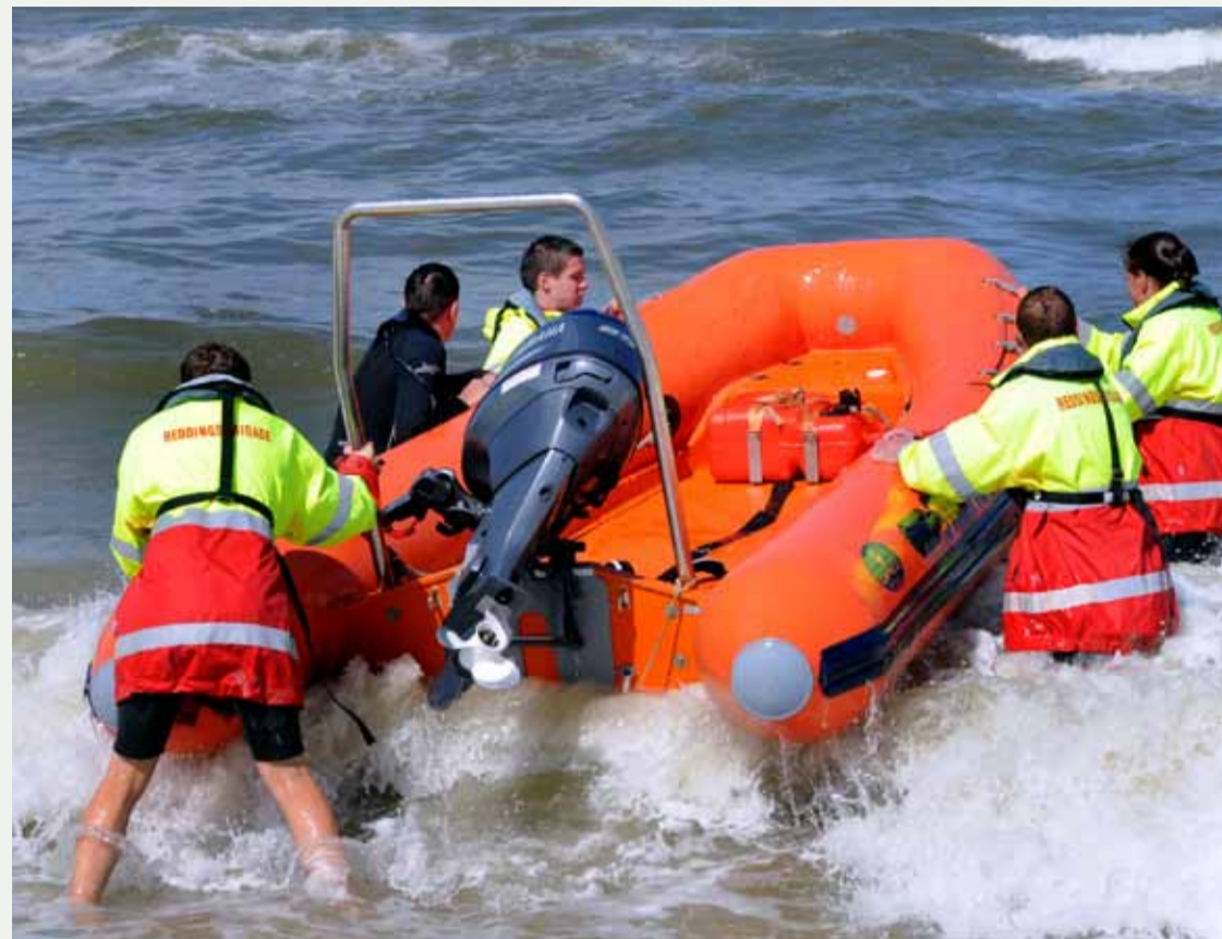
Reddingsbrigade met strandbewakingstaak.

lening en redding en evacuatie van mensen bij overstromingen vormen het takenpakket van de reddingsbrigades. De cijfers tonen aan dat het werk van de brigades er toe doet: In 2010 kwamen de brigades 10.500 keer in actie en werden ruim 300 mensen uit levensbedreigende situaties gered.