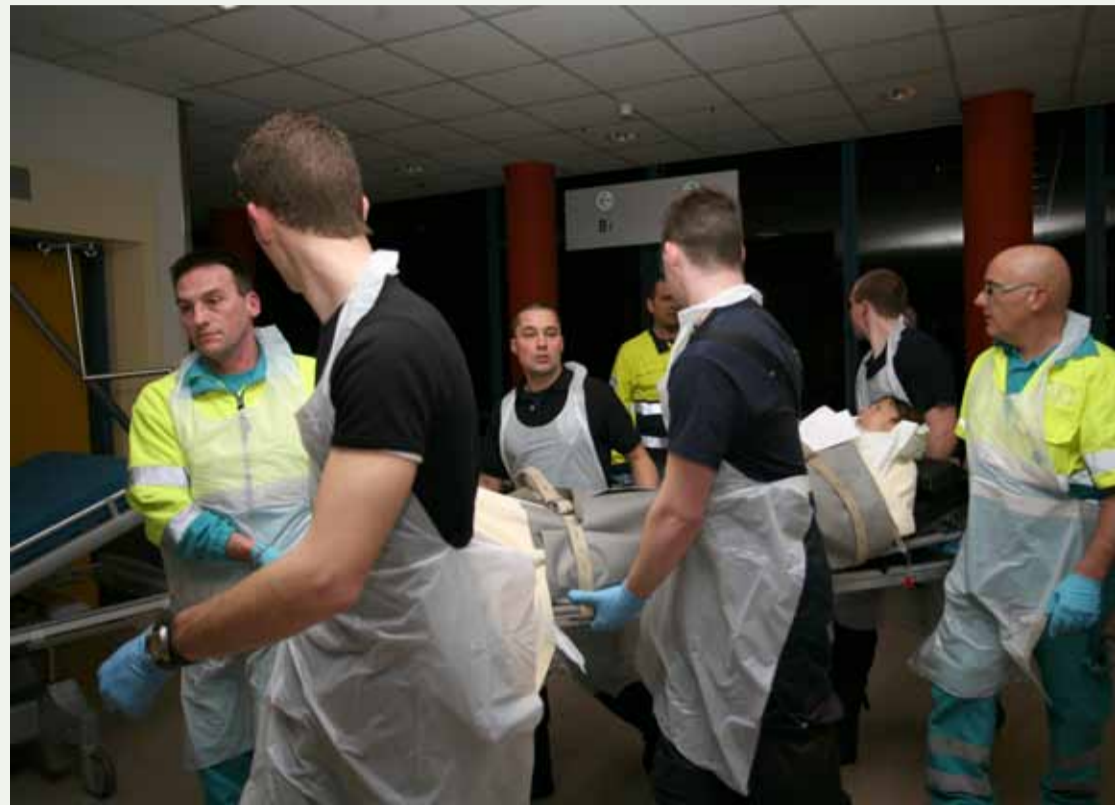
De evacuatie van Meander in volle gang.

Bouwwerkers, onwonenden en hulpverleners helpen ter plaatse de bewoners van zorgcentrum De Geinsche Hof.