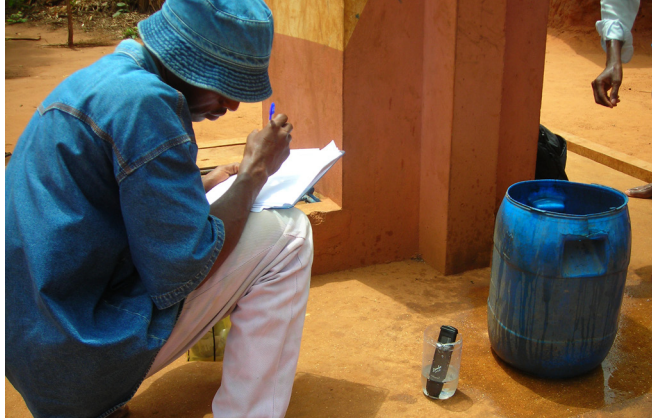
Testen van de kwaliteit van het water in Benin

gestegen. In de zogenoemde Community Approach to Total Sanitation (CATS) in Mozambique confronteren Unicef en lokale ngo's gebruikers met door uitwerpselen vervuild water en voedsel, en belonen zij tegelijk dorpen waar mensen zich niet langer buiten in het veld ontlasten. In een korte periode hebben in meer dan vierhonderd dorpen mensen zelf tegen minimale kosten en met lokale materialen eenvoudige toiletten aangelegd. Dat is een mooi resultaat, maar de voor ziektevermindering belangrijke afscherming van uitwerpselen van menselijk contact kan nog beter. Deze programma's in Bangladesh en Mozambique zijn te recent gestart om de duurzaamheid ervan te kunnen bepalen.