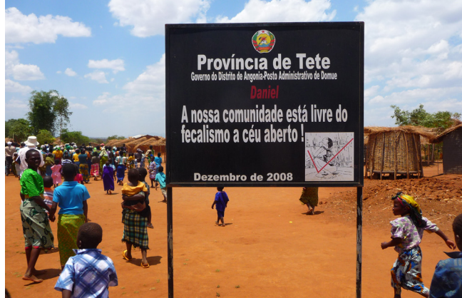
Gemeenschap in Mozambique die vrij van uitwerpselen is verklaard

Er wordt echter onvoldoende kennis verzameld over de effecten van interventies en over factoren die de kwaliteit en duurzaamheid van voorzieningen beïnvloeden. Hierbij wordt aangetekend dat de