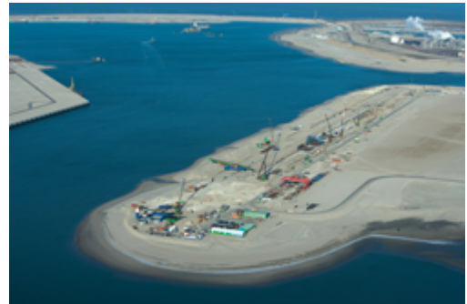
Foto: Kade APMT in aanbouw (februari 2012)