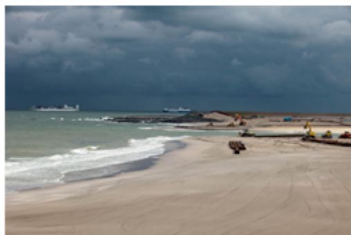
Foto: Na startsein van HM Beatrix sluiting Sluitgat (11 juli 2012)

Het sluiten van het Sluitgat op 11 juli 2012 (noot: valt buiten rapportageperiode)