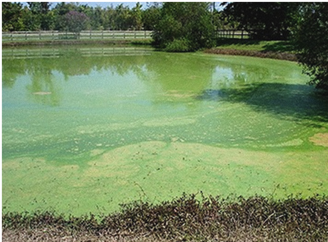
De kweek van microalgen speelt een belangrijke rol in milieuvriendelijke productie van grondstoffen voor biodiesel. Daarnaast leveren algen tal van andere nuttige stoffen voor de levensmiddelen- en chemische industrie.