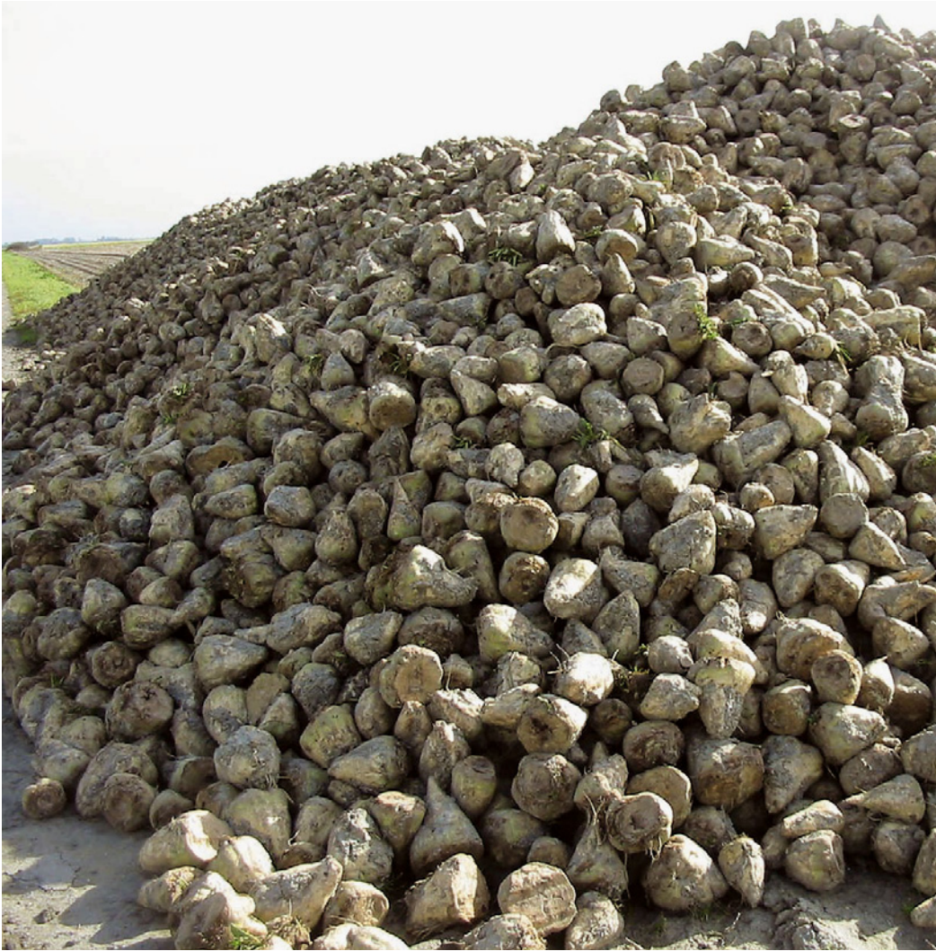
Suikerbieten kunnen groene stroom leveren

ma dwars op zoveel andere thema's staat. Daar speelt Roel Bol dus een heel belangrijke rol. Ondanks de bureaucratie zijn we een heel eind gekomen." De verhouding tot de klassieke 'lijn' is complex. Komt er niet het moment dat het programma 'de lijn in geschoven wordt'? "Wat dat laatste betreft hebben we in zekere zin geluk dat we zo complex zijn geworden dat niemand in de lijn het programma als geheel wil claimen, en dat geeft ruimte. Het nadeel is dan wel dat het soms lastig is om geld los te krijgen."